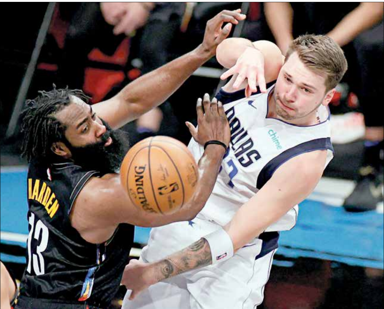
سجا دونتشيتش 27 نقطة مع سبع تمريرات حاسمة وست متابعات

قاد العملاق السلوفيني لوكا دونتشيتش فريقه دالاس مافريكس إلى وقف الانتصارات المتتالية لخصفه بروكلين نتس، ثاني المنطقة الشرقية، عندما تغلب عليه 98-115، فيما استعاد يوتا جان منصهر الدوري والمنطقة الغربية، توازته بفوزه على مصفحة اورلاندو ماجك 109-124، في دوري كرة السلة الأميركي للمحترفين. في المباراة الأولى، سجل دونتشيتش 27 نقطة مع سبع تمريرات حاسمة وست متابعات، لتساهم في الفوز السادس عشر في 32 مباراة حتى الآن للفريق، وإحراق الحسارة الأولى ببروكلين نتس، ثاني المنطقة الشرقية، بعد ثمانية انتصارات متتالية، والثالثة عشرة في 35 مباراة هذا الموسم، واستغل