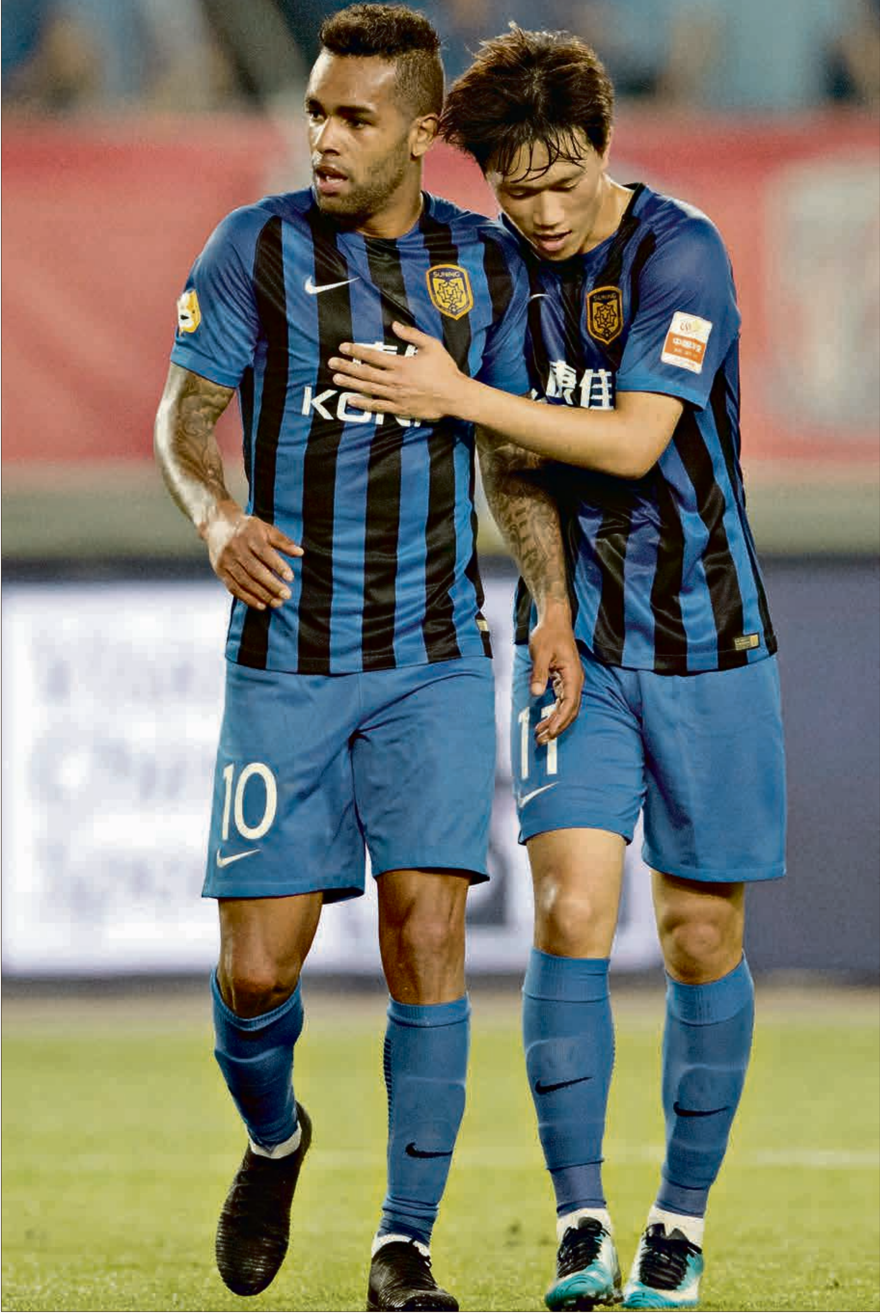
غيانغسو بطل الدوري الصيني في 2020

أعلن نادي غيانغسو، البطل الحالي للدوري الصيني لكرة القدم، تعليق أنشطة جميع فرقته بسبب المشكلات الاقتصادية التي تعاني منها مجموعة «سونينغ» المالكة له وصاحبة إتر ميلان الإيطالي. وإذا لم يجد النادي عروضاً أو يتلقى مساعدة حكومية، فستحاول «سونينغ» نقل ملكية النادي مجاناً لأصحاب الديون أو ستضطر إلى حله، وهو مستقبك يبدو انه ينتظر تيانجين، بعدما قرر مالكه سحب دعمه المالي لمشروعه.