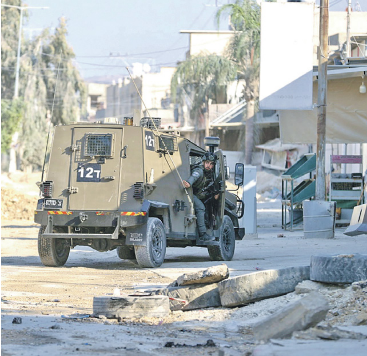
أرة للاحتلال خلال اقتحام طولكرم أمس

واصلت قوات الاحتلال إشعال الضفة الغربية المحتلة، حيث سقط أربعة شهداء بينهم أطفال في قصف شنته طائرات الاحتلال على وسط مخيم نور شمس بمدينة طولكرم، شمالي الضفة الغربية، وسط عملية تدمير منهجية للبنية التحتية في المخيم وانسحب قوات الاحتلال الإسرائيلي مساء أمس الخميس، من مدينة طولكرم شمال الضفة الغربية وخيمها نور شمس، بعد عملية اقتحام واسعة استمرت نحو 17 ساعة متواصلة وخلال الاقتحام، شوهت المدينة والمخيمان اشتباكات عنيفة بين مقاومين وتلك القوات، مما أسفر عن استشهاده أربعة فلسطينيين احدثهم تم اغتياله من قبل قوات خاصة واسعة واتُخذت نصف جوي والرابع بالرصاص وكان شهود عيان قالوا إن جرافات الاحتلال اقتحمت مخيم طولكرم من الجهة الشمالية وقامت بتجريف البنية