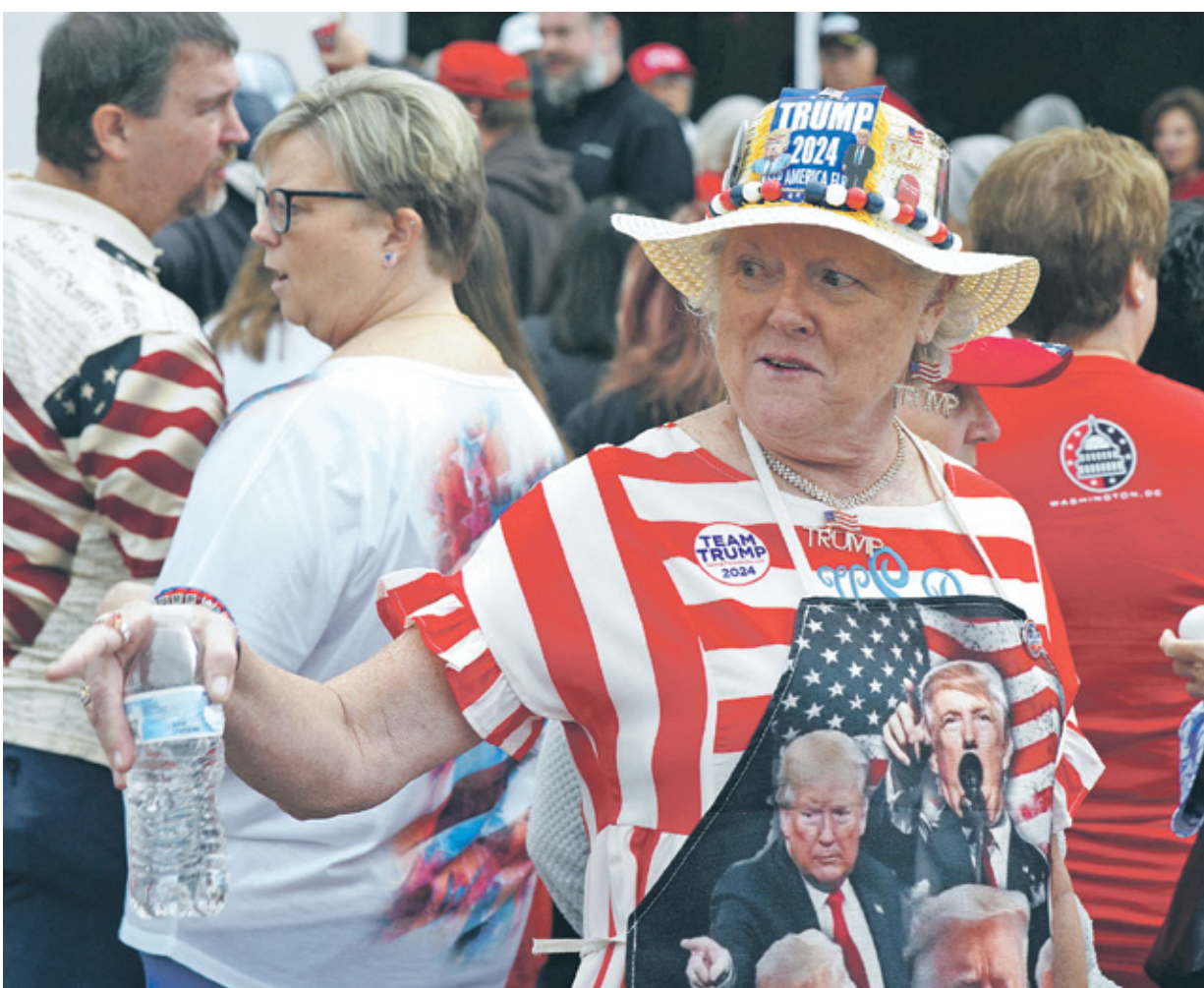
من تجمع لانصار ترامب في كارولينا الشمالية أول من أمس

صفحة» ترامب، وقادت الحشد في الهتافات «لن نعود إلى الورا». وكانت نائبة الرئيس قالت، في خطاب أمام البيت الأبيض الثلاثاء الماضي: «هذا ليس مرشحاً للرئاسة يفكر كيف سيجعل حياتكم أفضل. هذا شخص