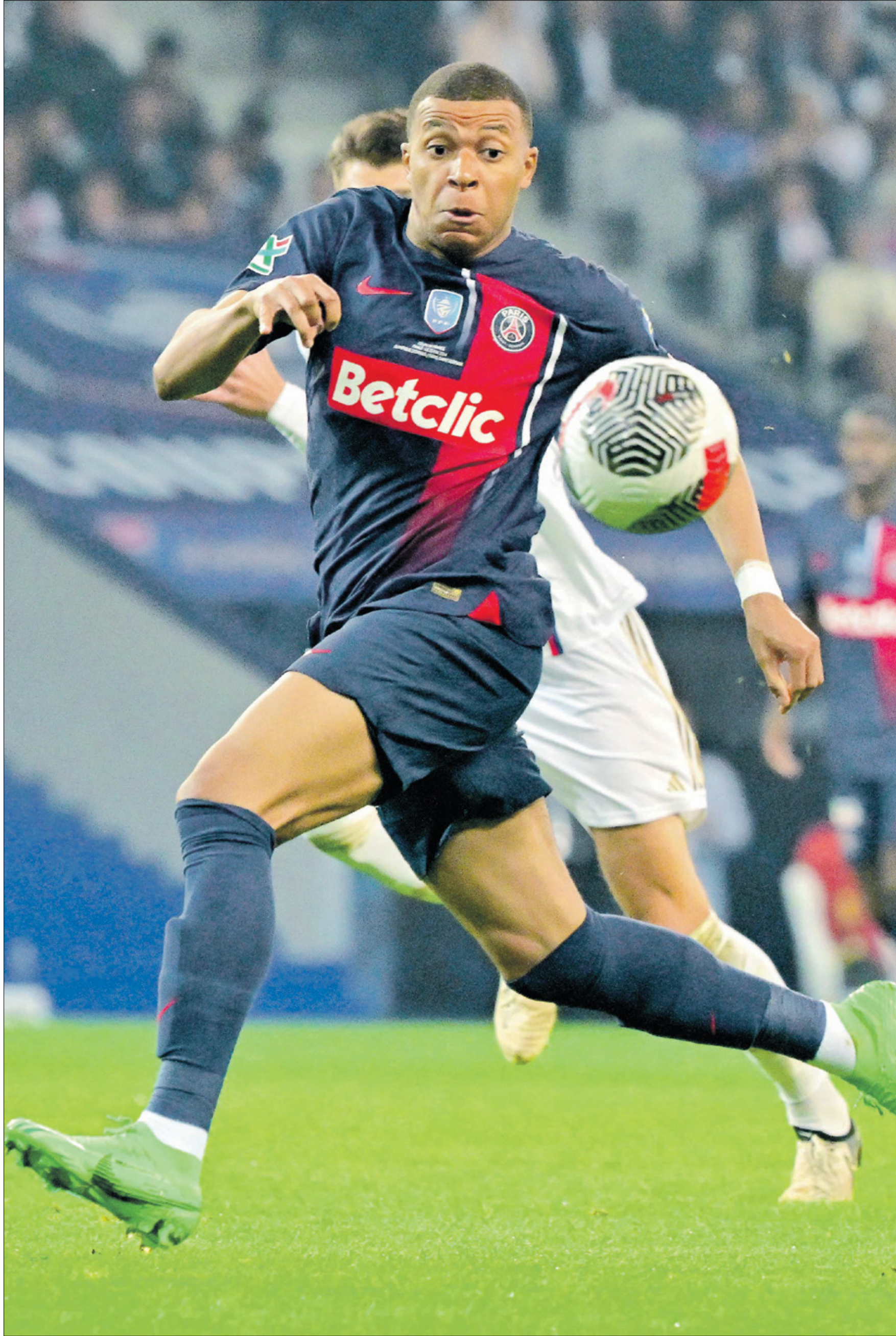
أعلن مبابي رحيله عن باريس سان جيرمان قبل نهاية موسم 2023-2024

سُيعلن ريال مدريد رسمياً يوم الاثنين المقبل عن ضم المهاجم الفرنسي كيليان مبابي، وفقاً لما ذكرته صحيفة ليكيب الرياضية. وسيكون مبابي حراً في 30 يونيو/حزيران عندما ينتهي عقده مع نادي باريس سان جيرمان، وعلى الرغم من أنه أكد بالفعل علناً رحيله عن العاصمة الفرنسية، فإن مصير النجم البالغ من العمر 25 سنة لا يزال مجهولاً، لكن كل المؤشرات تؤكد انتقاله إلى النادي الملكي.