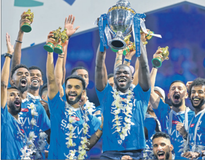
الهلال يحصد لقب الكاس للمرة الـ 11

النصر، أمام الهلال، في نهائي كأس ملك السعودية. ولم يتماك «الدون» أعصابه، واجهش في البكاء، بعد خسارة فرصة نيل اللقب، بفارق ركلات الترجيح، وكان رونالدو الضرب غير المتوقع، على أرضية استاد مدينة الملك عبد الله الرياضية، فاللاعب الذي كان شاهداً على مسيرة حافلة، شهدت تنويعه بخمسة ألقاب في أبطال أوروبا، ولقب واحد في بطولة أمم أوروبا، ولقب البطولة الافتتاحية لدوري الامم الأوروبية، وغيرها من البطولات المحلية، إضافة إلى نيل الكرة الذهبية (خمس مرات)، أعوام: 2008، 2013، 2014، 2016، 2017، أثبت شغفه وحرصه على الفوز في كل لقاء، والتتويج بأي بطولة، مهما كانت أهميتها، في الوقت الذي كان فيه يعنى النفس في عدم الخروج بموسم صيفي» مع النصر محلياً، الذي نال لقب البطولة العربية للاتدي الصيف الماضي، وسلا نجم ريال مدريد السابق مواقع التواصل الاجتماعي بلفطات بكائه التي تتخللها مستخدموها، بعد انتهاء القمّة الريفقة، وتلقي خسارة جديدة أمام فريق الهلال، وتسلم نجم نادي النصر، البرتغالي كريستيانو رونالدو، قبل نهائي كأس ملك السعودية، جائزة هدف الدوري السعودي لكرة القدم موسم 2023 - 2024، بعد أن سجل 35 هدفاً مع النصر في الدوري هذا الموسم، محطماً الرقم القياسي للمغربي عبد الرزاق حمد الله.