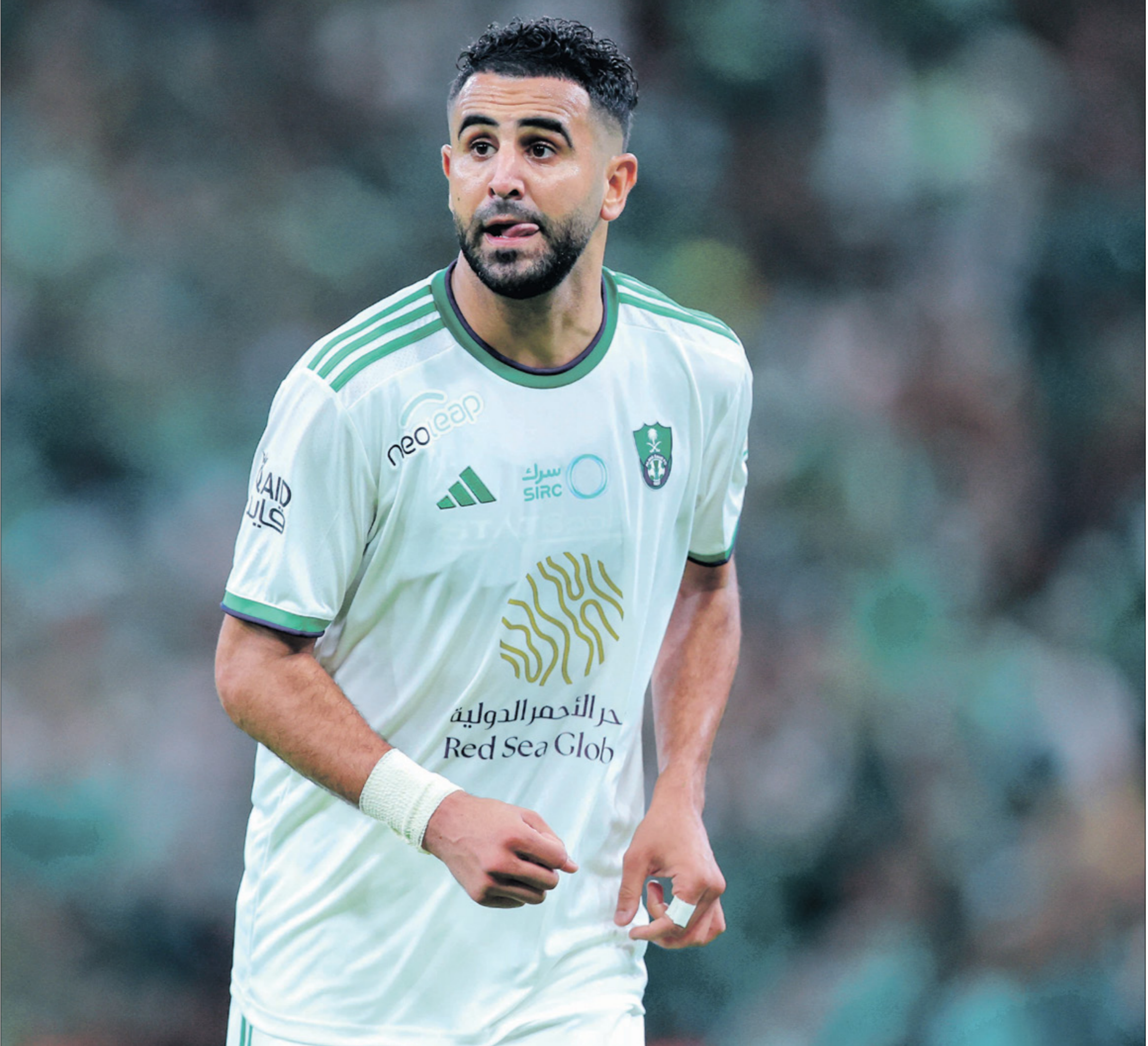
رياض محرز قائد المنتخب الجزائري أبرز الغائبين

المؤقت، منتصر الحويشي، على المنوال نفسه في إنهاء مسيرة العديد من النجوم الكبار دولياً، خلال الفترة المقبلة، في ظل الاستبعاد المتكرر لنجوم لاعبين، منذ امم أفريقيا الماضية، والتي أقيمت مطلع هذا العام بساحل العاج، وشهدت قائمة منتخب تونس، التي تستعد لملاقاة غينيا الاستوائية وتامبيجا، استعداد المهاجم المتألق في النوري القطري، وقائد منتخب تونس، لعدة سنوات، يوسف المسكياتي (34 عاماً)، والذي تعرض لانتقادات في بطولة امم أفريقيا الأخيرة، بسبب صياغة التهديفي، وترآج