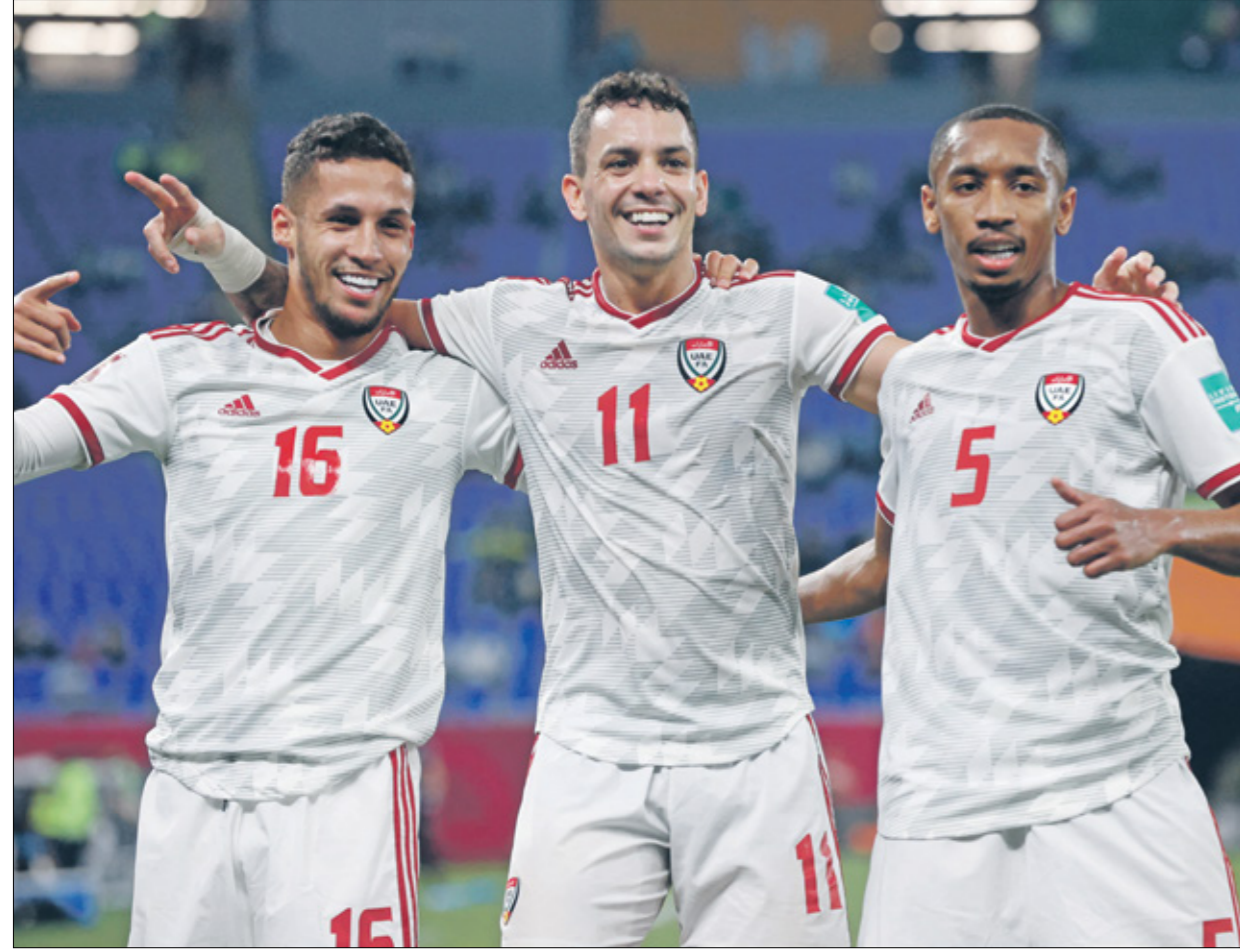
المنتخب الإماراتي أسقط السوري