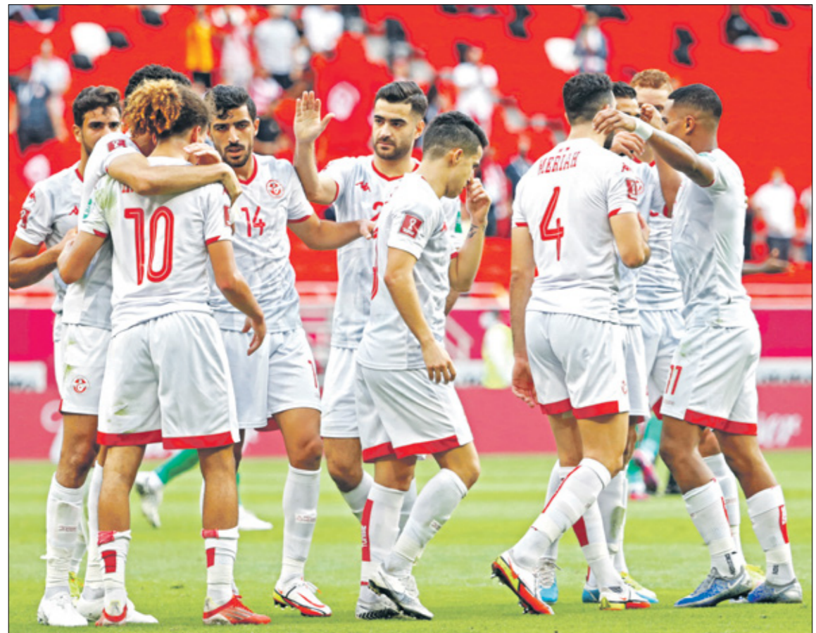
بلعربي حُطّأ زملائه في المنتخب التونسي

بلعربي فقد والده قبل يوم واحد فقط من السفر إلى العاصمة القطرية الدوحة ليشارك كثيرا بوفاته ويتذكره بعد هزة الشباك وتسجيل انطلاقة قوية مع منتخب بلاده. والتقطت الكاميرات بلعربي وهو يبكي بعد تسجيل الهدف الثاني لمنتخب تونس في المباراة، في وقت ركض زملاؤه نحوه للاحتفال معه، إلا أنه لم يحتفل أبدا.