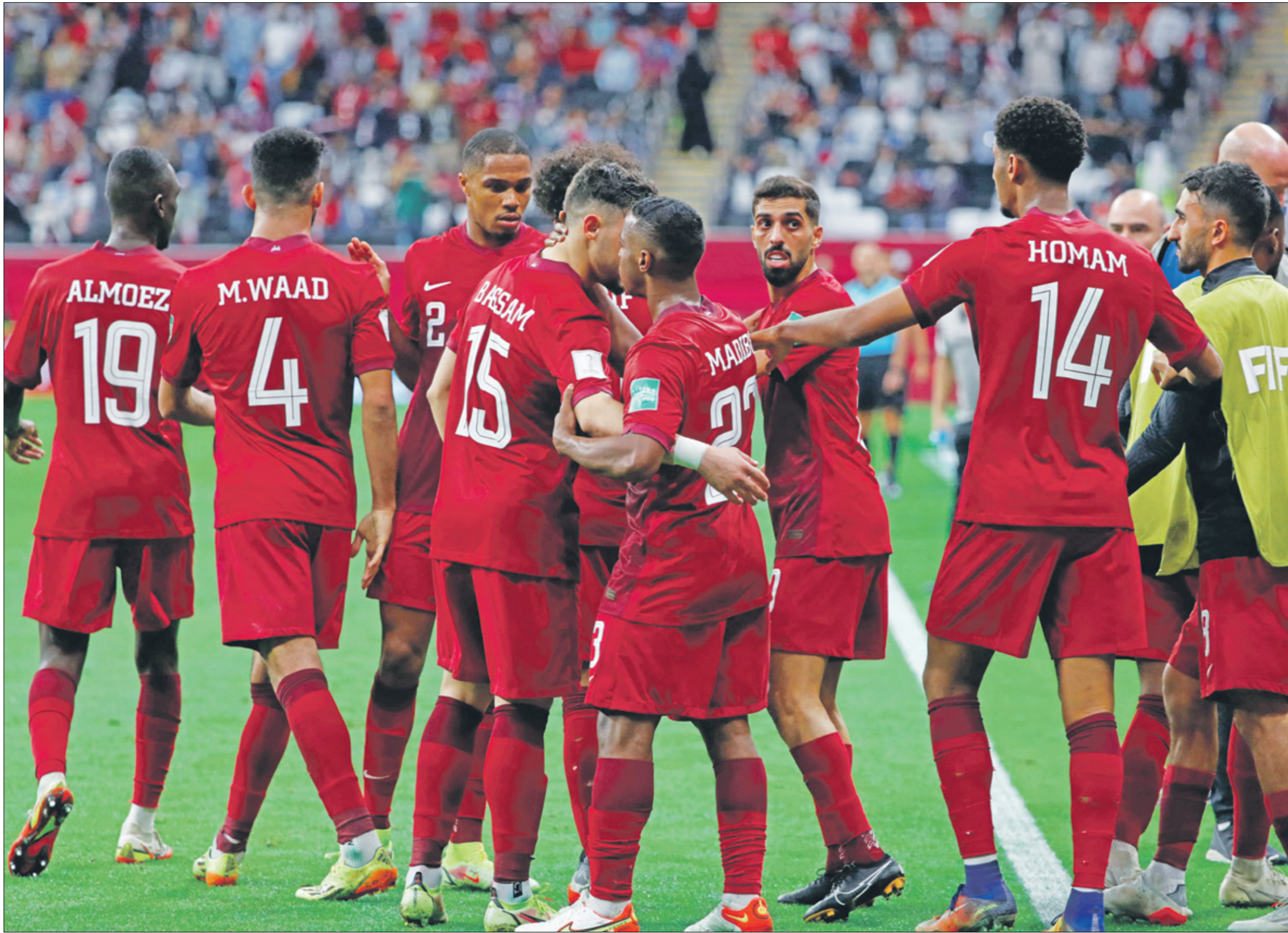
انتصار مهم للمنتخب قطر في بداية المشوار

لم تكن مواجهة المنتخب البحريني سهلة على صاحب الأرض والجماهير القطري، إذ أن الأول قدم كرة قوية وأجرح «العباني» على أرض الملعب وكان منافسا شرسا على النقاط الثلاث، لكن قطر وبخبرة مدربين ولاعبينها، نجحت في حسم المواجهة لهصلحتها بانتصار صعب بهدفين، ولا يعكس تسجيل هدف