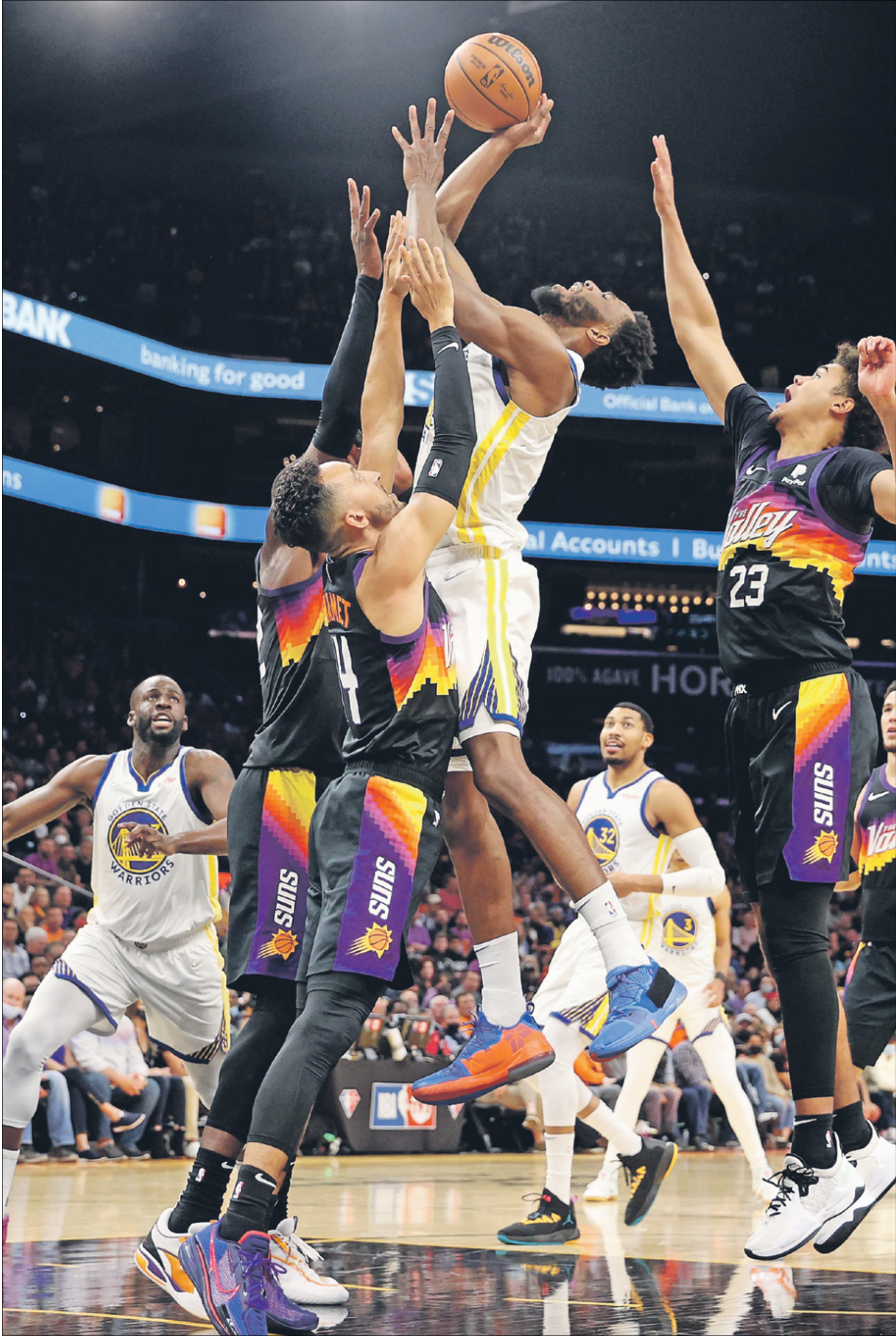
17 فوزاً متتالياً لفريق فينيكس صانز هذا الموسم

سقط فريق غولدن ستايت ووريورز أمام منافسه فينيكس صانز، في منافسات دوري كرة السلة الأميركي (104-96)، ليتساوى الفريقان في الصدارة برصيد 18 فوزاً و3 خسارات. وبهذه النتيجة، وصل فريق صانز إلى انتصاره الـ17 تواليًا وأكد سعيه للمنافسة على اللقب هذا الموسم، بينما توقفت سلسلة انتصارات فريق ووريورز عند 7، متعرضاً للخسارة الثالثة.