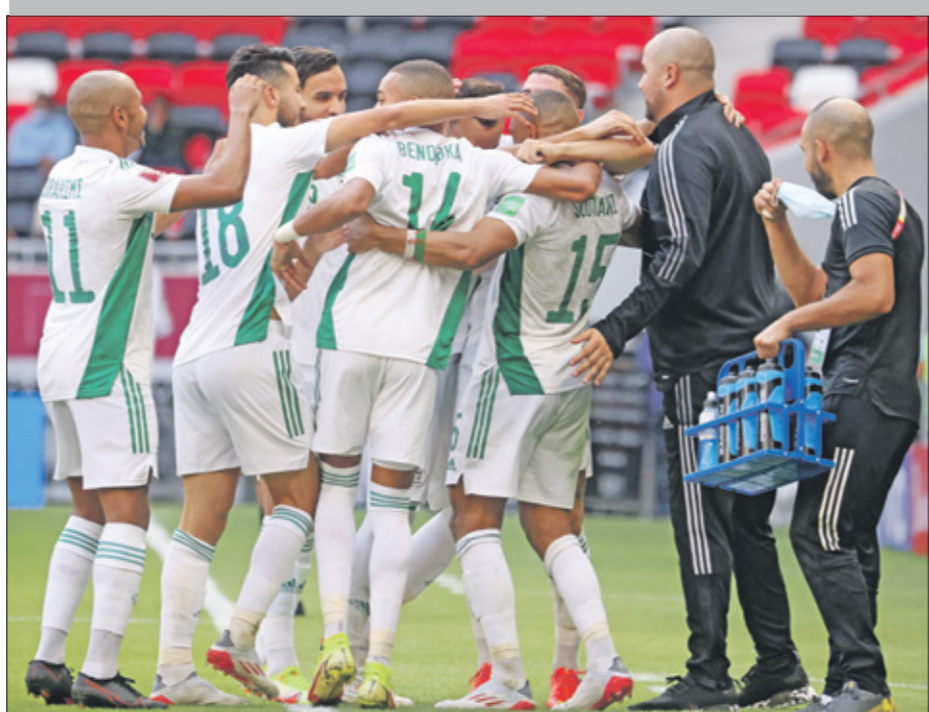
منتخب الجزائر فُهم مباراة قوية هجوميا

قدم المنتخب الإماراتي والسوري مباراة على الأقل تُساعد كثيرا في التأهل إلى الدور الثاني. تُذكر أن الجولة الثانية ستشهد مواجهة قوية وبمفاتيح هجومية، في ختام اليوم الأول من منافسات بطولة كأس العرب 2021. ومن سجل أهدافا أكثر في المباراة خطف النقاط الكاملة المهمة التي تُساعد على تسهيل عملية التأهل إلى الدور الثاني، نظرا لمستوى