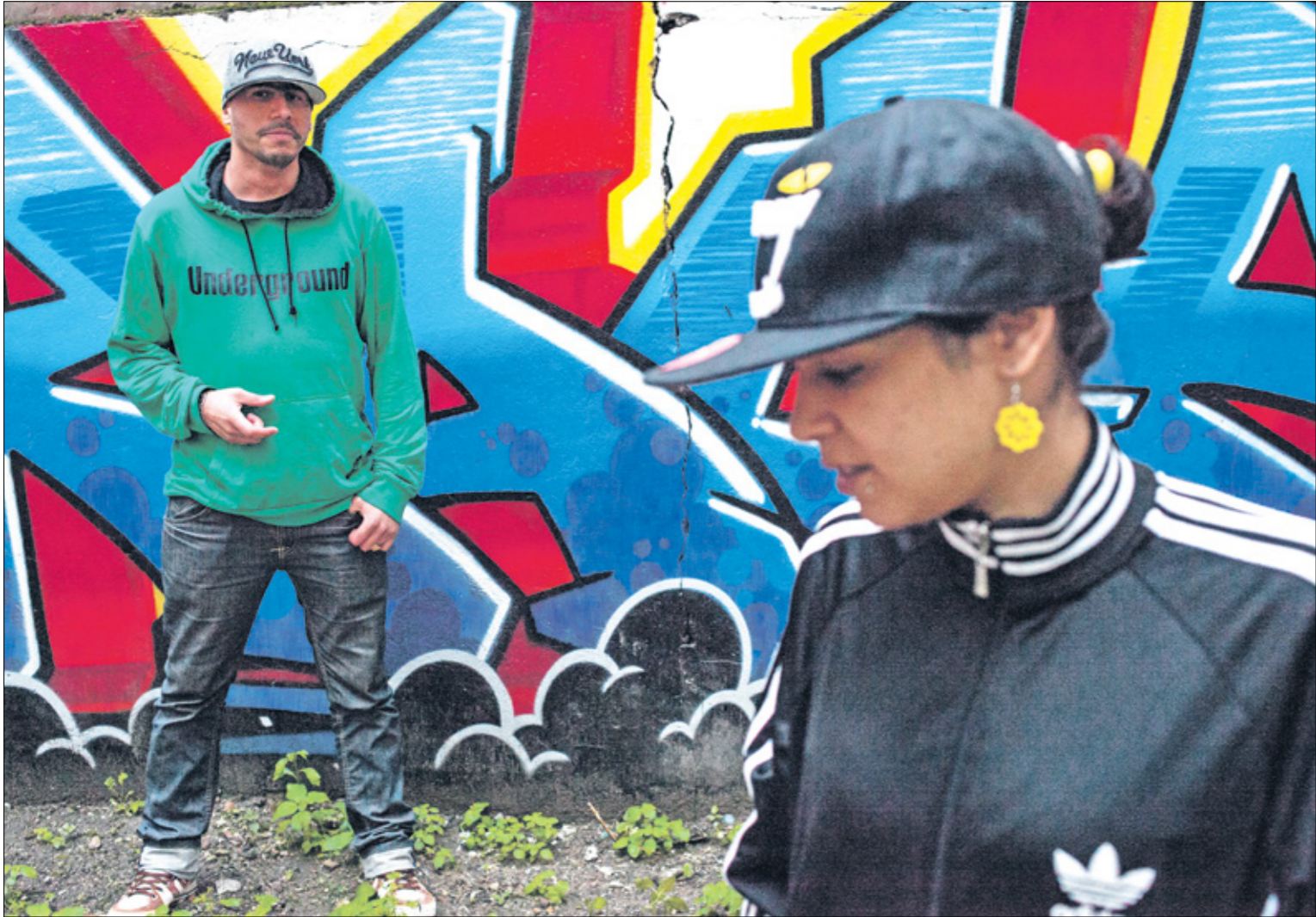
لطوت هوب لتصبح موسيقى الهيب هوب عماد العروض الفنية في تونس بعد عام 2011

■ هل مؤيد فكرة المنصات الإلكترونية وهل من الممكن أن تحفظ الأضواء من القنوات الفضائية؟ أنا مؤيد بالطبع لفكرة وجود المنصات لأنها توابك التطور التكنولوجي الذي نعيش فيه، وسيطر على العالم كله، ووجود أعمال من عشر حلقات أو 15 أو أقل، تجربة أراها جيدة جداً، لكن لا أرى أبداً أن المنصات من الممكن أن تحفظ الأضواء من القنوات الفضائية.