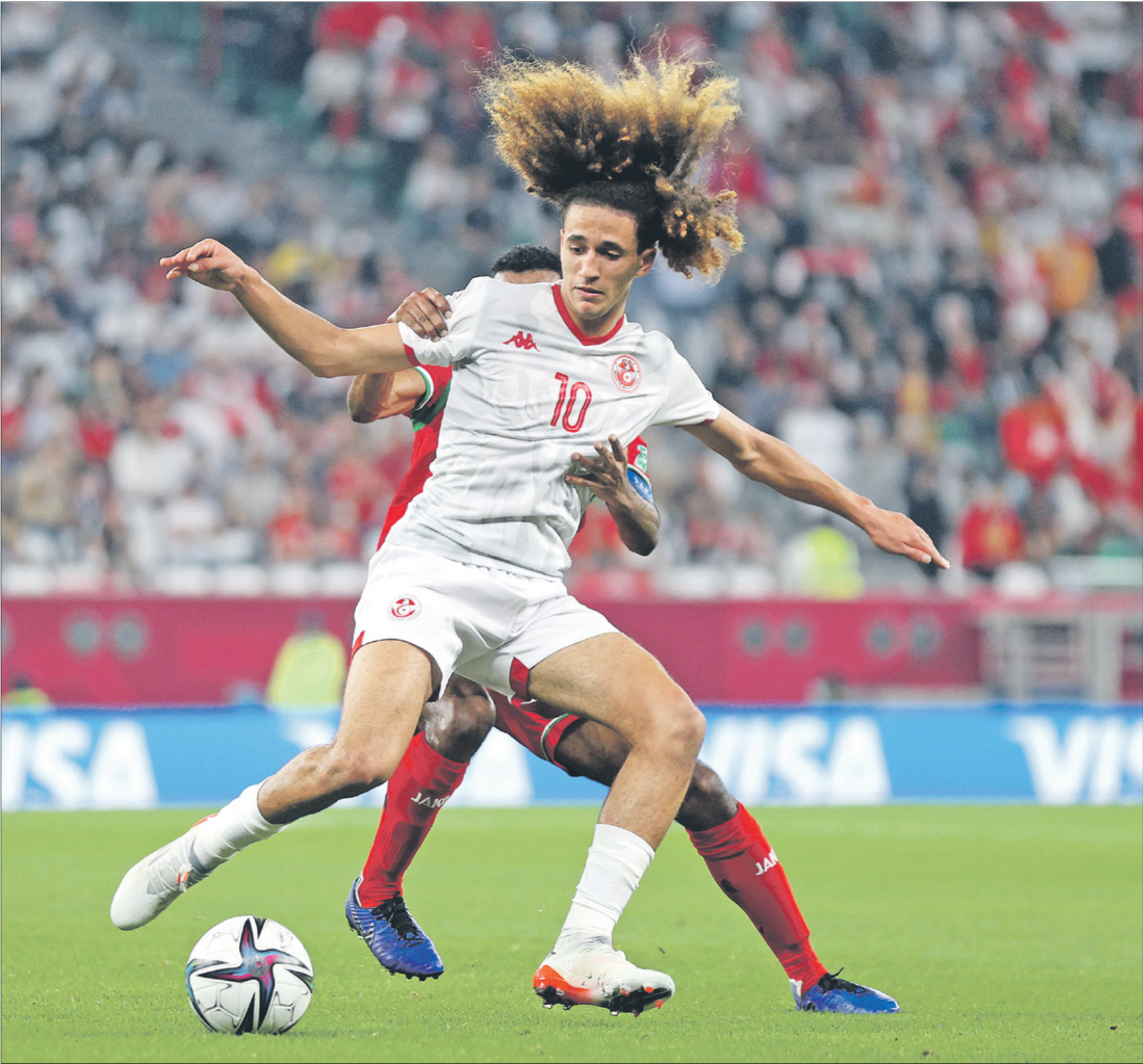
حنبعل المحبري من النجوم المنتظرة في كأس أمم أفريقيا 2022 (تحتجب فيون سيتي)

ويعدّمد المنتخب المصري أيضاً على ثنائي واعد من نجوم المنتخب الأولمبي السابق،