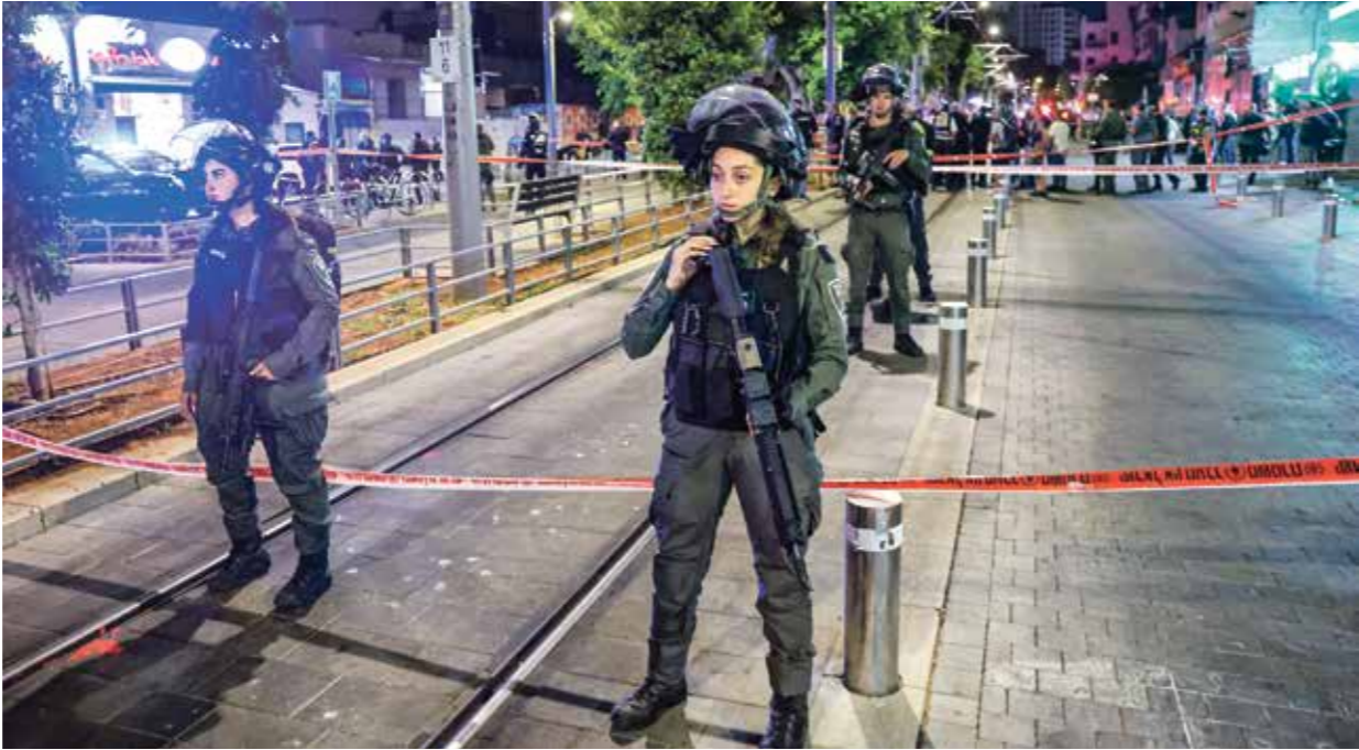
شرطة الاحتلال لحد الشارها في موقع العملية اول مع امن

وفاجأ منفذا عملية بافا الأجهزة الأمنية الإسرائيلية، لا سيما في كيفية وصولهما من مدينة الخليل، جنوب الضفة الغربية، إلى يافا في الداخل الإسرائيلي. وقال في عام 1948، وسط ظروف أمنية مشددة على المهاجر والهاجر والطرق المؤدية إلى ما وراء الجدار الفاصل، خصوصاً أنهما لا يتبعان إلى منظمات أو توجهات فصائلية معينة. ووقعت العملية في شارع القدس المحلل، لكن دون امتلاكه تصريح عمل