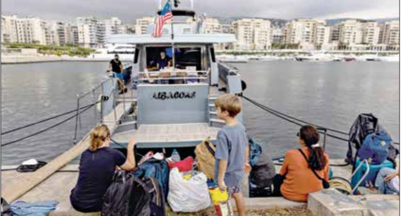
يستعدون لمغادرة لبنان بحرا، 30 سبتمبر

فرنسا، فلم تصدر أمرا بالإجلاء، رغم وجود الخطط منذ عدة أشهر، وتركز خطط الطوارئ الحالية على قبرص وخطار بيروت، وتناقش أيضا عمليات إجلاء عبر تركيا. وفي الأسبوع الماضي، قالت بريطانيا والولايات المتحدة إنهما ستواصلان دعم الجيش الإسرائيلي المتحرف، مع العلم أن وزير الشؤون الخارجية خوسيه مانويل إسبروخع يومئذ، قال في وقت سابق من هذا الأسبوع إن عدد الإسرائيليين في لبنان يقدر بحوالي ألف وثمانمئة، فيما أشارت لبقدر أن استرداد تعزيز إرسال طائرة عسكرية من لبنان، قد يكون في رجليته، غدا الجمعة وبعد غد السبت، قال مكتب الرئيس الكوري الجنوبي، يون سوك يول، 200 مواطن صيني مسلم من لبنان، أما