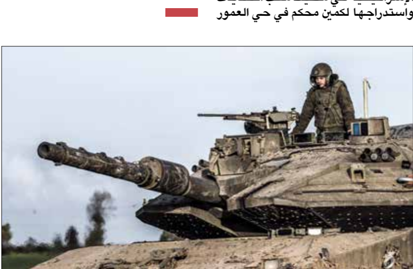
دبابة إسرائيلية خلال هجوم مخ خانينوس 7 مارس، 2024

منذ نهاية المرحلة الثانية للحرب الإسرائيلية على قطاع غزة، في أعقاب اجتياح مدينة رفح، مطلع شهر مايو/ أيار الماضي، نجح الاحتلال تكثيف المصاورة والمباغثة القائم على تنفيذ عمليات خاطفة لقواته البرية في عدة أماكن منها مجمع الشفاء الطبي ومخيم جباليا لاجئين الفلسطينيين والمناطق الوسطى وخانينوس والأحياء الجنوبية الزيتون. وتكررت العمليات في تلك المناطق في عملية عسكرية محدودة المناطق في منطقة الفخاري شرقي خانينوس، جنوبي القطاع، بشكل يشبه عمليات العسكرة التي نفذها في شمالي قطاع غزة ومنطقة غزة مرات سواء بهدف توسيع محور انتشارهم وسط القطاع أو قصف عمليات المقاومة في الميدان ومحاولات وقف عمليات إطلاق الصواريخ من قبل الأذرع العسكرية، علاوة عن مزاعم الجيش الإسرائيلي بوجود بنية تحتية للمقاومة في تلك المناطق التي انسحب منها. ويرتكز الاحتلال في العمليات على تحقيق أهداف عدة سواء البحث عن