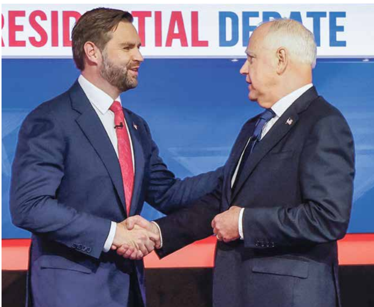
والز وفانس خلال المناظرة أول من أمس

فانس بشأن إمكانية توجيه جيش الاحتلال ضربة استباقية قوية لإيران: «الأمر متروك لإسرائيل في ما تعتقد أنها بحاجة إلى القيام به للحفاظ على أمن بلادها، ويجب علينا دعم حلفائنا أينما كانوا عندما يقاثلون