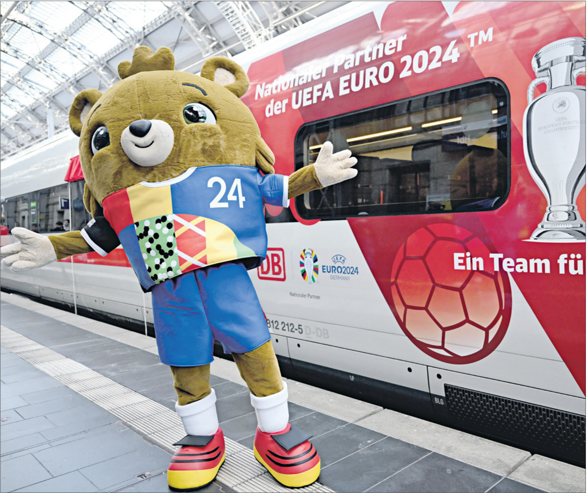
توالر مباريات كرة القدم بشكل كبير على البيئة

انضم ثلاثي ريال مدريد الإسباني، فينيسيوس جونيور ورودريغو وإيدر ميليتار، إلى معسكر منتخب البرازيل في مدينة أورلاندو الأميركية استعداداً لبطولة كوبا أميركا التي تستضيفها الولايات المتحدة هذا الشهر. وكان الثلاثي هو الأخير في الانضمام لمعسكر «السيليساو» بعد حصولهم على بضعة أيام راحة عقب مشاركتهم في تنوع فريقهم في دوري الأبطال السبت الماضي، في نهائي ويمبلي على حساب بوروسيا دورتموند الألماني. وبدأ المنتخب البرازيلي تحت قيادة المدرب الوطني دوفغال جونيور، معسكره للبطولة الأهم في القارة اللاتينية منذ الخميس الماضي، قبل خوض مباراتين وديتين أمام المكسيك والمنتخب الأميركي، قبل الانطلاق الرسمي لشوارو في البطولة رسمياً في 24 من هذا الشهر أمام منتخب كوستاريكا. ومن المقرر أن يسافر بعثة «الكانري» كاملة الخميس إلى ولاية تكساس لخوض مباراة المكسيك يوم السبت القادم، ثم بعدها بأربعة أيام، تلتقي المنتخب الأميركي في أورلاندو، وهي البروفة الأخيرة قبل بداية البطولة. ويلعب صاحب الألقاب التسعة في كوبا أميركا ضمن المجموعة الاربعة مع كولومبيا وباراغواي وكوستاريكا. ويسبّض منتخب «رائض السامبا»، شريط مبارياتهم في كوبا أميركا في 24 يونيو/ حزيران الحالي أمام كوستاريكا، ثم بعدها بأربعة أيام يلتقي باراغواي، فيما سيكون ختام مشوار دور المجموعات أمام كولومبيا في الثاني من شهر يوليو/ تموز المقبل. وكانت المرة الأخيرة التي وقعت فيها البرازيل على منصات التتويج في النسخة التي استضافتها في 2019، بينما فقدت لقب النسخة الأخيرة وسط تضامرها أيضاً أمام الغريم التقليدي الأرجنتيني. بهدف النجم أنجيل دي ماريا.