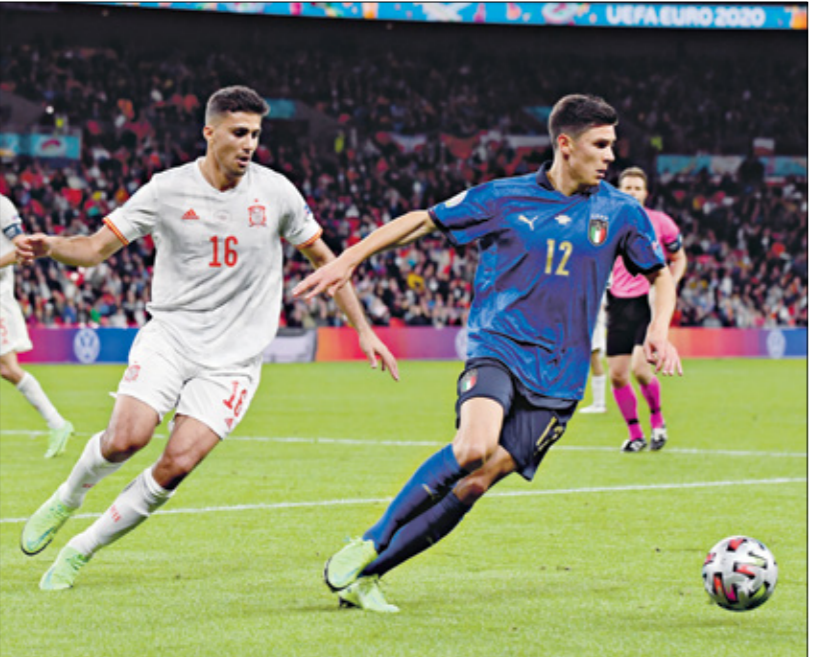
ستاجدد المواجهة بين إيطاليا وإسبانيا في يورو 2024

وتأكيداً على التطور الكبير لسنوى المنتخب الكرواتي في السنوات الأخيرة، تحرّج إلى الواجهة تتأخّج في البطولات القارية والعالمية، إذ حل وصيفاً في مونديال روسيا 2018، وحل ثالثاً في مونديال قطر 2022، في وقت خرج من الدور الـ16 في آخر نسختين من بطولة اليورو (2016 و2020). وأخيراً سيكون منتخب ألبانيا بمثابة السكّة الصغيرة في بحر طيّء بالقروض الكبيرة، ومهمّته صعبة جداً للتأهل إلى الدور الثاني، إذ عليه الفوز على منتخب كبير على الأقل، وخلف نقطة من منتخب كبير آخر، من أجل رفع حظوظ التأهل، وهذه مهمة صعبة جداً عند مواجهة منتخبات عملاقة مثل إيطاليا وإسبانيا، بشكل خاص، وكرواتيا بدرجة أقل، ولكن في كرة القدم لا شيء مستحيل، وهو ما سيعمل عليه منتخب ألبانيا، من أجل صناعة مفاجأة كبيرة في جموعة الموت، وتكرار إنجازات منتخبات صغيرة صعفت الكبار في نسخٍ سابقة من البطولة الأوروبية.