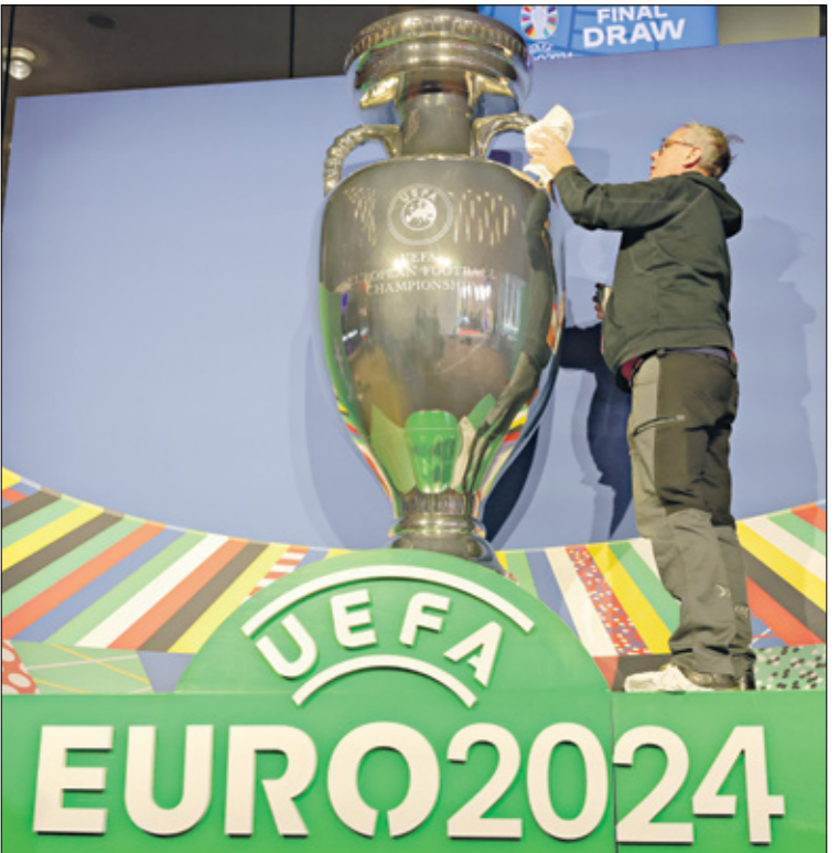
تحديات كبيرة لنظر منظمي بطولة يورو 2024

وتعمل الاتحاد الأوروبي لكرة القدم (يويفا) على كبح التأثير المناخي لبطولة أمم أوروبا 2024 من خلال تمويل رحلات