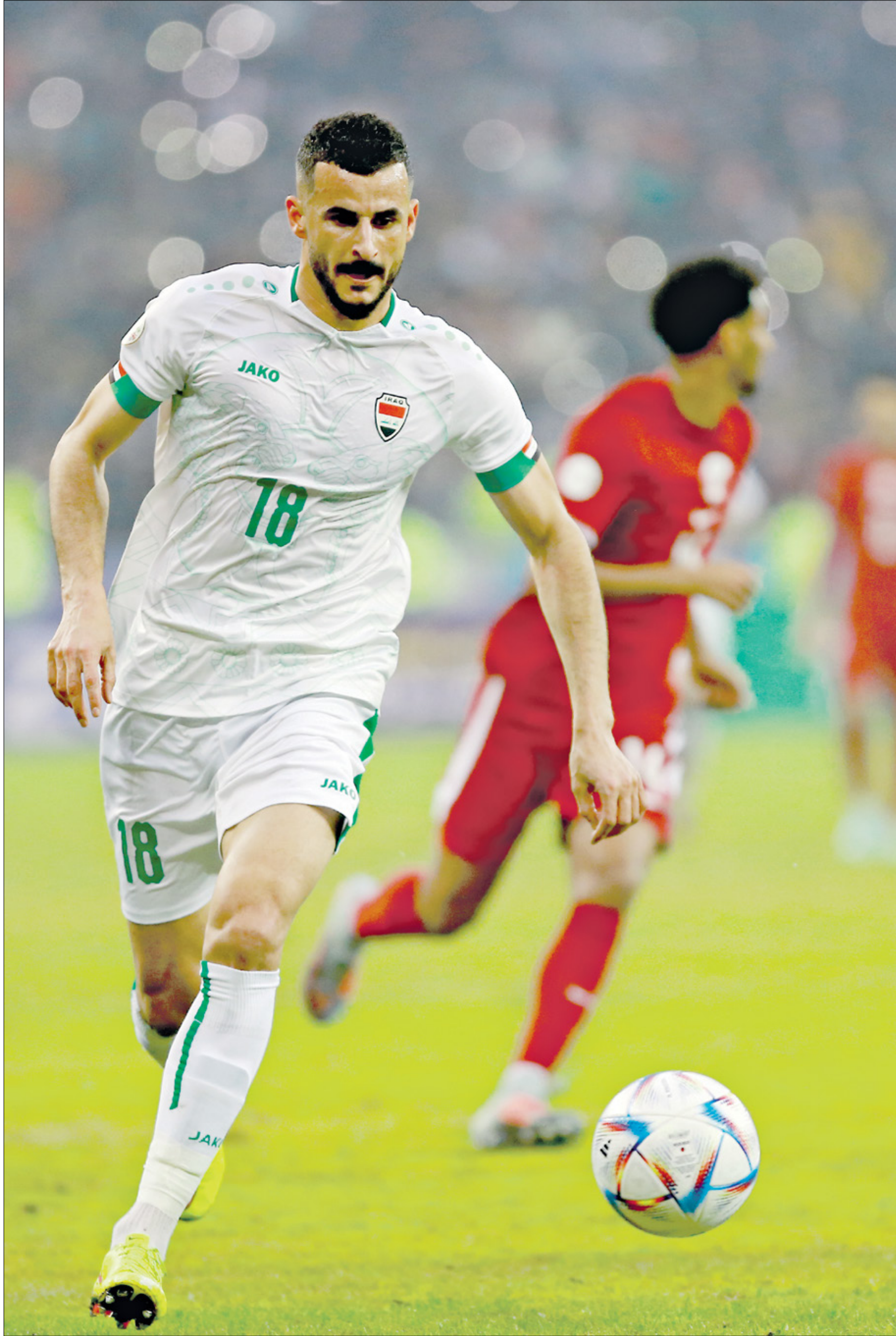
يُعتبر أيمن حسين من أفضل نجوم منتخب العراق

كشفت الوكالة الوطنية العراقية للأنباء عن نقل لاعب منتخب العراق، أيمن حسين (28 سنة)، إلى المستشفى إثر تعرضه لنزيف في القلب، وذلك بعد المواجهة التي جمعت منتخب أسود الرافدين وعمان. ونشر الاتحاد العراقي لكرة القدم بياناً رسمياً عن حالة المهاجم جاء فيه أن حالة اللاعب أيمن حسين تحسّنت واستقرت «بعد تعرضه لإصابة قوية في بداية المباراة (أول من أمس)، حيث اتضح في ما بعد تعرضه إلى كدمة في الصدر أدت إلى نزيف داخلي تطلب تدخلاً جراحياً».