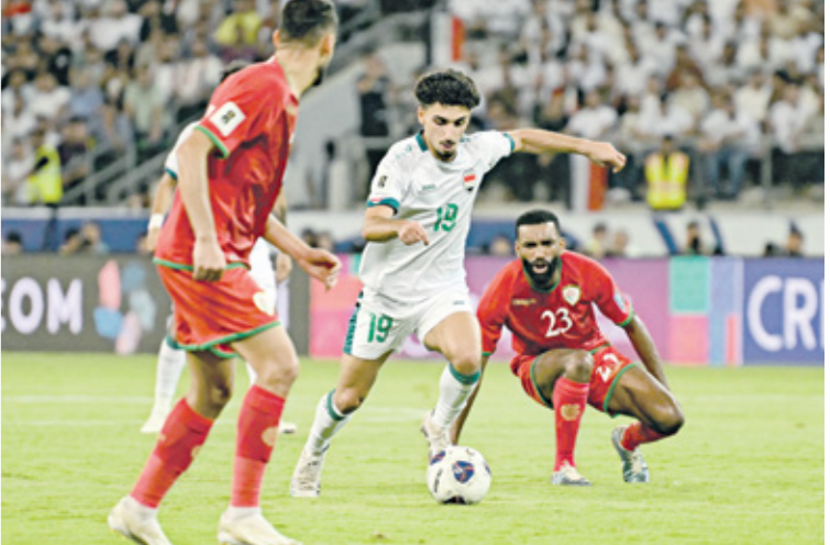
منتخب العراق واصل سلسلة نتائجه الإيجابية بتحسين مآلح