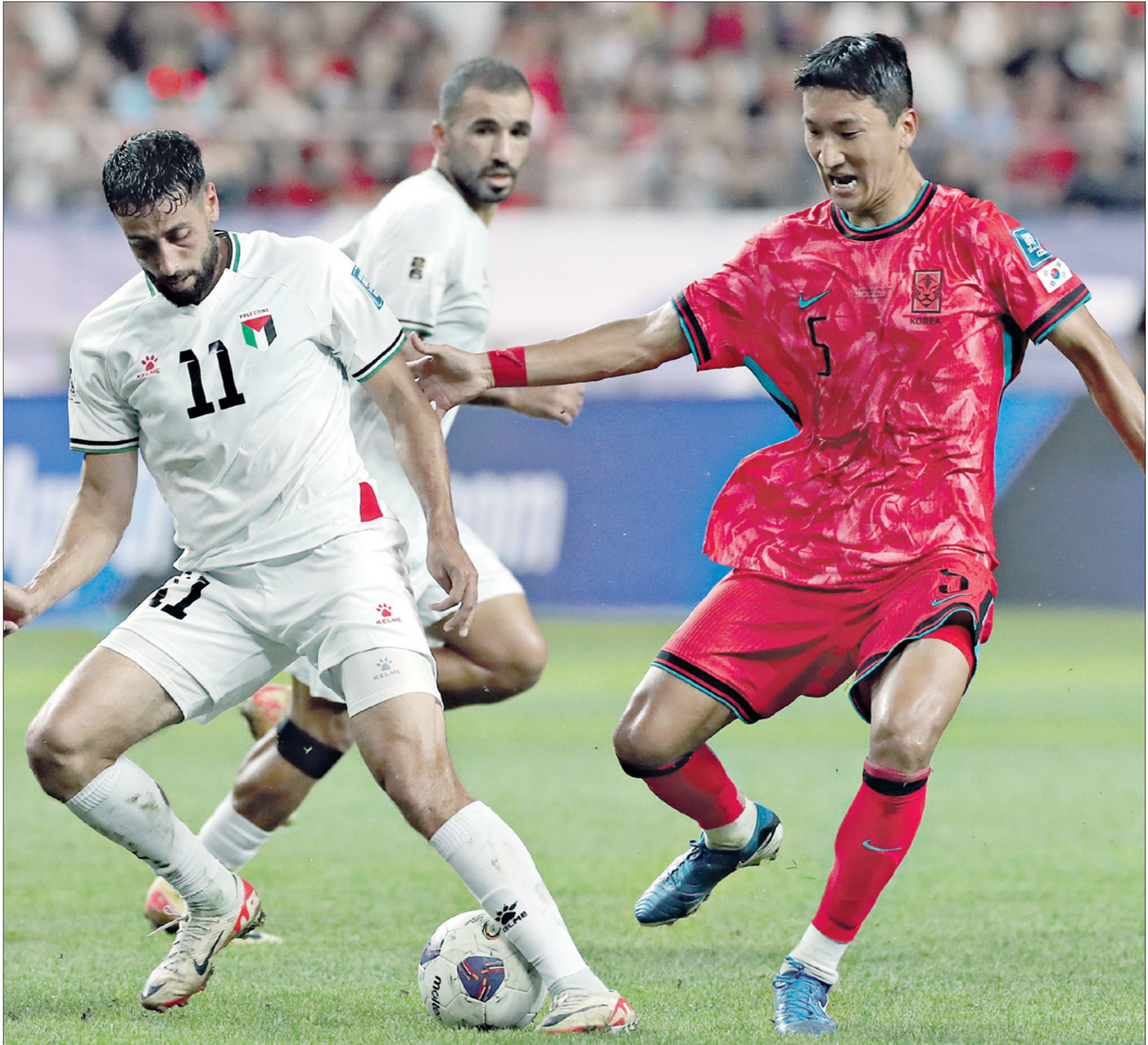
منتخب فلسطين حطف نتيجة مميزة ضد كوريا الجنوبية

العراقية من أجل الحضور الثاني في المونديال، بعد 40 سنة من المشاركة الأولى التي كانت في نسخة عام 1986 بالمكسيك، وودعها أسود الرافدين بثلاث هزائم وهدف يتيم أحرزه الأسطورة الراحل أحمد راضي. وفي مباراة ثانية، تعادل المنتخب السعودي مع نظيره الإندونيسي بهدف محله. وتقدم منتخب إندونيسيا عبر هدف ساندي أفضل لاعب في المباراة، إلى المستوى بعد عن طريق مصعب الجوير. وشهدت بقية مباريات المجموعة أيضاً فوز اليابان على الصين بنتيجة (7-صفر). وخسر المنتخب القطري أمام نظيره