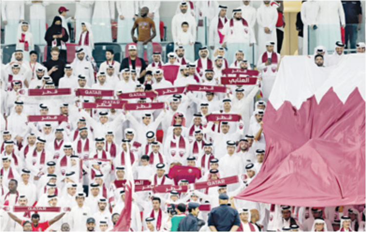
جماهير قطر تناظر الفعويض من ملعبها في اللقاء، القادم