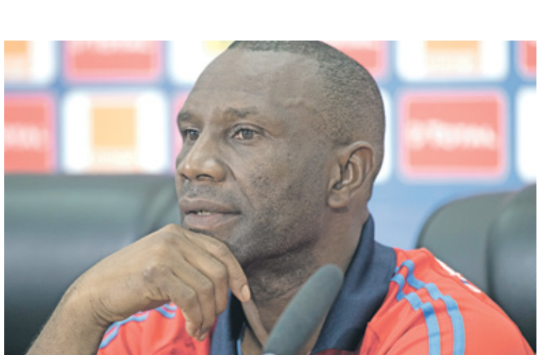
إينجي مدرب نهضة بركان يقول على خيرات العيب اجاستن تارسن فرانس برس

لكرة القدم لموسم 2021-2022، وسط إقبال كبير على مباريات النهائى لنهضة بركان المغربي وأهلي طرابلس الليبي، اللذين يمحمان أحلاماً كبيرة في تحطى عقبتى مازيمبي الكونغولي وأورلاندو بيراتس الجنوب أفريقي. ويحل نادي نهضة بركان المغربي بطل نسخة 2020، اليوم، ضيفاً على مازيمبي الكونغولي، المرشح الأول لحصد اللقب في مواجهة صعبة وثرسية،