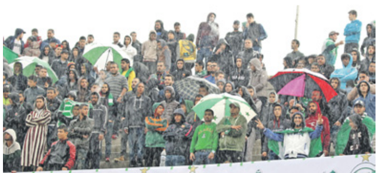
اهلي طرابلس الليبي في لقاء صعب امام اورلاندو بيراتس