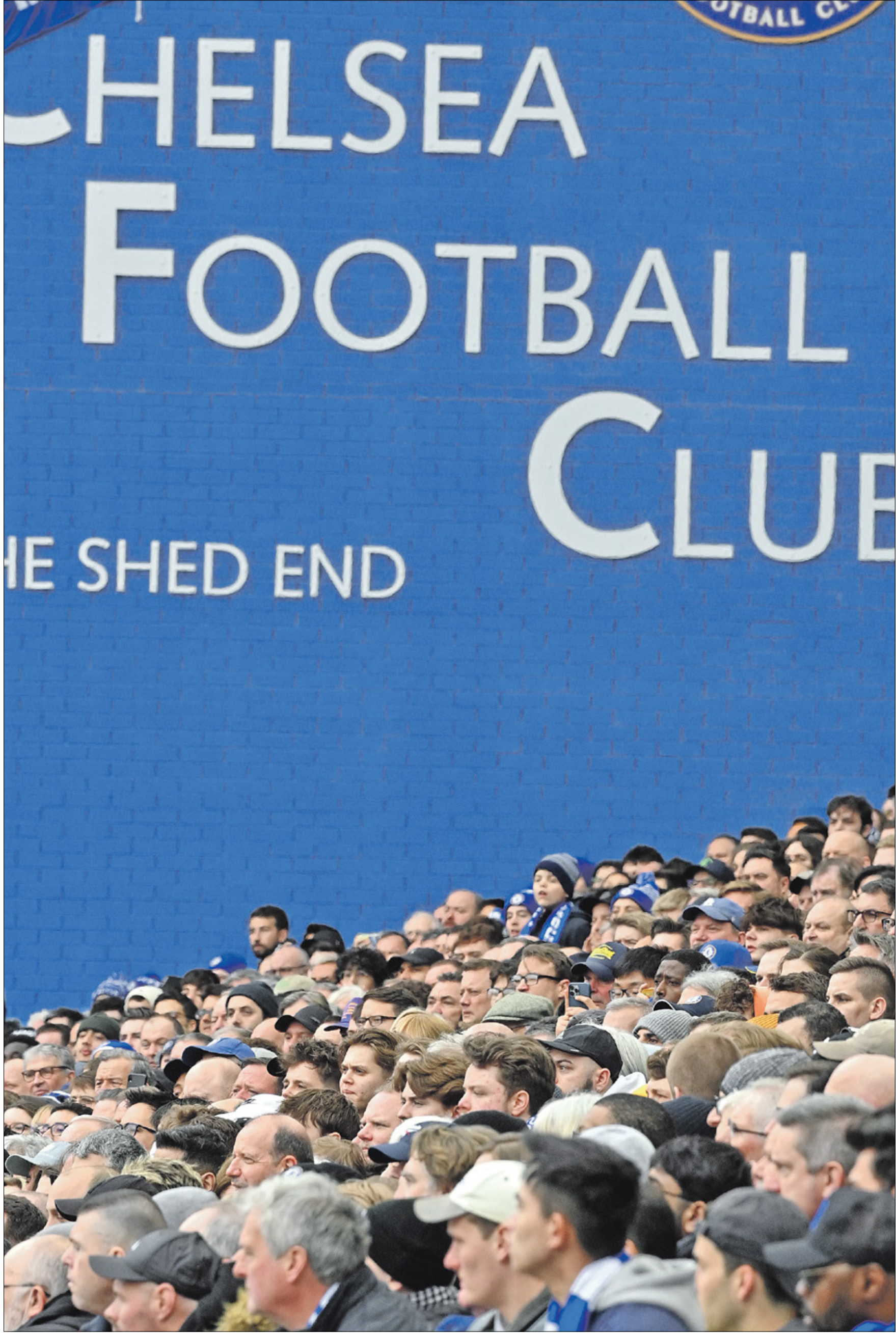
جمهير تشلسي تنتظر ضخ اموال كثيرة مع المستثمر الأميركي الجديد

اعلن فريق تشلسي الإنجليزي الانتهاء من كافة بنود انتقال ملكيته إلى العهد الجديد بقيادة رجل الأعمال الأميركي، تود بولي، للاستحواذ على ملكية النادي اللندني، وذلك في بيان نشره البلوزي على موقعه الإلكتروني، وتم الاتفاق على تخصيص 2,5 مليار جنيه إسترليني لشراء أسهم النادي، على أن يتم إيداع العائد في حساب مُجمد في أحد المصارف البريطانية، بنية التبرع بـ100% من المبلغ لقضايا خيرية.