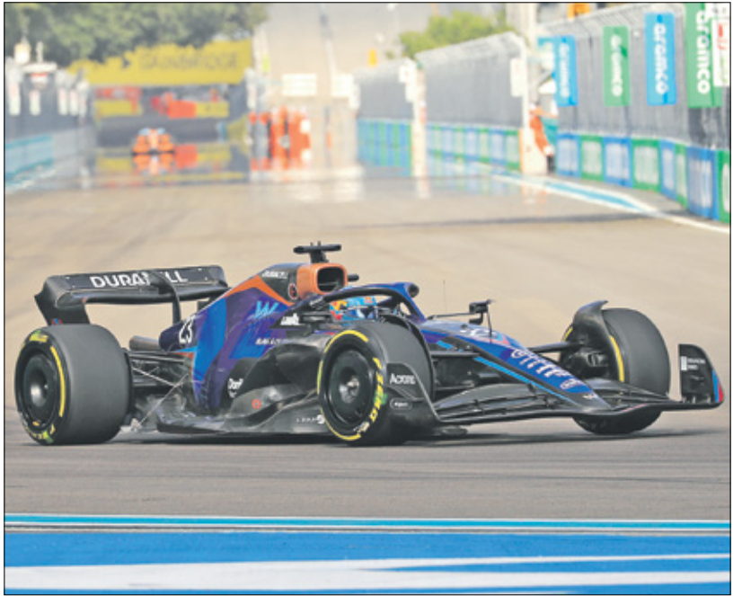
المنافسة على لقب فورمولا 1 هذا الموسم مشتعلة

التي تستضيف السباق، وسيجتمع كبار منسقي الموسيقى (دي جي) في ميامي لإحياء حفلات ليلية حول الحلبة بفوق سعر تذكرها ألف دولار، وتعكس أرباح سباق جائزة ميامي الكبرى مدى شغف