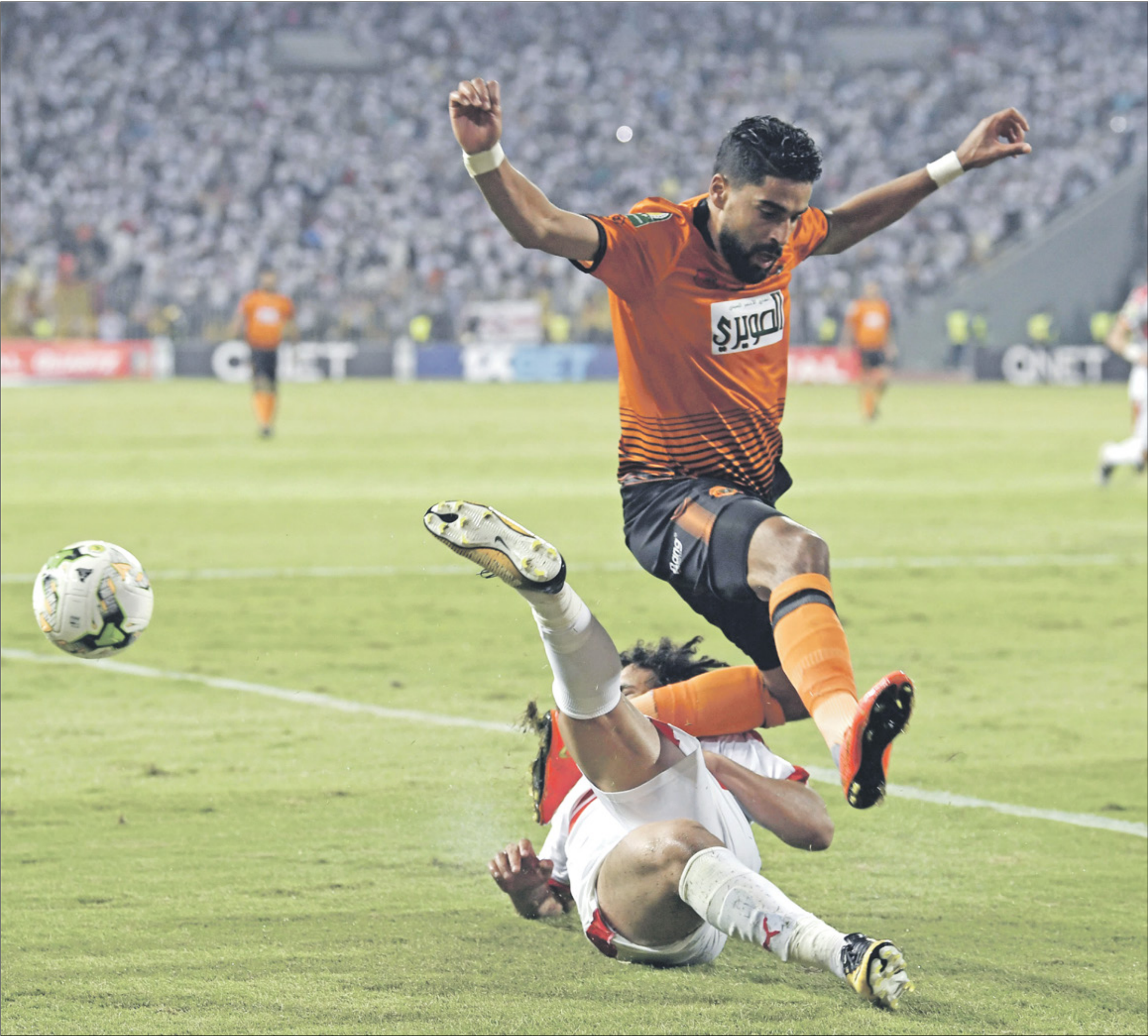
نهضة بركان المغرب يواجه مازيمبي الكونغولي

العام في أرض الملعب، وتحطى أي مواقف استفزازية، المباراة لن تكون سهلة وفي الوقت نفسه، ليست حاسمة في تحديد هوية المتاهل للمباراة النهائية، وعلينا الانتظار للشوط الثاني في المغرب، وستركز على كيفية استغلال الفرض التي تلوح لنا للتسجيل»، ووعدت إدارة نهضة بركان لاعبي الفريق بمكافآت مالية خاصة، إلى جانب ما تنص عليه اللائحة في حال تحطى عقبة المرشح الأول للتويج بالكونفيدرالية، والعودة إلى المباراة النهائية للمرة الثالثة في أقل من 3 سنوات، والسعي لحصد الكأس الغارية. وفي الجولة نفسها، يستضيف