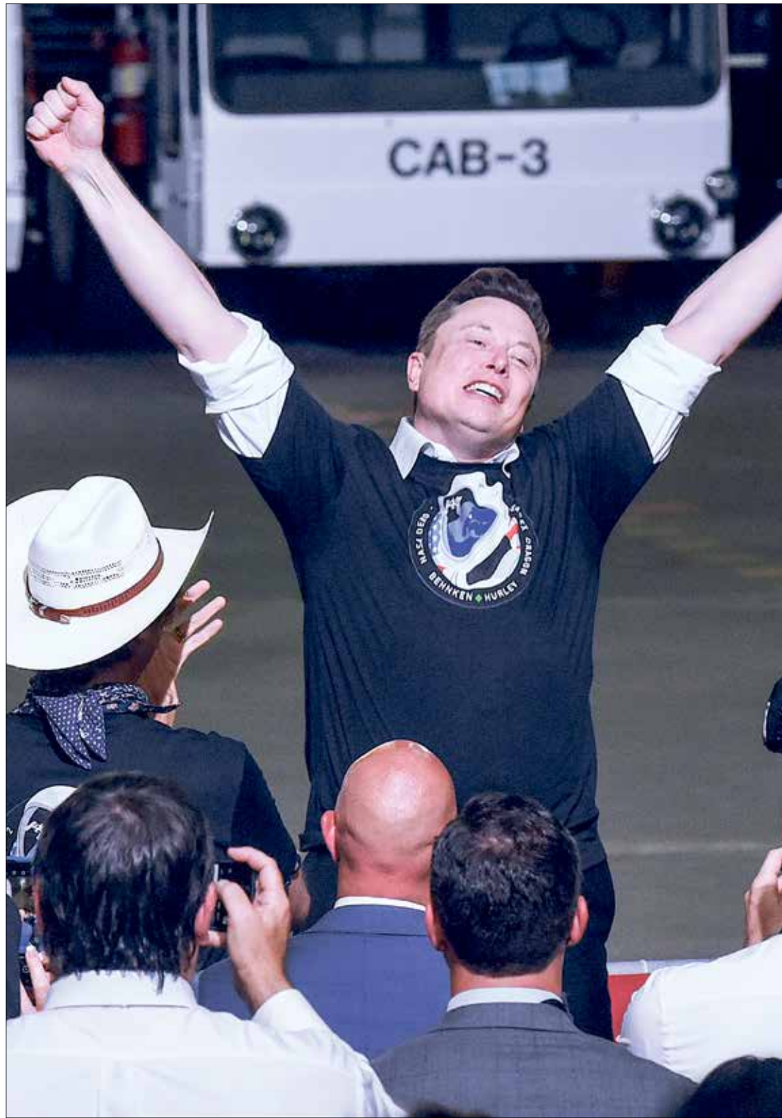
إيلون ماسك الرجل الأكثر ثراء في العالم، 30 مايو 2020

في يونيو/حزيران الماضي خلال الاجتماع السنوي لمساهمي شركة تسلا، قال ماسك إنه تحدث مع ترامب. وأضاف: «أجريت بعض المحادثات معه، وهو يتصل بي فحاة من دون سبب» بعد محاولة اغتيال ترامب في يوليو/تموز الماضي، قرر ماسك التحدث علناً عن دعمه المرشح الجمهوري. كتب ماسك حينها على «إكس»: «أؤيد الرئيس ترامب تماماً، وأمل أن يتعاقب بسرعة». ونشر صورة لترامب بعد لحظات من محاولة الاغتيال، وكتب: «آخر مرة كان لدى أميركا مرشح صعب مثله (ترامب) كان ثيودور روزفلت». خلال محادثتهما على «إكس» الشهر الماضي، مدح ترامب مضيفه ماسك، وأشاد به لطرده الموظفين الذين أرادوا الإضراب. وفي بودكاست بعد بضعة أسابيع، وصف ترامب ماسك بأنه «رجل لامع» يمكن أن يكون مستشاراً لإدارته.