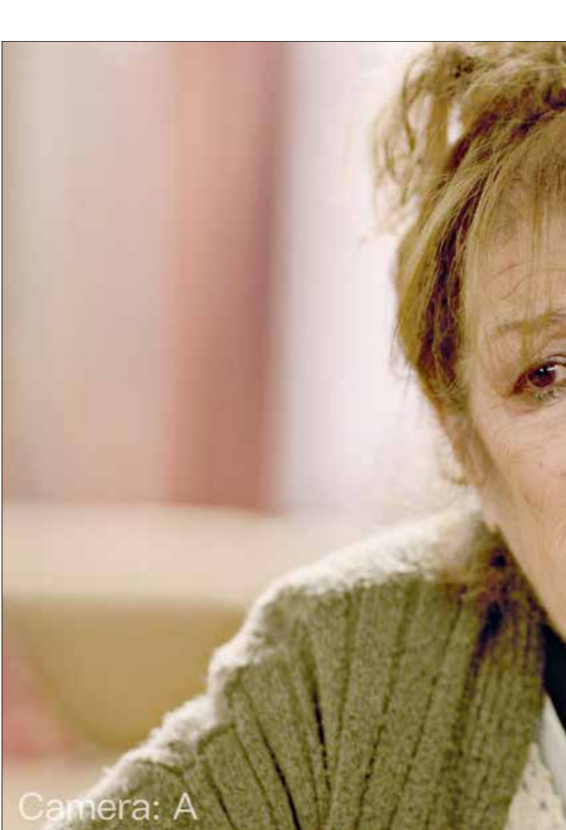
ملق واصف في الجزء الأول من «ما اختلافنا» (الجزء 2)

سيزوم مسلسل بوليسي اجتماعي، تجدا أحداثه جبرية قتل تتشعب منها قصص اجتماعية عدة، يتشارك في بطولته نخبة من نجوم