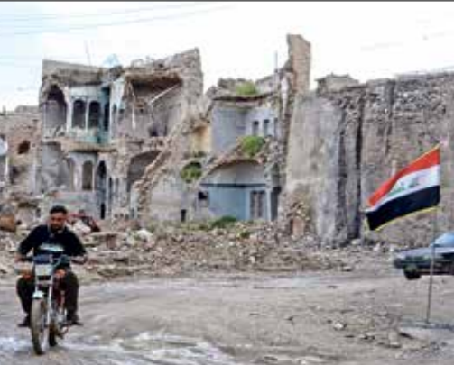
مشاهد الدمار تخيم على عدة مدن رغم مرور سنوات على الحرب