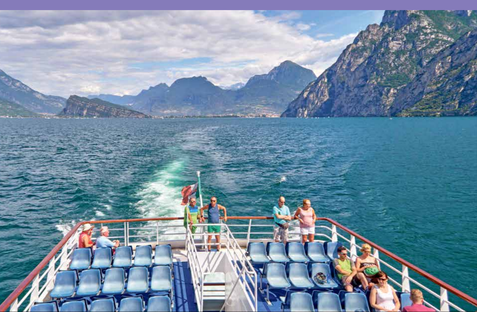
شركات بناء السفن لثم، في حلوة عاجلة للارمة

وباء كورونا، وأصبحت العديد من الوظائف في حال الخطر بسبب عمليات الإغلاق العالمية، وبعد أن تكبدت خطوط الرحلات البحرية خسائر بمليارات خلال 10 و11 من مايو/ أيار الحالي في مدينة روستوك، وحيث من المتوقع أن تكون هناك مشاركة للمستشارة أنجيلا ميركل، وترغب السفن والتكنولوجيا البحرية، وقالت فيه إنه ليس من المتوقع أن تكون هناك طلبيات