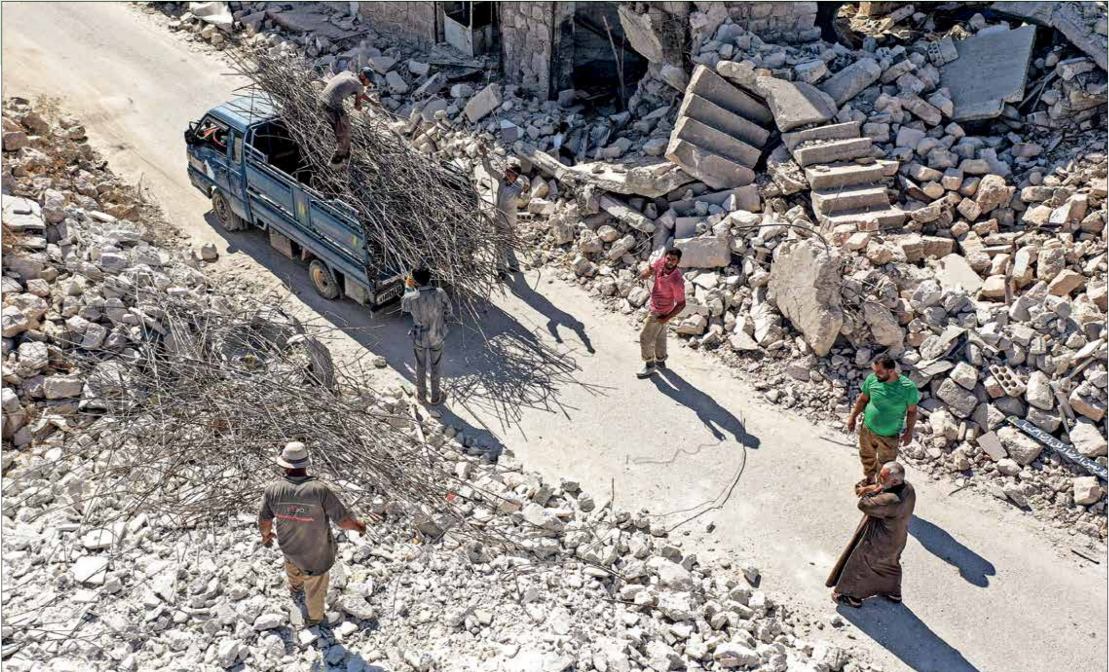
كلفة كبيرة الإصلاح ما دمرته الحرب