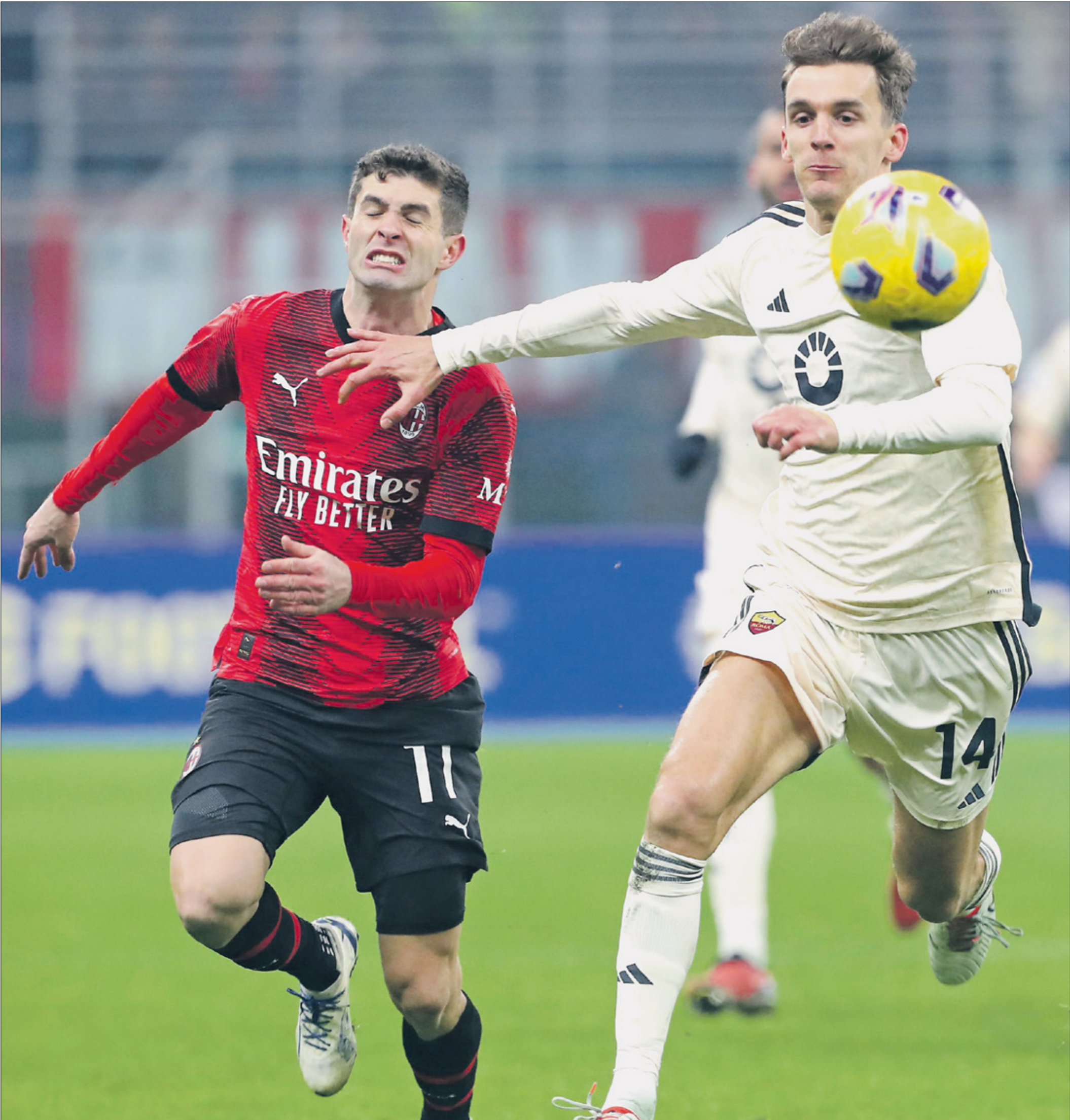
صراع قوي بين ميلان وروما (الأسود بيمين)

حيث أظهر في مناسبات عديدة قدرة على الخروج من الأزمات، بعد أن واجه فرقاً قوية مثل أياكس الهولندي، وفياريرال الإسباني، وكذلك برايتون الإنكليزي، وتعتبر الفرصة قائمة بالنسبة إلى كل فريق من أجل التأهل إلى نصف النهائي، باعتبار التقارب الكبير في المستوى والقدرات.