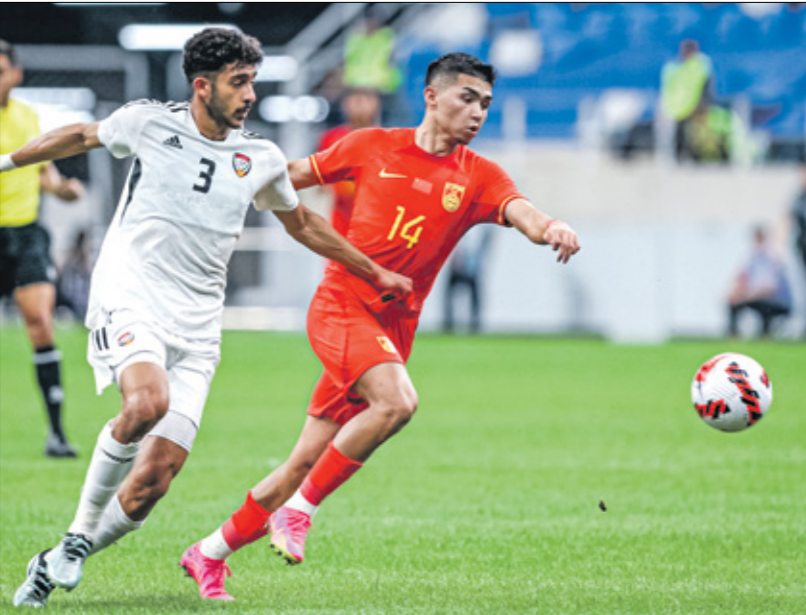
حصد منتخب الإمارات لقبه لكأس آسيا بعد مواجهة الصين في نهاية العام الماضي

يذكر أن قرعة الألعاب الأولمبية دارت الشهر الماضي، في مبنى «لو بولس» بضاحية سان دوني في العاصمة الفرنسية، وجاء منتخب المغرب في المجموعة الثامنة مع منتخبات الأرجنتين وأوكرانيا والمنتخب الذي سيكون صاحب المركز الثالث كأس آسيا تحت 23 عاماً، إذ أمّن منتخب مصر فقد أوقعته القرعة في المجموعة الثالثة مع المنتخب الإسباني ومنتخب جمهورية الدومينيكان، علاوة على المنتخب الذي سيحصل على المركز الثاني في كأس آسيا، فيما ضمت المجموعة الأولى كلا من منتخب بلير المنظم المنتخب الفرنسي، ومنتخب نيوزيلندا، ومنتخب الولايات المتحدة الأميركية، والمنتخب المتاهل من المباراة الفاصلة التي ستجمع الفائز بالمركز الرابع لكأس آسيا تحت 23 عاماً ضدّ منتخب غينيا، بينما تضم المجموعة الرابعة والأخيرة منتخب الباراغواي، ومنتخب مالي، والمنتخب الفائز بلقب كأس آسيا.