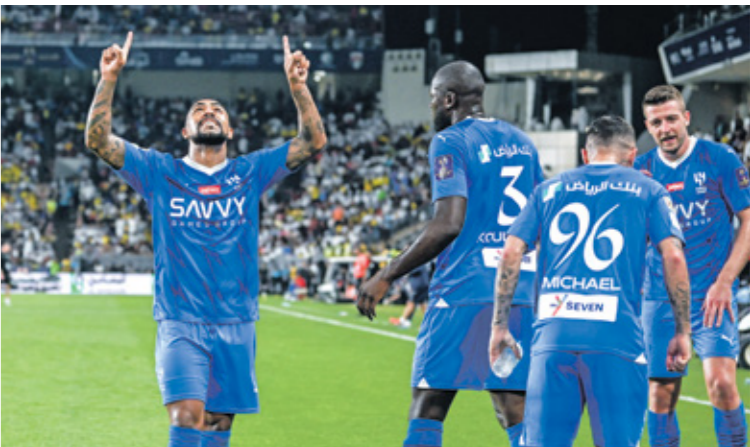
يُعتبر الهلال من أبرز المرشحين لتتوج بلقب (الأسود)

ستتوجّه الإنتظار مساء الخميس إلى قمة الهلال والاتحاد في نهائي كأس السوبر السعودي موسم 2023-2024، في مباراة سينتخبها ملعب «محمد بن زايد» في الإمارات والذي يتسع لحوالي 15 ألف متفرج، وسيحتك كل فريق عن لقب محلي مميز يُحقّقه قبل نهاية الموسم الحالي، ويوصل فريق الهلال إلى المباراة النهائية بعد أن تفوق على منافسه فريق النصر (1-2)، بقيادة نجمة البرتغالي،