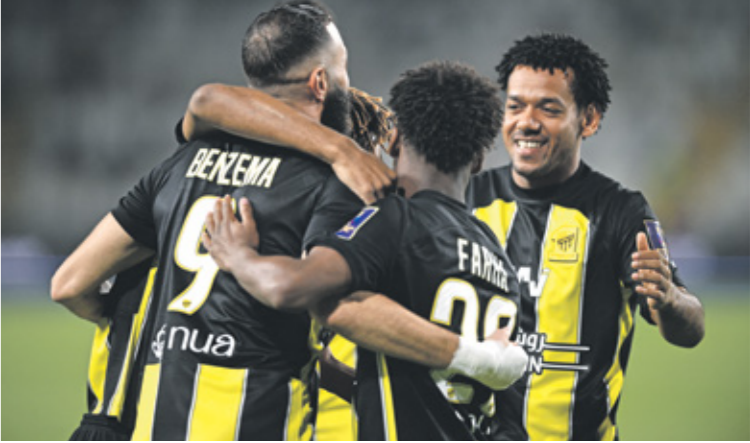
يسعى الاتحاد بقيادة نجومه لربح كأس في المباراة (الأسود)

عودته القوية في كرة القدم السعودية. وفي مقارنته معسوى الفريقين في بطولة الدوري السعودي، فإن الهلال يُقدّم كل شيء في هذا الموسم، فهو يتصدر برصيد 77 نقطة من 25 فوزاً وتعادلين دون أي خسارة في 27 مباراة، في المقابل فإن الاتحاد الذي شهد تغيراتٍ كبيرة في الجهاز الفني، يحتل المركز الرابع برصيد 47 نقطة، بفارق 5 نقاط عن صاحب المركز الرابع فريق الأهلي (22 نقطة)، والصراع بينهما ما زال مفتوحاً من أجل حجز البطولة الرابعة الموهلة إلى بطولة دوري أبطال آسيا في الموسم القادم.