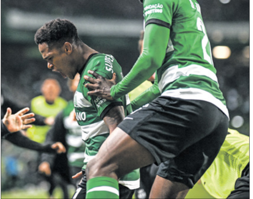
سبورتنغ حصد مباراة بلشيكام يوم 6 أبريل 2024 فيأرسيادج ميلو موريرا

يقرب نادي سبور تنغ للشبونة من حصد لقب الدوري البرتغالي لكرة القدم بفضل مواهبه