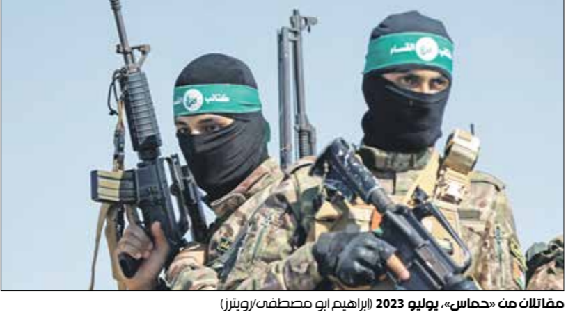
مقاتلات من «حماس»، يوليو 2023

في المحكمة كما هو متداول في القانون الجنائي، غير أن مصادر في وزارة القضاء، وقالت «هارتس»، إن الخبار المفصل هو إجراء محاكمات جنائية ضد عناصر «حماس». وأدى الإحتلال الإسرائيلي، إلى اعتقال المقاومين بحسب قوانينها، مستجوابهم إلى وضع إسرائيل أمام معضلات كبيرة لم تجاوبها في الماضي، والمعضلة الأكبر تعقيداً على الإطلاق هي كيفية محاكمة مئات المقاومين وحت أي تهم ينبغي محاكمتهم، وفقاً للصحيفة العبرية. وسيتم اتخاذ القرار النهائي، بالتشاور بين السنوي السياسي وجهات الاستشارة القانونية، ومن المتوقع أن يتأخر ذلك بصفقة إطلاق سراح المحتجزين الإسرائيليين في قطاع غزة، والتي تتم مناقشتها هذه الأيام، خصوصاً إذا أطلعت المحكمة الإسرائيلية على خبرات غير بل المقابلة التصريحات التي خرجت بل منطق ولا داع». ورأى أنه «تجان الأخطو بالولايات المتحدة أن تقدم سمياً لهذا الوقوف بلا حدود مع إسرائيل، ولماذا الموافقة على هذا الدمار المروع».