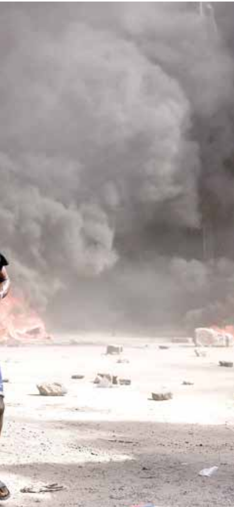
متظاهر سنغالي في داكار، الجمعة

تنتهي ولاية سال الرئاسية في مطلع إبريل المقبل، وكان قد انتُخب للمرة الأولى خلفاً لعبد الله واد عام 2012، وأعيد انتخابه عام 2019، وكان من المقرر أن يشهد البلد انتخابات جديدة وسط تنافس مجموعة من المرشحين يزيد عددهم عن 20 مرشحاً، منهم من المعارضة، ومن هو قريب من مؤسسة الحكم. أثار القرار قلقاً في الداخل والخارج، وحرك مخاوف من أن يغرق هذا البلد، المعروف بأنه يشكل عامل استقرار في أفريقيا، في الجهول بعدما شهد حلقات من الاضطرابات الدامية منذ عام 2021، خصوصاً أن العديد من مرشحي المعارضة قرروا تجاهل قرار سال وواصلوا إطلاق حملتهم الانتخابية، واعتبارهم القرار «غير ديمقراطي» و«غير دستوري». لا تزال السنغال بمنأى عن الهزات الكبرى التي