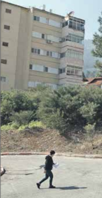
مستوطنة «كريات لشوشنة»، ضمن الحد

وكان الاحتلال قد استهدف سبعة بلدات حول، مساء السبت، إذ أفادت الوكالة الوطنية للإعلام اللبنانية بسقوط شهيدين وعدد من الجرحى بالقصف، وفي التفاصيل، أنه بعد الانتهاء من الصلاة في مسجد البلدة، استهدف الجموع بقصف مدفعي بلغف من عيار 155 ميليمتراً، فضلاً عن إطلاق صواريخ من مسيرة باتجاه المسجد، مانعا كل من حوال الاقتراب من الجرحى، واستهدف «حزب الله» ليل السبت، الأحد، مبنى في مستوطنة المئارة يتنمّض بداخله الجحود الإسرائيليون، وتجمعا لجنود الاحتلال في مرتفع حذب عتبا، وقاعة خربية ماعر ومرابضها بصواريخ «فلق» ومشاة بيت الجدي في مستوطنة «كريات شوشنة»، ووسط استيطان اوتوتري، قرر رئيس أركان الجيش الإسرائيلي، هرسي