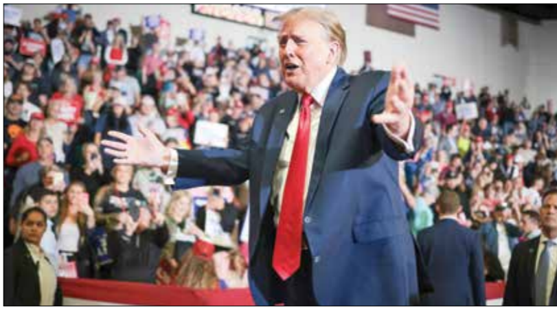
هاجم ترامب سياسة بايدن المتلمعة الهجرية

بالرئاسة في انتخابات نوفمبر/ تشرين باين، وفي كلمته، أشار ترامب إلى حديث آخر في أحد اجتماعات الحلف، وروى أنه من غير العادل الزام والشحن بالدفاع عن الدول الـ30 الأخرى الأعضاء في الناتو، الحلف الذي تطلّما أبدى ترامب خلال لهجوم من روسيا، لن يستحوطوا فقط! له: لم تدفع إذا أنت متأخر في السداد، لا، إن أحفظ، بل قد سأتشجع على القيام بما يريدون عليك أن تدفع. عليك أن تسدّد فواتيرك»، وتأتي تصريحات بعدما رفض الجمهوريون في مجلس الشيوخ، الإربعاء الماضي، مشروع قانون ينص على