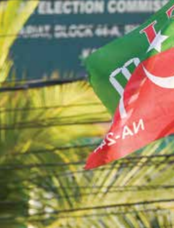
منة احتجاج انصار خان في كراتشي، امس (صفحة حسنة فرانسيس)