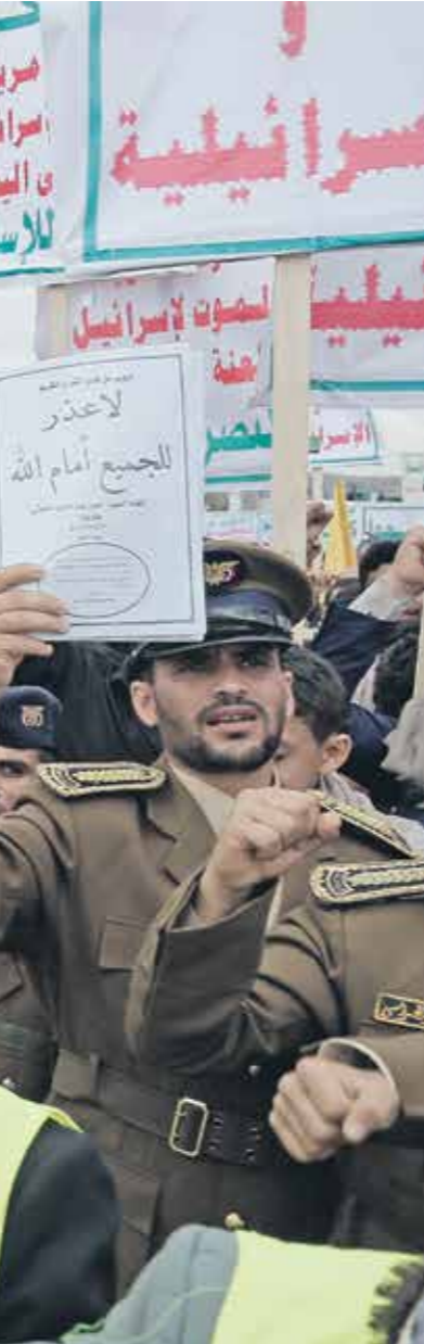
منظارة للحوثيين حصما لغمرة في صنعاء، 9 فبراير

الأحمر ومضيق باب المندب الاستراتيجي في اليمن. وأعلنت جماعة الحوثيين في 5 فبراير الحالي، أن الولايات المتحدة وبريطانيا استهدفتا اليمن بأكثر من 300 غارة منذ بدء هجماتها على البلاد، بحسب نائب وزير الخارجية في حكومة الحوثيين (غير المغترف بها) حسين العزني. الغالبية المواقف التي تم استهدافها بالغايات الجوية، هي عبارة عن معسكرات وقفار معلنة ورسمية للقوات العسكرية اليمنية، قبل أن يسيطر عليها الحوثيون بعد 21 سنين/يناير 2014، وتم استهدافها من قبل التحالف الذي تقوده السعودية في