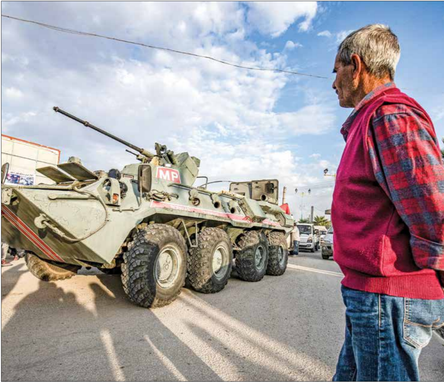
مواطنت سوريه يراهب اليه الروسية في السحكة، اكتوبر 2019 (تلك سليمان فرانسيس)

ضابط من التوجيه السياسي للاعتراض على الأمر، الشاب الذي عمل عدم ذكر اسمه لأسباب أمنية قال: «لما برضني الجديد» إنهم يجهلون اللغة وما يتضمّنه جواز السفر، ولكن بحسب المرشحين هناك، فإنه مخصص فقط للتجنّول داخل روسيا، حيث تتجنّوا أنهم لم يحصلوا على الجنسية الروسية الكاملة، مع وعو، بإعتابهم الجواز الكامل عند الإجازة الخارجية، وخدم بأن وضعهم في سورية كان كارثياً، عسكرياً روسي، على اعتبار أنهم أصبحوا مواطنين روس. وبحسب عدد من الشّبان الذين زاوا الدمشقي، فقد أكد هؤلاء «العربي الجديد» لـ هذا السمسار، الذي يقوم بمهمة استقطاب الشّباب لصالح روسيا والسويداء، كان يتقاضى بداية الأمر مليوناً ونصف مليون ليرة سورية (الدولار يساوي 14500 ليرة سورية) عمولة عن كل شاب يرغب السفر إلى روسيا، ثم دفعها، إلى ثلاثة ملايين ليرة، وأخيراً إلى خمسة ملايين، فيما يتقاضى أكرم طراف 3500 دولار من كل شاب من الشّبان الذين وصلوا إلى هناك، لتقطع من رواتبهم الشهرية. يؤكد أحد الشبان الموجودين حالياً في أراض ضممتها روسيا بعد الحرب من الدفعة الثانية إلى روسيا، وتلك الجوازات موضوعة عليها فترا عمل روسية مرة واحدة، لكن هؤلاء الشّبان حصلوا على وعو، بأن تمخّ لهم جسر فور وصولهم وبحسب مقطع صوتي مسرب من أحد المدونين لثبته، فإن جمهورية باقوتيا بحاجة إلى زيادة عدد سكانها، القليل جداً بالنسبة لساحتها الكبيرة بين جمهوريات روسيا الاتحادية، لحماية الثرون على السلاح، وأشار إلى اعتراضهم على ذلك، وطلبهم حضور