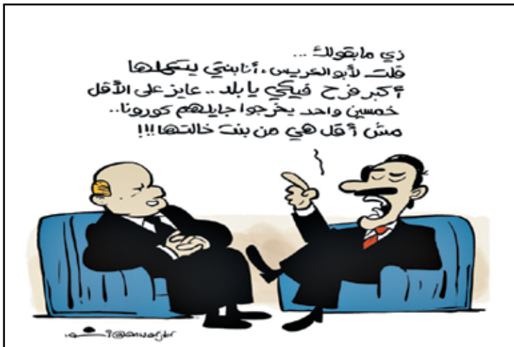
إصابات جديدة بكورونا في مصر