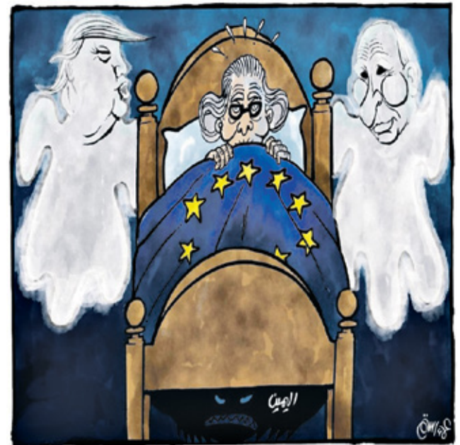
بوتيت واليمين وترامب، كوايبس أوروبا