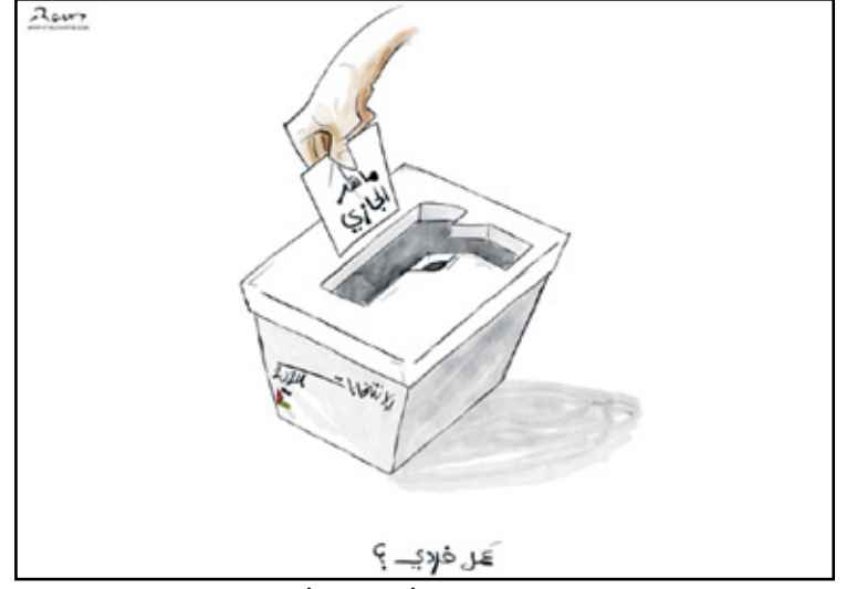
في موسم الانتخابات انتخب الأردنيون شهيداً يمثلهم فعلاً (رافقت الخطيب)