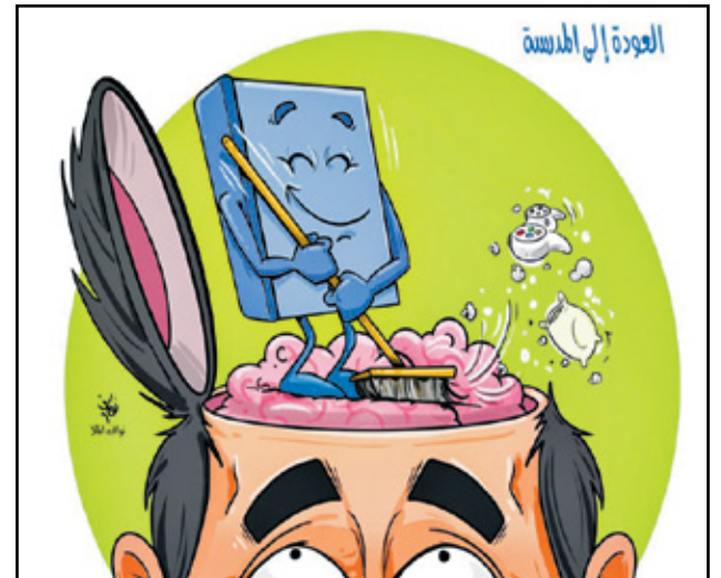
كتاب المدرسة ينظف الأدمغة من «الديمز»