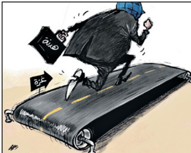
محادثات هدنة غزة