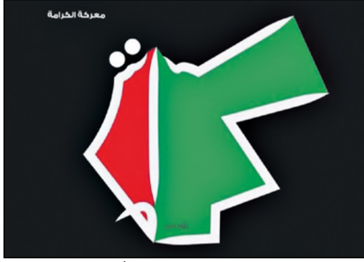
عملية الكرامة تذكر بمعركة الكرامة ووحدة الشعبين

لكن قبل إرسال «الاسترحام»، صوّب المراجع اللغوي خطأ فادحاً في الجملة الأخيرة، فاستبدلها بـ«شلل الصغار».