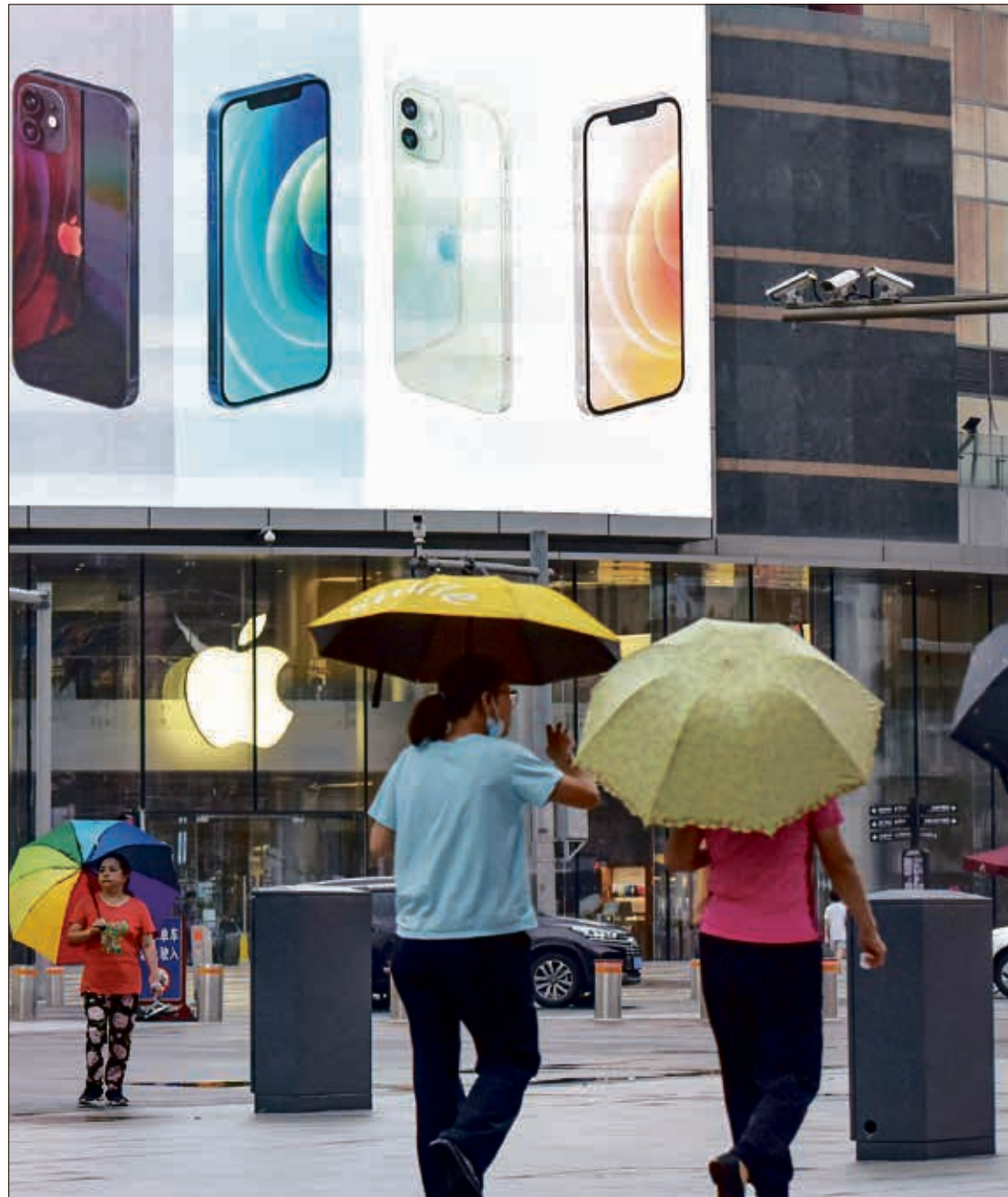
بذخ فيروس كورونا في اجتهاد الشركة

وفق تقرير جديد لموقع «ناين تو فايف ماك» المختص بأخبار أجهزة «آبل»، أدخلت الشركة ميزة طيبة فريدة من نوعها ستكون الأولى في السماعات الذكية في الأسواق، فالجيل الثالث من سماعات «إيربودز» سيرزود بأجهزة مدمجة تقدم قياسات دقيقة لمعدل التنفس لمستخدميها بواسطة صوت التنفس فقط. ومع هذه الميزة، سيستفيد المستخدمون الذين يعانون من حالات تتطلب قياس معدلات التنفس على مدار الساعة، وقياس معدلات التنفس عند مؤشر RR. السماعات ستقوم بعدها بالاتصال أو بتنبه الطبيب الخاص بالمستخدم في حال لوحظ أنه في حاجة لذلك. في ما يخص التصميم، أكدت التسريبات أن السماعات ستبدو إلى حد كبير مثل الجيل السابق أي «إيربودز برو»، ولكن بدون أطراف الأذن المصنوعة من الكاوتشوك. الخبر نشر عبر وكالة «بلومبيرغ»، التي أكدت أن سماعات الأذن اللاسلكية ستتميز بجذع قصير مشابه لـ «إيربودز برو»، وذلك ليحل مشكلة السقوط المتكرر للسماعات من أذان عدد كبير من المستخدمين. وعن المزايا، لن تتمتع سماعات «إيربودز 3» بميزات خاصة مثل إلغاء الضوضاء ووضع الشفافية، وذلك لغياب الطرف الكاوتشوكي. ومن المرجح أن تروّج «آبل» لأنظمة «دولبي أتومز» مع «سبيكأل أوديو» مع الجيل القادم حتى يتمكن عملاء الشركة من «سماع الفرق» بشكل أفضل بين الإصدار الجديد والنسخة الأحدث المرتقبة من السماعات.