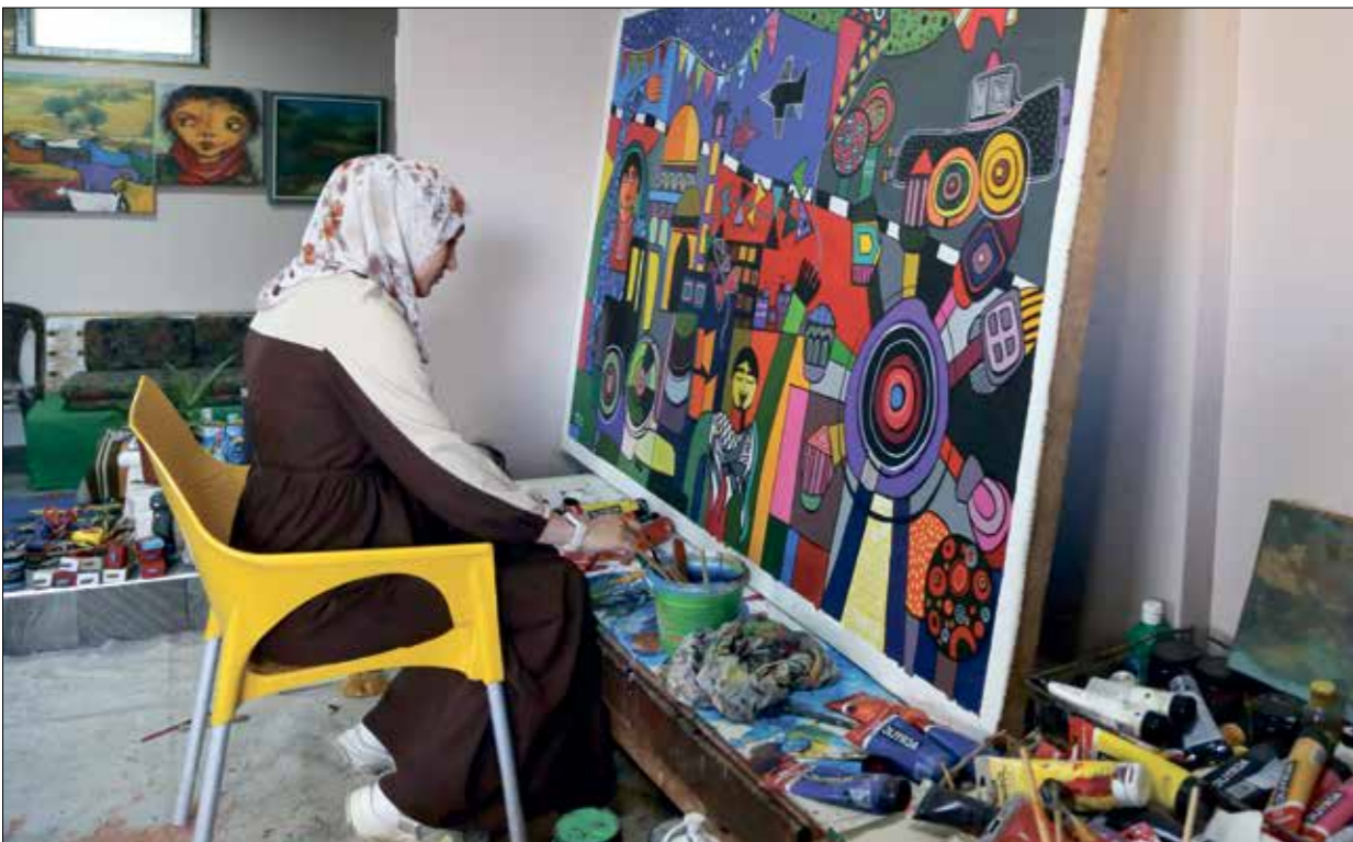
لا يبالغ الزوجان الحواجري ومطر من تحضات المواهب اللاتلة أو الراغبين في تعلم فنون الرسم (عيد الكوكب ابو رشان)

حملة المشروع طابع الاستمرارية لسنوات والاستثمار بالحكاية