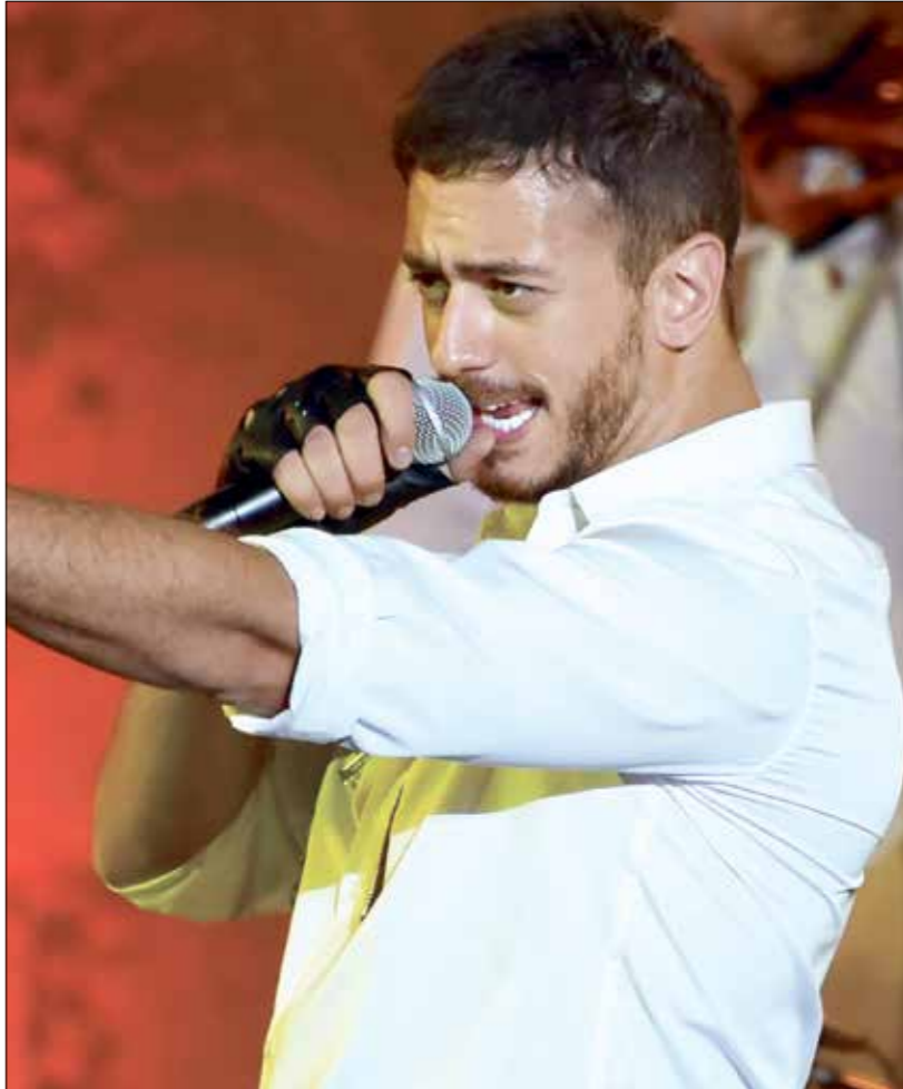
حَفَ سعد لمجرد ما لم يكن يحلم به والده

كَمَا يصدر سعد لمجرد أغنية جديدة، والسبب هو أنّ المنطلقات الفنية تختلف. ثم إنّ الزمن والسياق الذي ننتمي إليه اليوم فكَّ مفهوم الذوق الفنّي وجعله خاضعاً لمعايير الطلب والمتابعة ومتطلبات الواقع اليومي. هذا فضلاً عن تقدّم أمزجة الناس ونزوعهم إلى مجرّم أغانٍ أكثر احتكاكاً والجامعة.