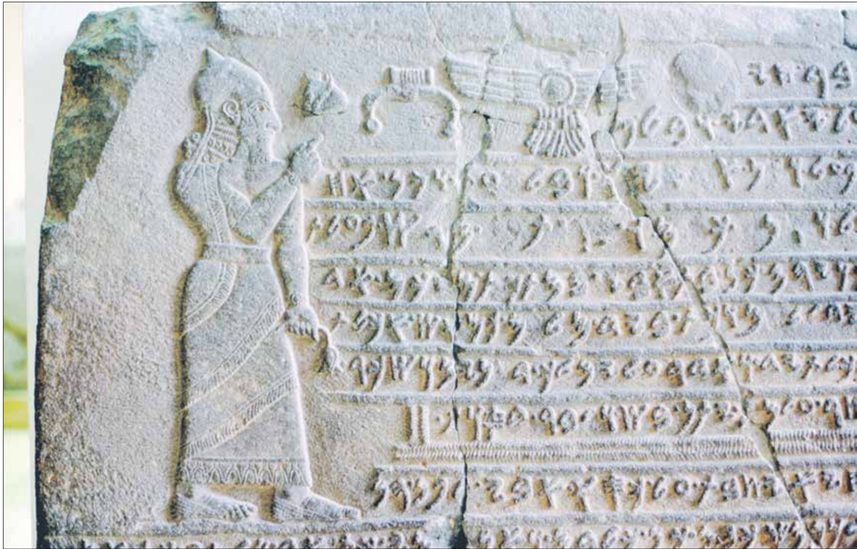
ظهرت الكتابة المسمارية نحو 3000-3350 قبل الميلاد

حددت مجموعة بحثية سلسلة من الارتباطات بين التصميمات المنقوشة على الأختام الأسطوانية في العراق، التي يعود تاريخها إلى نحو ستة آلاف عام، وبعض العلامات في النص المسماري البدائي الذي ظهر في مدينة أوروك