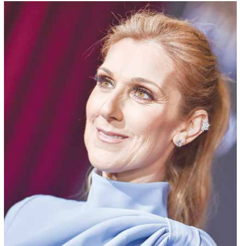
سيلين بيون، كُنت ملانة راحة

هذا الوثائقي سيرة شائبة، حققت حلماً، بأن تصبح نجمة عالمية. برصد سيرة عمل في عمر طويل في «أنا سيلين بيون» (2024)، لإلين تايلور بروديسكي، شرح مُبجج للعمل مع الآخرين لتحقيق نجاح مُستدام لا مؤقت. فديون قدوة لملايين النحاتر، ما الخمن الذي ينبغي دفعه لتجسيد هذا الشغف؟ فنانة تصنع أشياء جميلة لم تطف أن يصدر عنها صوت أُنشأن احتراماً للجمهور. اكتشفت بشاعة صوتها بعد المرض، فعزت نفسها: «كنت فنانة رائعة»، كي لا يضيع هذا المسار العظيم، يعرض الوثائقي كيف تخصص الفنانة وقتها كله للمُتَمَرِّن، تفتي وتُشخّص المشاعر التي ستجسدها، يأتي كتاب ومخرجون وأطباء وممرضات إلى منزلها، يدلل الأعتياء أجسادهم. صار الجسد أهم من الروح. كلفة صالات الرياضة و«مشاج» أعلى من دور العبادة.