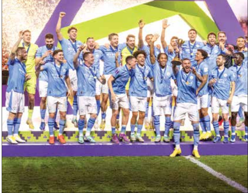
مانشستر سيتي حصد لقب السخة العاضية

تتجه انظار عشاق كرة القدم في 5 ديسمبر إلى ميامي، حيث تُسحب قرعة مونديال الأندية