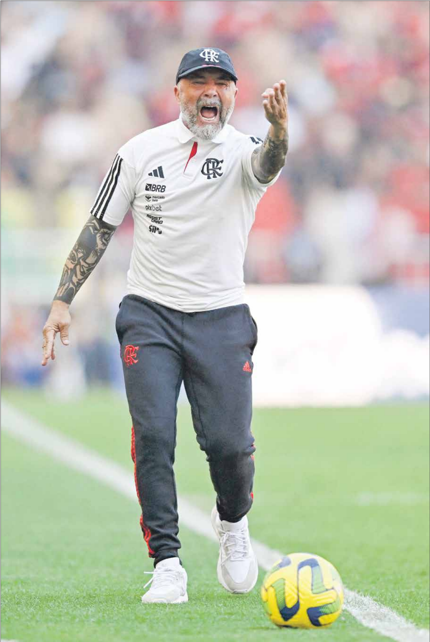
سيبوع سامبولي الـن ملابسات الدوري الفرنسي