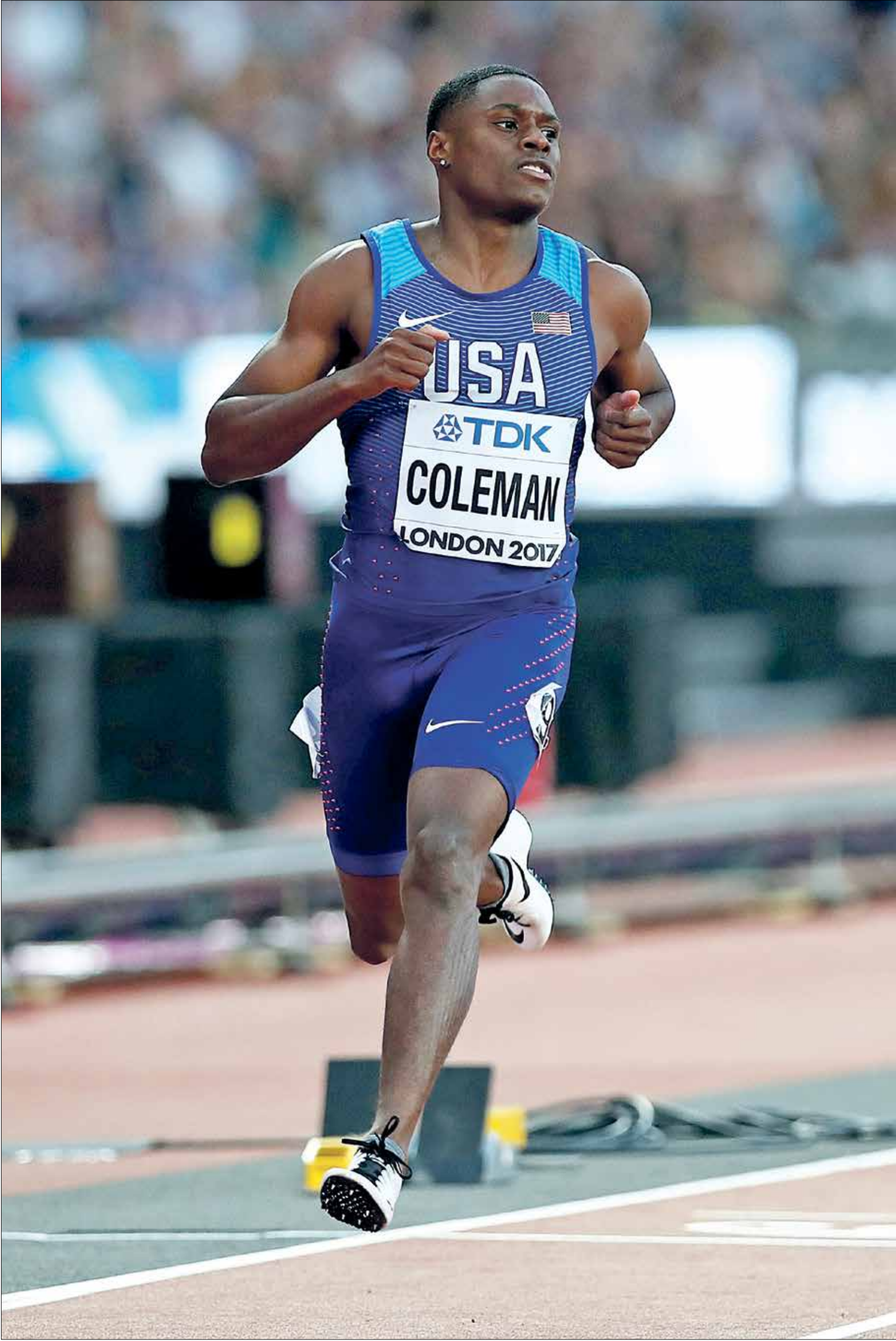
كولمان سيعود إلى مضمار الركض بعد أشهر

أعلنت محكمة التحكيم الرياضية (كاس) تقليص عقوبة إيقاف العداء الأميركي، كريستيان كولمان، إلى 18 شهراً بعد استئناف الأخير قرار وحدة النزاهة في الاتحاد الدولي للعبة القوى استبعاده لمدة عامين بسبب خرقه قوانين مكافحة المنشطات. وكانت وحدة النزاهة قررت إيقاف كولمان، بطل العالم في سباق 100 م عام 2019، اعتباراً من 14 أيار/مايو 2020 بسبب تغيبه عن الاختبارات المفاجئة ثلاث مرات توالياً.