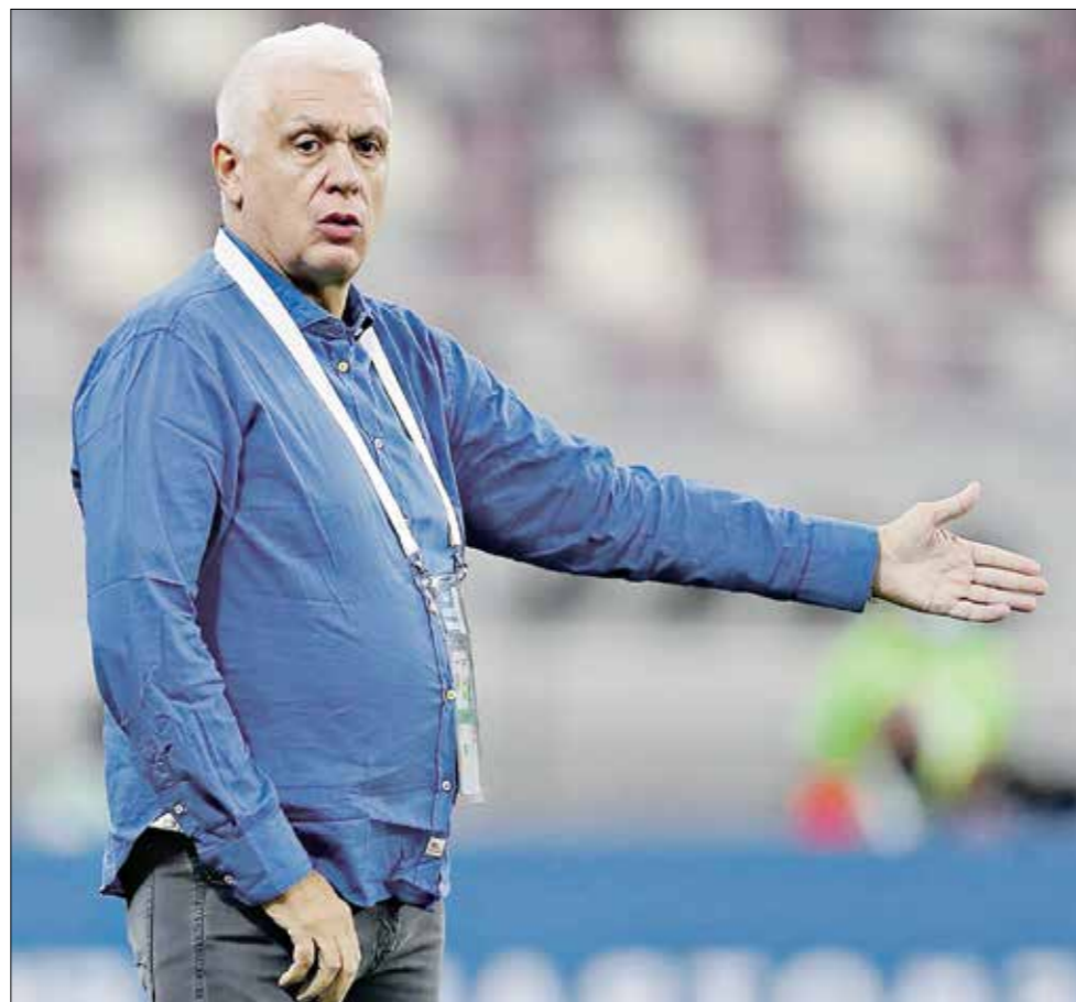
يذكر فيلود مدرب السودان بقوله الصارخة في البطولة

سيرته حينها، وقدم نفسه أسطورة من أساطير الكرة العراقية التي صالت وجالت كثيراً في ملاعب الكرة العربية والعالمية. وتصدت وفاته في يوم 21 يونيو/حزيران 2020 جراء إصابته بفيروس كورونا، بصدمة كبيرة للجميع في الوطن العربي.