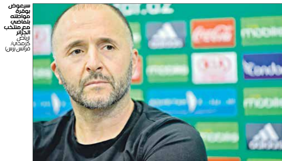
سبعوس بويرة عوانته بلطاحين مع منتخب الجزائر كرمحي