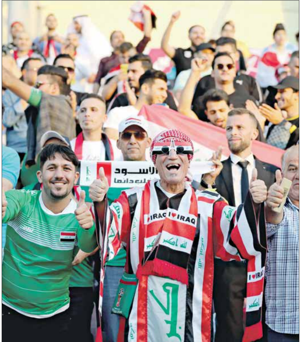
حذف منتخب العراق لقب السبعة الأتلة من كأس العرب

منتخب لبنان ثانياً، بنفس النقاط، في حين خلف منتخب سورية صدارة المجموعة الثانية، برصيد 5 نقاط، وأتى منتخب ليبيا ثانياً، برصيد 4 نقاط. وحقق منتخب العراق فوزاً على ليبيا (3-1)، ونصف النهائي، فيما فاز منتخب سورية على لبنان (1-0)، ليصل «أسود الرافدين»، ومناقسه «نسر قاسيون»، للمواجهة النهائية، التي حسمها منتخب العراق لصالحه، بهدفين مقابل هدف وحيد، وينال لقب كأس العرب للمرة الثانية على التوالي.