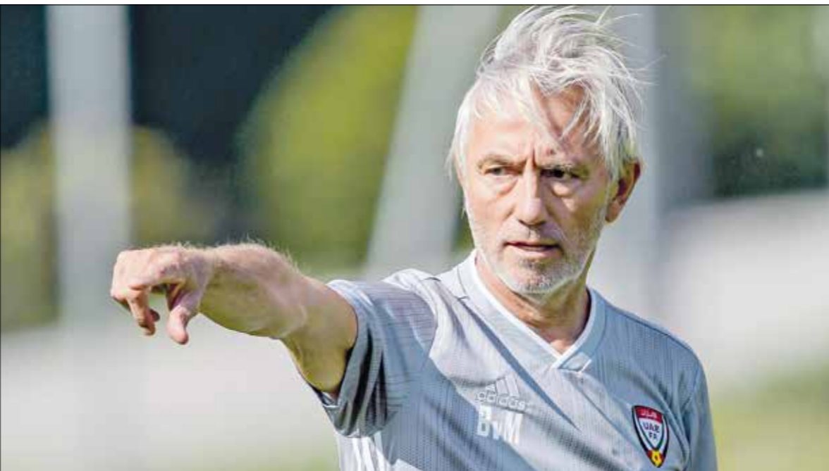
يطمح فان حارفيك للحظيف المفاجئة مع الإمارات