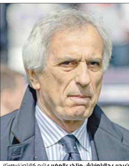
لتحرب حاليولرناش منتخب المغرب