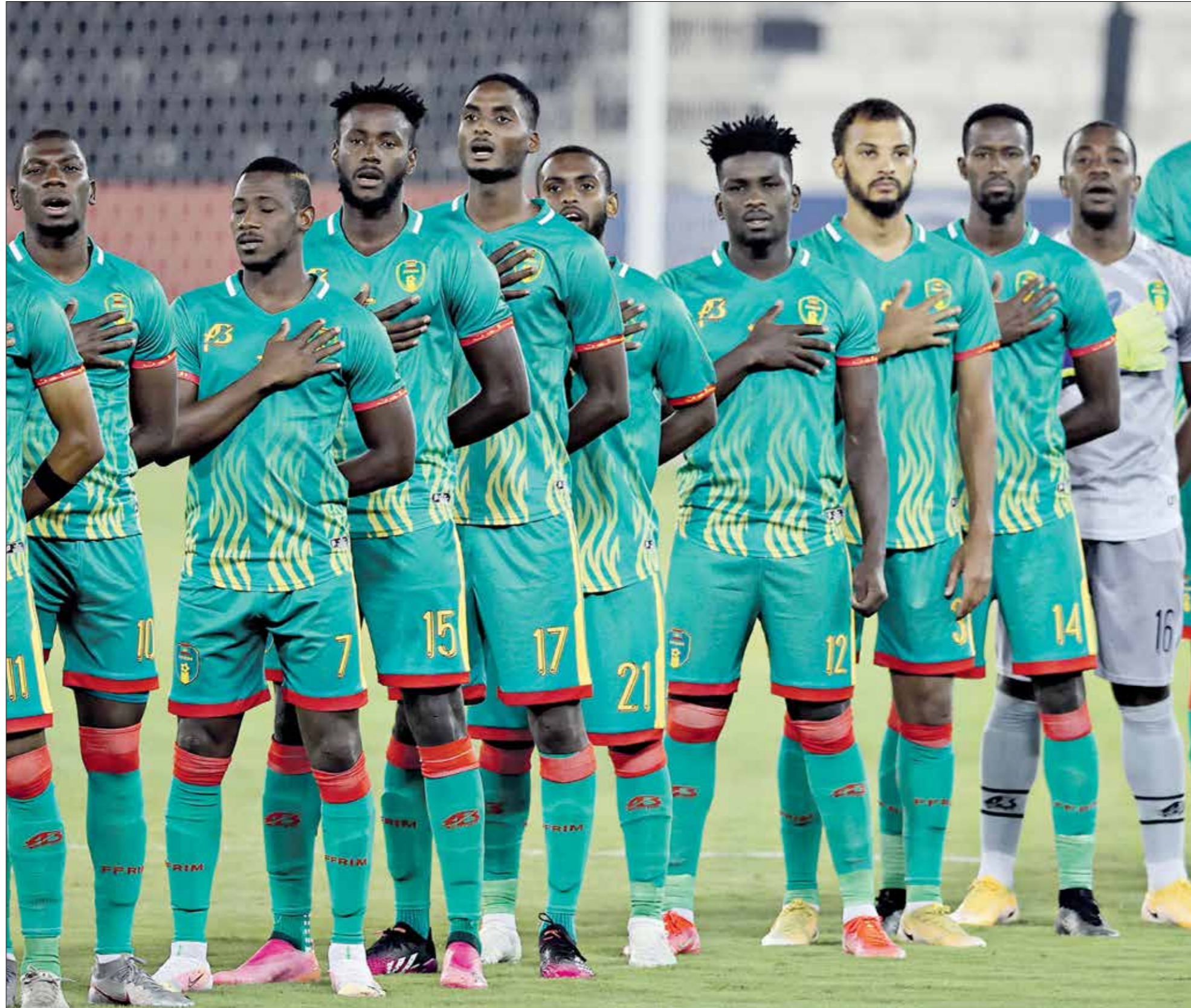
منتخب موريتانيا وطموح بتحقيق نتائج مشرفة