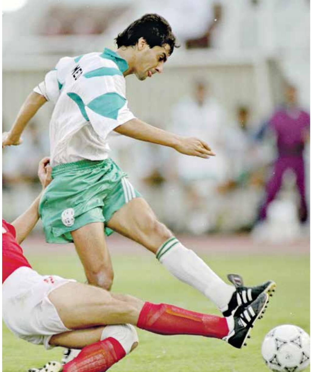
النجم الراحل أحمد راضي