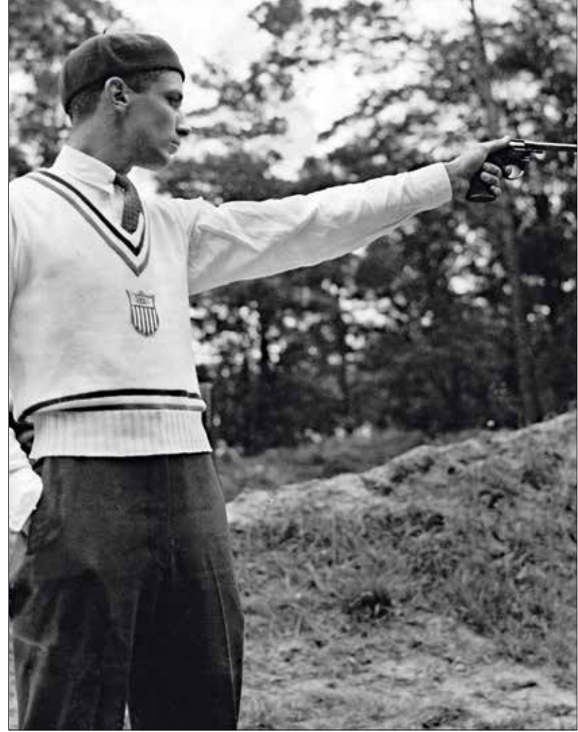
المباراة بالمسدسات حضرت في أولمبياد 1912