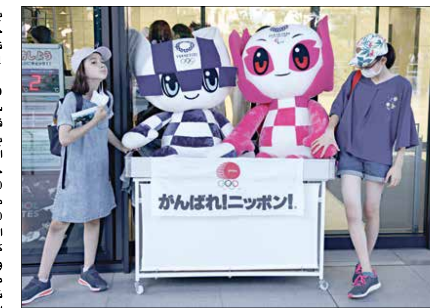
طوكيو تستعد انطلاق العرس الأولمبي

وتم تحديد الميزانية النهائية للألعاب المجدلة عند 1,64 تريليون ين، بما في ذلك حوالي 0,9 مليار دولار (96,3 مليار ين)، لإجراءات المضادة لفيروس كورونا. ستبذل الألعاب في تضخم التفتتات بمقدار 294 مليار ين (2,6 مليار دولار)، من الاحتفاظ بالموظفين إلى تدابير جديدة للوقاية من العدوى، لكن المعلنين البارالمبية في اليابان في منطقتين ما أمكن، بما في ذلك التخفيضات على