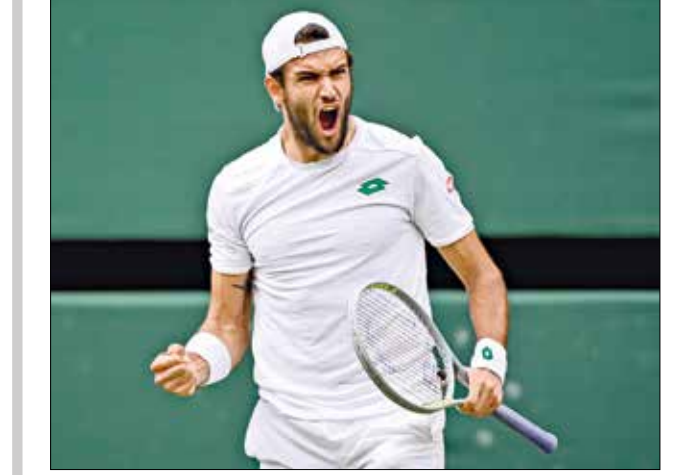
بريلاني وصلته الهامش ويميلون فيه الحسارة امام ديوكوفيتش

انسحاب بير تيني من منافسات التنس انسحب الإيطالي ماتيو بيرتيني، وصف بطولة «ويمبلدون» للتنس، إلى لائحة المسحوبين من مناسبات التنس بأولمبياد طوكيو 2020، الذي ينطلق الجمعة، وذلك بسبب إصابة عضلية. أعلنت اللجنة الأولمبية الإيطالية، وتعرض المصنف ثامناً عالمياً لهذه الإصابة في بطولة ويمبلدون، الأسبوع الماضي، بعدما أصبح أول إيطالي يصل إلى النهائي في ملاعب عموم إنكلترا قبل أن تنتهي مغامرته على يد الصربي نوفاك ديوكوفيتش، المصنف الأول. وقالت اللجنة الأولمبية الإيطالية إن بيرتيني اضطر «إلى الانسحاب من الألعاب الأولمبية بسبب الآثار اللاحقة لإصابة في العضلات»، وكان اللاعب البالغ من العمر 25 عاماً، يقود فريقاً إيطالياً مكوناً من فايو فونيني ولورنزو سونيفو ولورنزو موزيني في منافسات الرجال، وسارة إيرباني وجاسمين باوليني وكاميليا جورجي في منافسات السيدات.