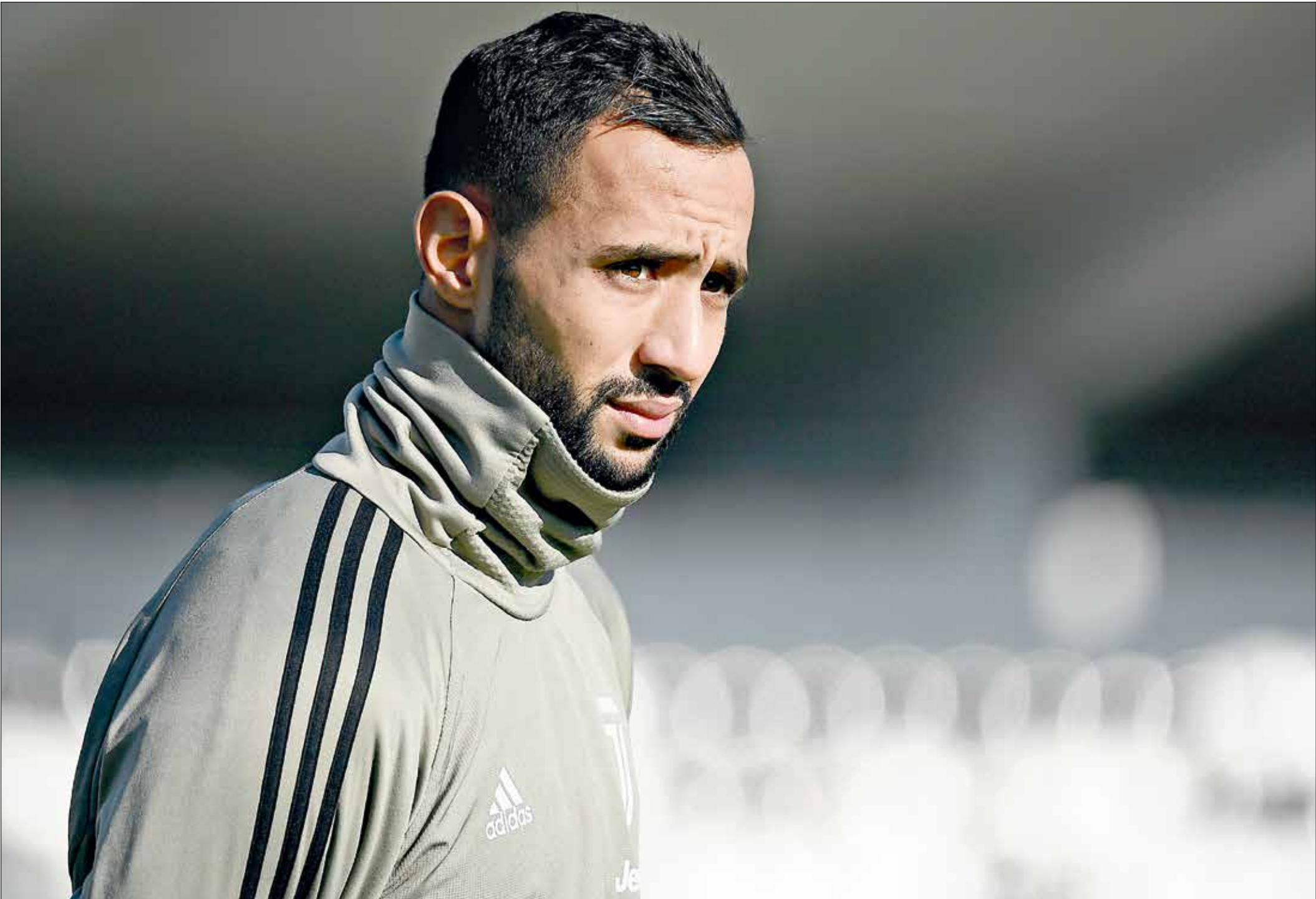
ببطولة بنفطيم بنحضر معاهتمام العديد من المشجعين

يبدو أن انتقال الليبي المصنم المغربي، إلى نادي بنفيكا البرتغالي، أصبح مهدداً بالقفل، بعد أن كان نجم نادي سبورتنج براغا قريباً من التعاقد مع المونج ببطولة الكأس الموسم الماضي، لكن الأخبار الأخيرة التي نقلتها مواقع برتغالية مختصة تشير إلى أن المفاوضات