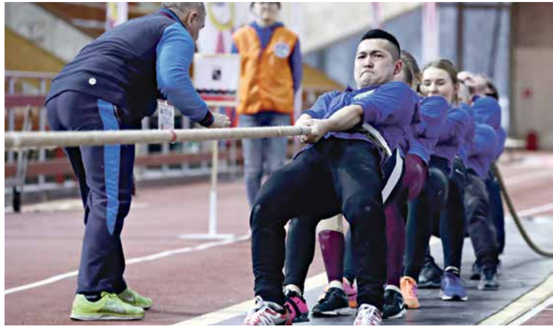
بلد الحبل لتبث في أولمبياد طوكيو