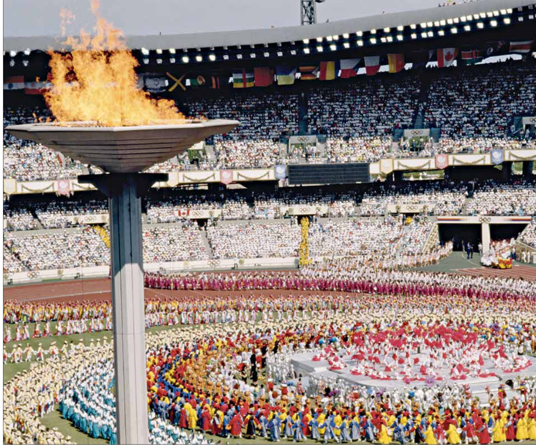
الألعاب الأولمبية تهدت لتغيرات على مساحات الرياضات

مشاركة 15,400 رياضي ورياضية من 205 دول ومناطق بالاعراب