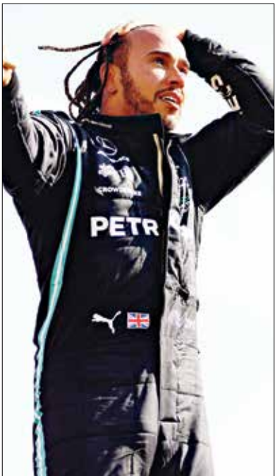
هاميلتون يصعد على التراب (فرانس برس)

نجا سائق مرسيدس البريطاني، لويس هاميلتون، من حادثة مع منافسه المباشر سائق ريد بول، الهولندي ماكس فيرستابن، في اللفة الأولى وتخطى عقوبة 10 ثوان، وتجاوز على الحلبة سائق فيراري، شارل لوكلير، من مونako، ليحرز فوزاً مستحفاً على أرضه في سلفرستون، أمام جماهير غفيرة بلغت 140 ألفاً صفقت لبطولها طويلاً في الجولة العاشرة من بطولة العالم للفورمولا 1، الأحد. وهو الفوز الثالث توالياً لـ«سير» هاميلتون في جائزة بلاده، رافعاً عدد انتصاراته على الحلبة الإنكليزية إلى ثمانية في رقم قياسي، والـ99 في مسيرة بطل العالم سبع مرات الساعي لدف ارتباطه مع أسطورة اللفة الأولى الألماني ميكائيل شوماخر. وعاد هاميلتون إلى سكة الانتصارات للمرة الأولى منذ جائزة إسبانيا الكبرى في 8 مايو/ أيار الماضي، بعدما فشل في الفوز في خمسة سباقات على التوالي في عام واحد، وذلك للمرة الأولى منذ عام 2016 عندما كان بالوان فريق ماكلارين. وقال البريطاني المنتشي بفوزه: «هو حلم بالنسبة لي اليوم» وحيناً «أفضل، أفضل الجماهير»