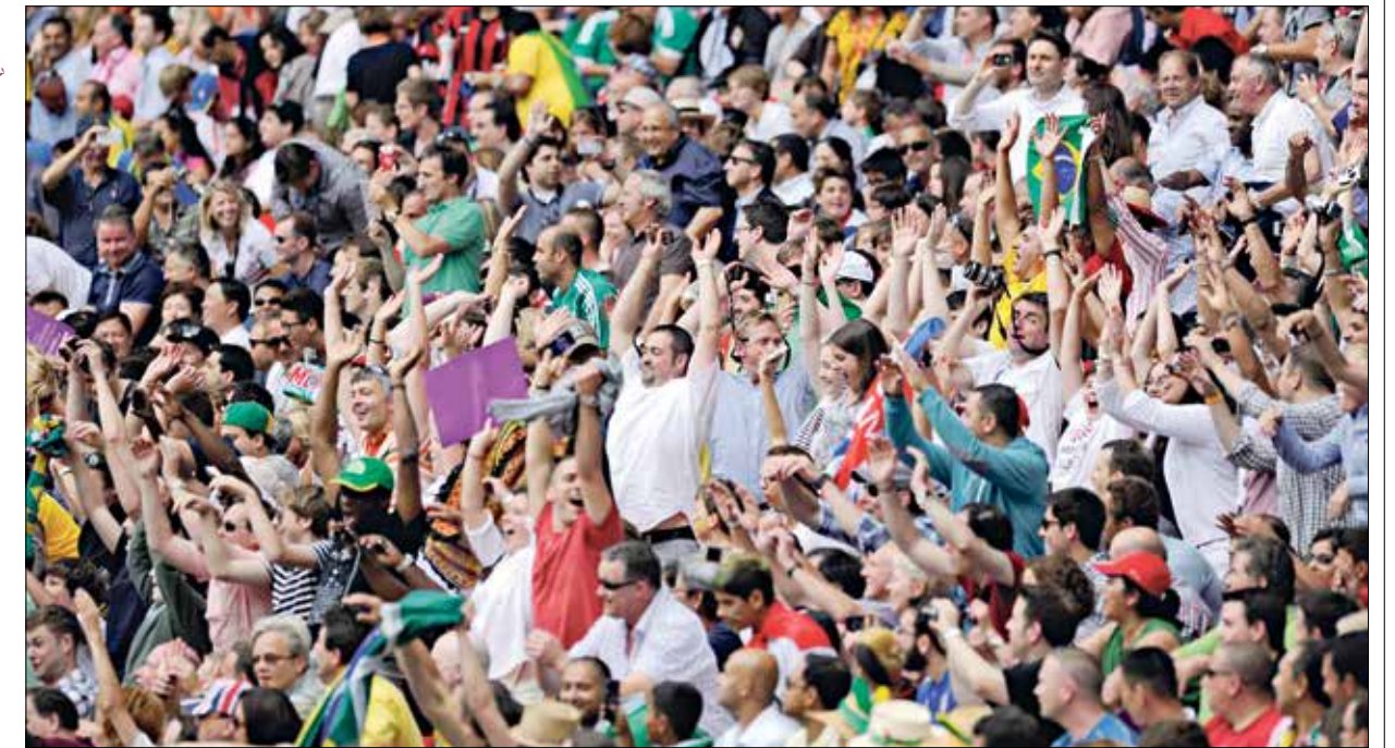
الجمهور سعيد مع نسخة ألعاب التوكيو