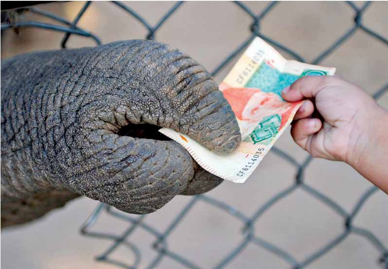
يلبر اختفاء الحيوانات أثناء كبرها هي باكستان

تقول جيهان إن المخرج الراحل يحيى سعادة هو من كرس هذا الفن، «استطاع خلال السنوات الماضية أن يجعل من جهة «اللوك» أساساً لأي عمل فني تنوي القيام به، لكن بعض الفنانات يحاولن التخلل من باب الحفاظ على صورة محدودة في ذهن الناس، يرفضون على سبيل المثال القيام