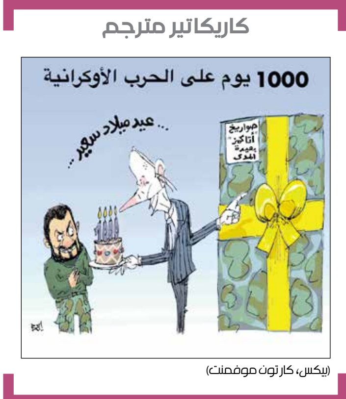
بيكس، كار تون موفمنت