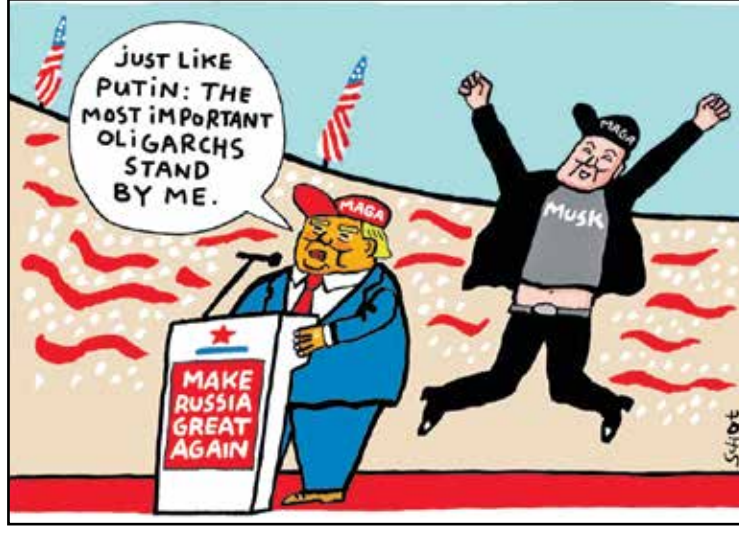
ترامب ملك بوتين مدعوم من الولىغارشي ماسك (شوت، كيفك كار تونز)

رب قائل أن لا اختلاف بين قمة «المتابعة» العربية الإسلامية التي عقدت قبل أيام بشأن غزة، ونظيرتها قبل عام للهدف نفسه. والحقيقة أن المشككين بسلامة المواقف العربية والإسلامية، سامحهم الله، لا يدركون أن القمة الثانية سميت قمة «المتابعة»، لأن هدفها «متابعة» توصيات القمة الأولى، أي أن «جماعة القمة» ما زالوا «متابعين» ما يحدث. وللتذكير، كان أهم ما خلصت إليه القمة الأولى، صياغة 31 بنداً أبرزها مطالبة الأعضاء بـ«كسر الحصار على غزة، وفرض إدخال قوافل مساعدات إنسانية عربية وإسلامية ودولية»، والثاني: «إدانة العدوان الإسرائيلي على غزة». أما القمة الثانية، فجاءت للوقوف على ما تم «إنجازه» بشأن التوصيات، أي أن «الجماعة»، على اعتبار أن كسر الحصار لم يحصل، فسيقيمون الدنيا ويقعدونها، بلا شك، لحاسبة المتقاعسين، الذين لم يمثلوا لأوامر كسر الحصار، ولن تأخذهم رافة، خصوصاً أنهم كانوا قد أمروا بتشكيل لجنة تجمع وزراء خارجية عربياً ومسلمين، لهذه الغاية، من ضمنهم وزراء في دول «الطوق» المحيطة بإسرائيل، التي تستطيع بلدانهم «كسر» الحصار مباشرة، لكنهم، أبوا إلا أن يجهدوا أنفسهم بتنظيم جولات عالمية، شملت دولاً بعيدة، للمطالبة بـ«كسر الحصار» نيابة عنهم. ولأصحاب الظنون السوداء، أيضاً، ثمة فرق وجيه بين القمطين، لم ينتبه إليه غير الأذكاء الذين ينجحون دوماً بمعرفة الفرق بين الصور المتشابهة... فالقمة الأولى دانت الحرب على غزة فقط، أما الثانية فدانت الحرب على غزة ولبنان!