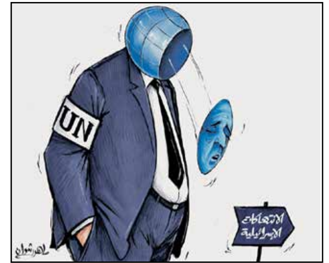
صورة الأمم المتحدة أمام الانتهاكات الإسرائيلية (ماهر رشوان، الجريدة الكويتية)