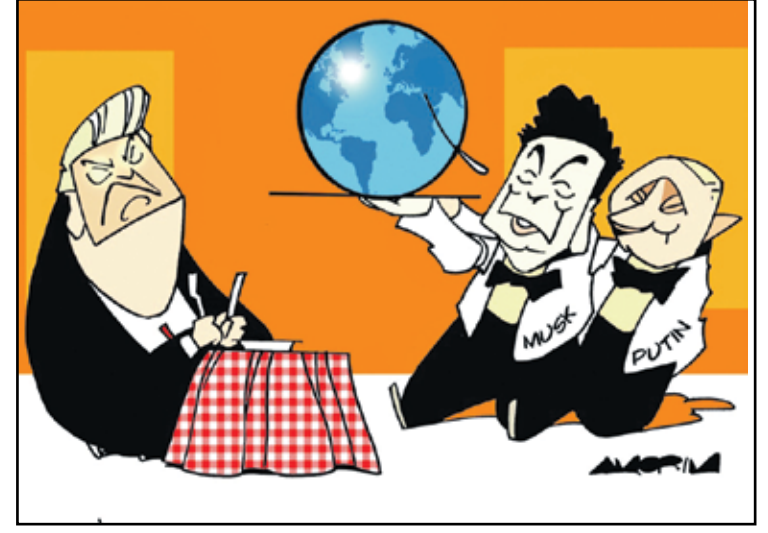
بوتين وماسك وترامب والمالم في الطيف (اموريم، كار تون موفمنت)