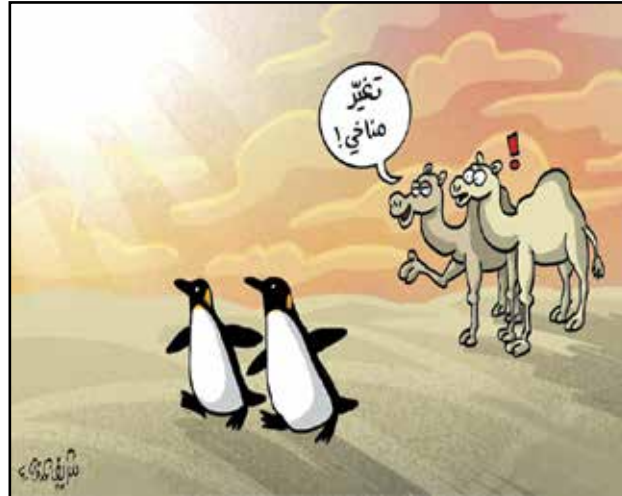
من عجائب التغيير المناخي (شريف عرفة، الاتحاد الاماراتية)