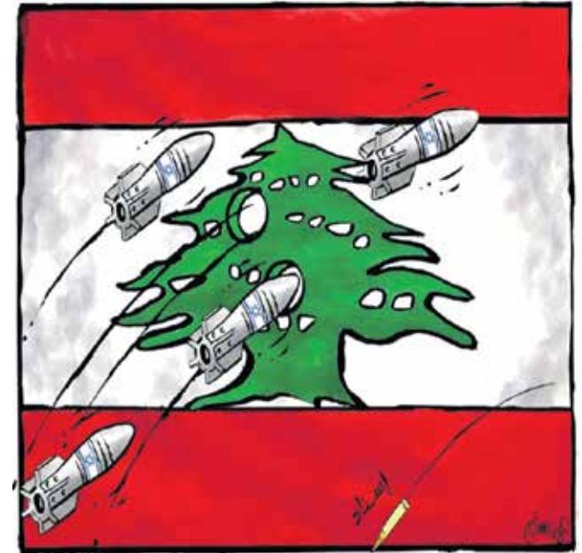
التصيد الاسرائيلي في لبنان