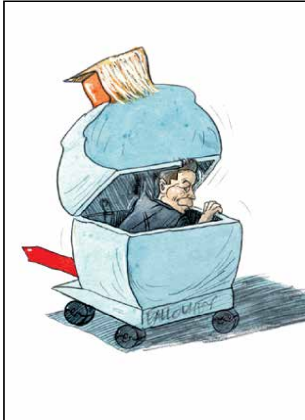
ماسك قطب فذ سيقود الزعيم الخاوي ترامب (بير بالويه، كيفك كار تونز)