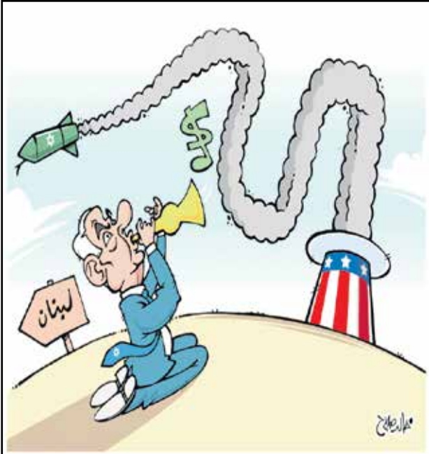
تنتياهو حاوي الخراب والتوسع (خالد صلاح، المصري اليوم)