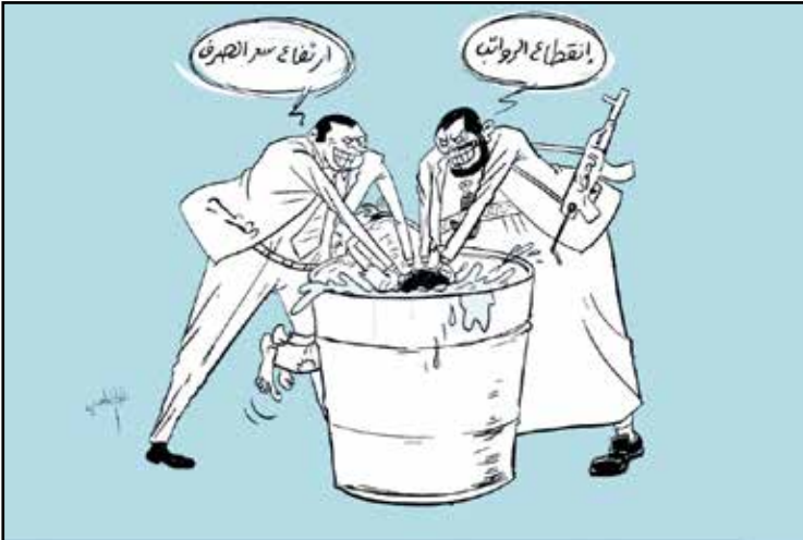
معاناة اليمنيين بين الحوثي والشرعية