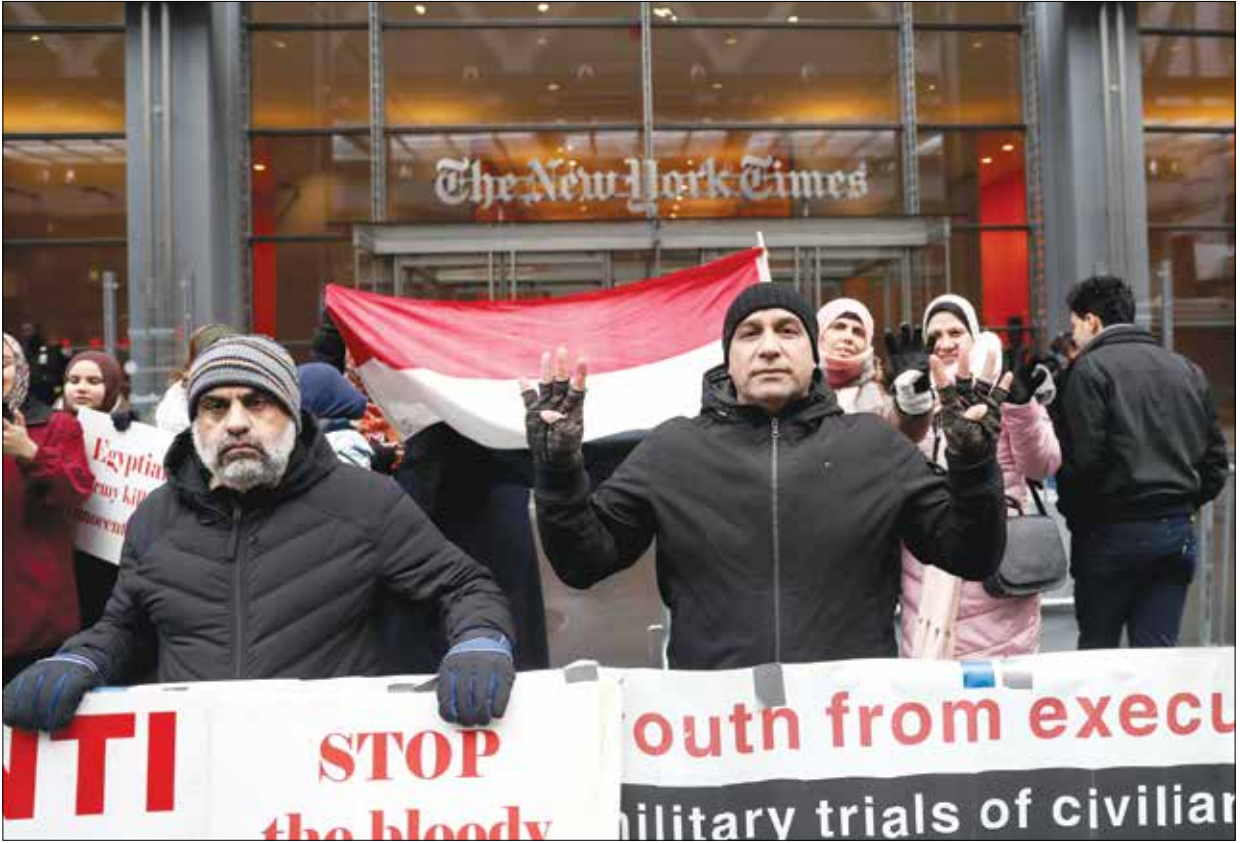
مصاروحت مصروئت في نيويورك الأمريكية، مارس 2019 (الأسود)

من الأسباب التي ساقتهها تقارير الداخلية وتعقيد وصعوبة إجراءات استعادة وترحيل المطلوبين من الدول الأخرى، والتكاليف الباهظة التي تنفق لتأمينهم داخل مصر عند نقلهم خلال مرحتي التحقيق والمحكمة وحتى في السجون الحدود. وتتضمن الرؤية عدم اتباع تلك الإجراءات مع المعارضين غير المطلوبين أو غير الصادر ضدهم أحكام جنائية غيابية، وأيضاً عدم التوسع في المطالبة بعودة المتهمين والمحكومين، فضلاً عن اتباع أولوية معينة تفرضاها مقتضيات التحقيقات فقط.