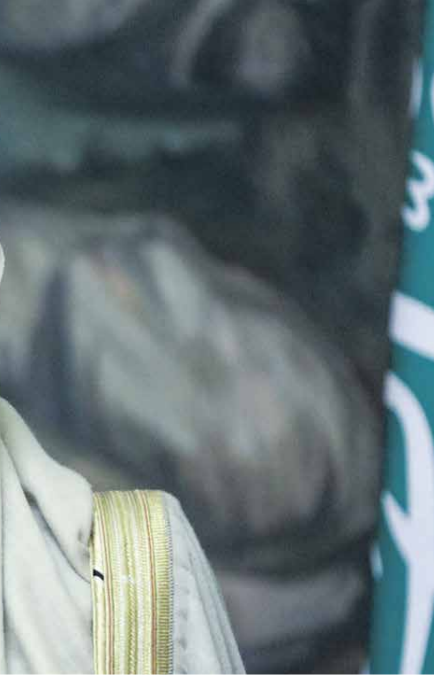
اعترى بن فرحان أن تحركات إيران ضد احد الزعماء المبعي (الناوثل)

ولا يتعلق الأمر بمبادرة أممية أو تقصص لدور المبعوث مارتن غريفيث، بل يمكن إقول إنه الوقت المناسب لاكتشاف قيمة البشر لدى أطراف النزاع، وإطلاق المبادرات الإيجابية. بالتالي سيكون من المناسب أن تقوم السعودية بعكس ما فعلته في اليمن، من خلال إطلاق مبادرة إيجابية، مثل مليون دولار، التي رصدهت 200 مليون لقتل القيادي الحوثي زكريا الشامي، لصالح مواجهة كورنوا في اليمن، وأن تقوم إيران بتهريب ضخمة أجهزة تنفس صناعي عتيقة المدى بدلاً عن صواريخ «قدس 2» وذو القلار».