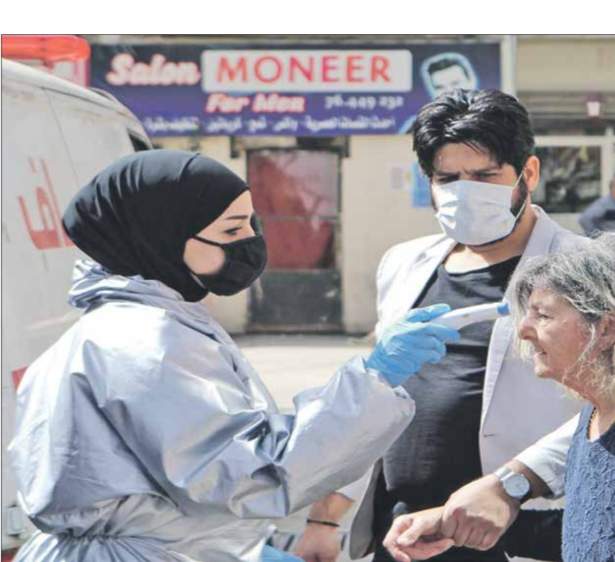
لا يجد بعض اللاجئين جوده من الحصول على اللقاح

يُقبل الاجتئون في لبنان، بشكك ضعيف، على التسجيل لأخذ اللقاح المضاد لكورونا، بسبب أزمة الثقة مع منظمات الأمم المتحدة والدولة اللبنانية