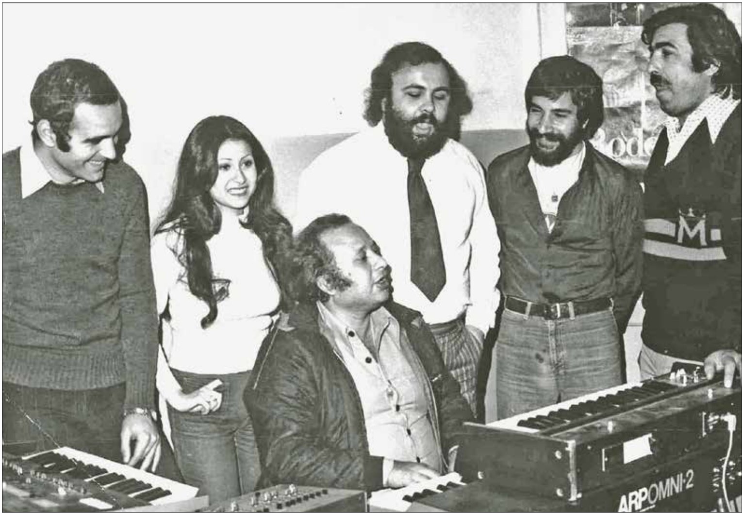
لُفِّم الدورة الموسيقية هاتمة السورة (ديفيد)

يقدم العرض نجوم بطريقة مختلفة، فهم يخلطون أنفسهم باسمائهم الواقعية. لكن ضمن حبكة تدين تعقيد علاقتهم مع المنتجين والمخرّجين والعاملين في صناعة السينما، وهي قالب كوميدي، يعالج المسلسل قضايا راسمة تتعلق بالتمييز والتعصّب ضد النساء والأقليات، كذلك، يظهر تصلب هذه الصناعة أحياناً في تعاطيها مع الممثلين، وتجاهل عواطفهم ومخاوفهم وعبّاتهم الإنسانية. ومن خلال هذا المنظور، يضيف المسلسل على هؤلاء النجوم طبيعة محببة تقرّبهم من قلب المشاهد، فهم يهاجون تعقيدات الحياة كما غيرهم، وإن اختلف شكلها. ومن المشاهير الذين شاركوا في الشّرح الأخير، شارلوت غينسبورغ، التي شكّل حضورها حالة خاصة لمكانتها المهمة كمنجاة مكرسة، وشاركت الممثلة الأميركية، سيفورني ويفر، في حلقة مميزة حول التمييز ضد الممثلات الأكبر سنّاً، وفي هذه الحلقة، عالج المسلسل المنعطف الدرامي الذي يتحدّث للرجال الأكبر سنّاً، فنرى ظهورهم في علاقات مع نساء يصغرنهم بسنوات متسرّداً، بينما يتدرّ تقديم العكس أرامياً.