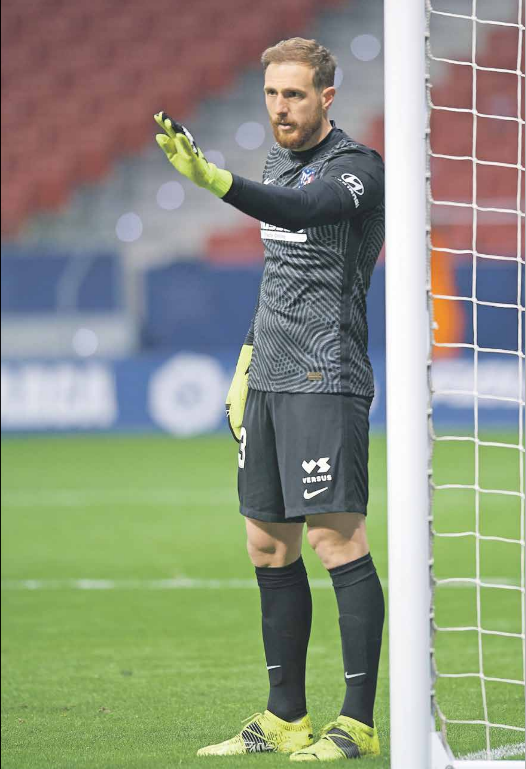
يان اوبلاك يقدم عرضا فديه مع مرمرى التركي

بعد 28 لقاء حتى الآن، وساهم الحارس تير شتيغن في التصدي لفرص خطيرة من المنافسين في «الليغا». وتعرض مرمى الحارس الألماني مارك تير شتيغن، لـ91 تسديدة في جميع المباريات في بطولة الدوري، وتصدى لـ71 تسديدة وفرصة في جميع المباريات، وخرج الحارس الألماني شباك نظيفة في 9 مباريات في 22 لقاء نجبه حتى الآن في الدوري. وساهم تير