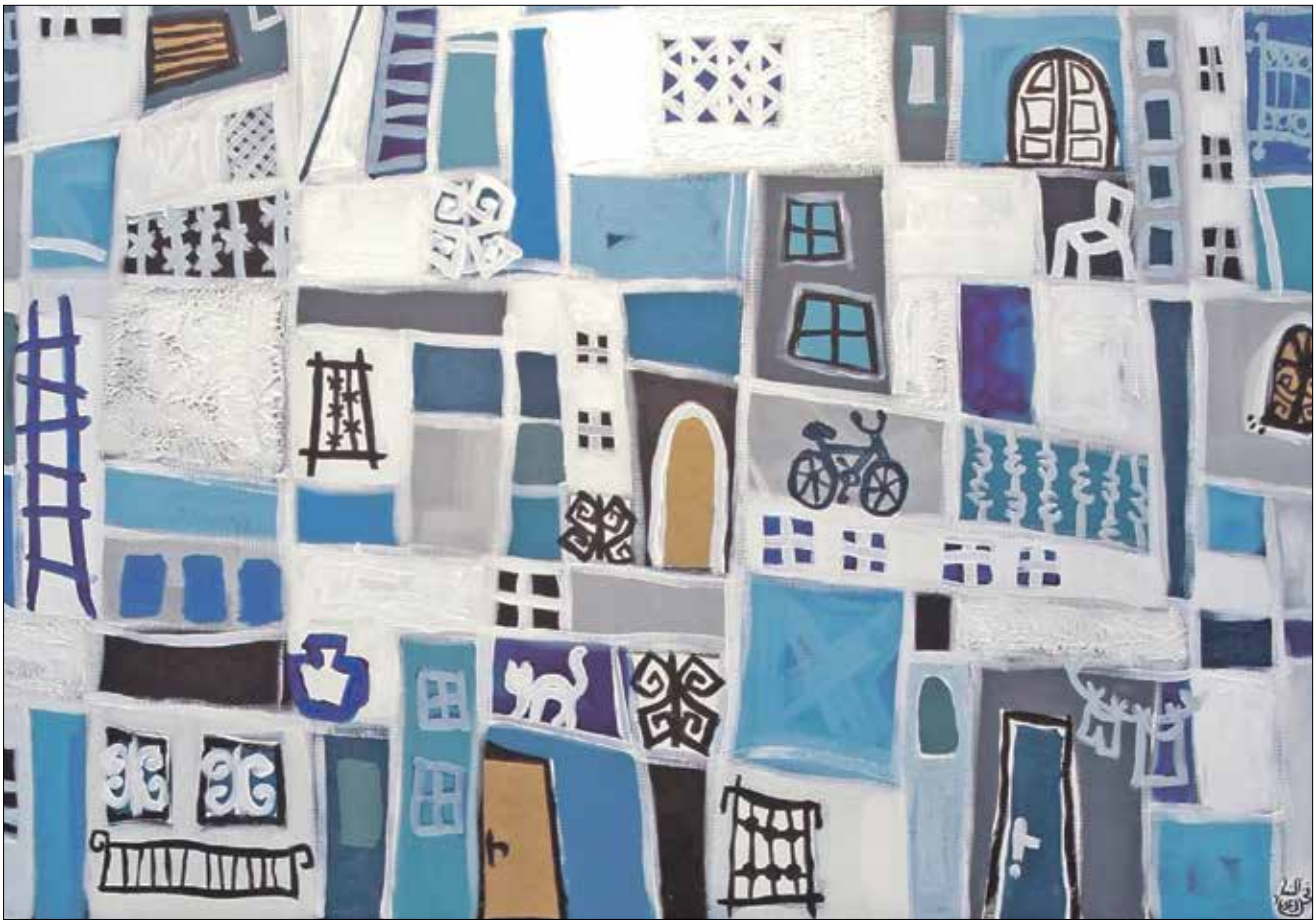
لوحة فخر النساء بعد، مواد مختلفة على مفاتيح

اعتبر المفكّر العربي، في محاضراته التي افتتح بها «مؤتمر العلوم الاجتماعية والإنسانية» الذي يقام عن بعد حتى بعد غد الخميس بتنظيم «المركز العربي»، أن