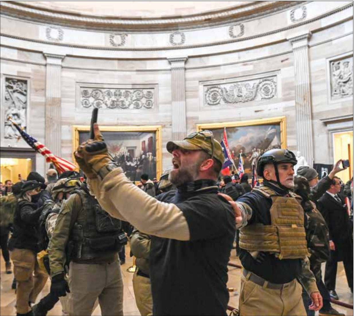
جبهة المعتاد مسبقا للاقتحام الكونغرس بحسب الأدلة

فير بلوغ» في 20 يناير الماضي، فإن «ذهاب الوزارة لإدانة مشاعي يناير 2021 بالعمل على إحداث فتنة، أو توجيهه أي تهمة سياسية أخرى إليهم، سيثبت بالرسالة الأوقى حول خطورة التصرف الذي وقع»، وبالعلم، فقد أكد المدعي العام بالوكالة عن مقاطعة كولومبيا (منطقة واشنطن) مايكل شيربون، في مقابلة لبرنامج 60 دقيقة: «إنه قناعة مسبقة في أس»، ويثُت أول من أسس الأحد، أن «الأدلة بلغت العتبة التي تسمح بإدانة بعض المتهمين بالتحريض على الفتنة»، وعمل «التامر لإحداث فتنة» جريمة بموجب القانون الأميركي. ويقول البند 2384 من القانون رقم 18، إن الأشخاص الذين يتآمرون لمعاوضة السلطات الفيدرالية أو يستخدمون القوة لعرقلة أو منع أو تأخير تنفيذ قانون لولايات التحريض، أو يستخدمون القوة لاحتلال أو السيطرة على أي مقر ملك