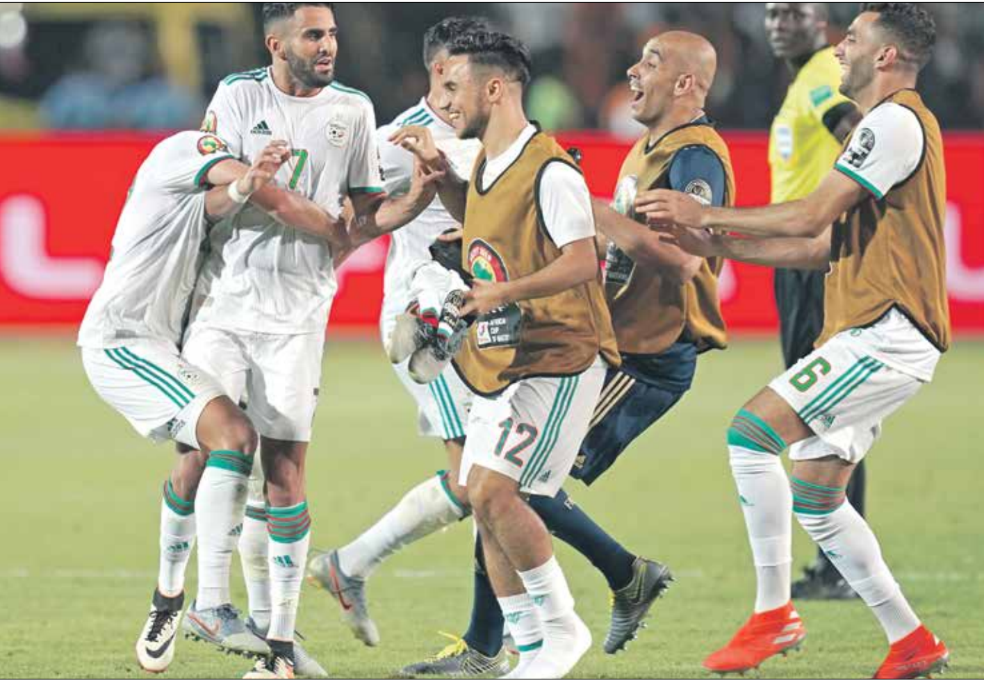
محرز انضم لقائمة بلماضي

لهم بالرحيل، لدى حوالي عشرة لاعبين يمكن اختيارهم، بعداً ثمانية كاساسنا، لا يمكننا الاستغناء عن ذلك في مبارياتنا الأخيرة من التصفيات، من بعض نجومه