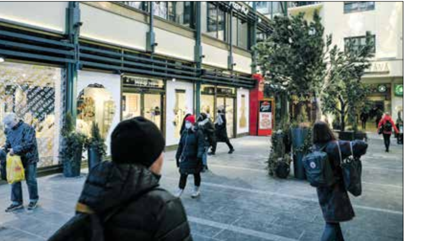
مشاة في وسط العاصمة الفنلندية هلسنكي

خلالما القول، هناك شكوك كثيرة حول حجم قدرة نتيناهو، الذي فاحت راحة فساده المالي في أروقة الحاكم، على تمكين الاقتصاد الإسرائيلي من الوقوف على قدميه دون الحاجة إلى المساعدات الأميركية السخية.