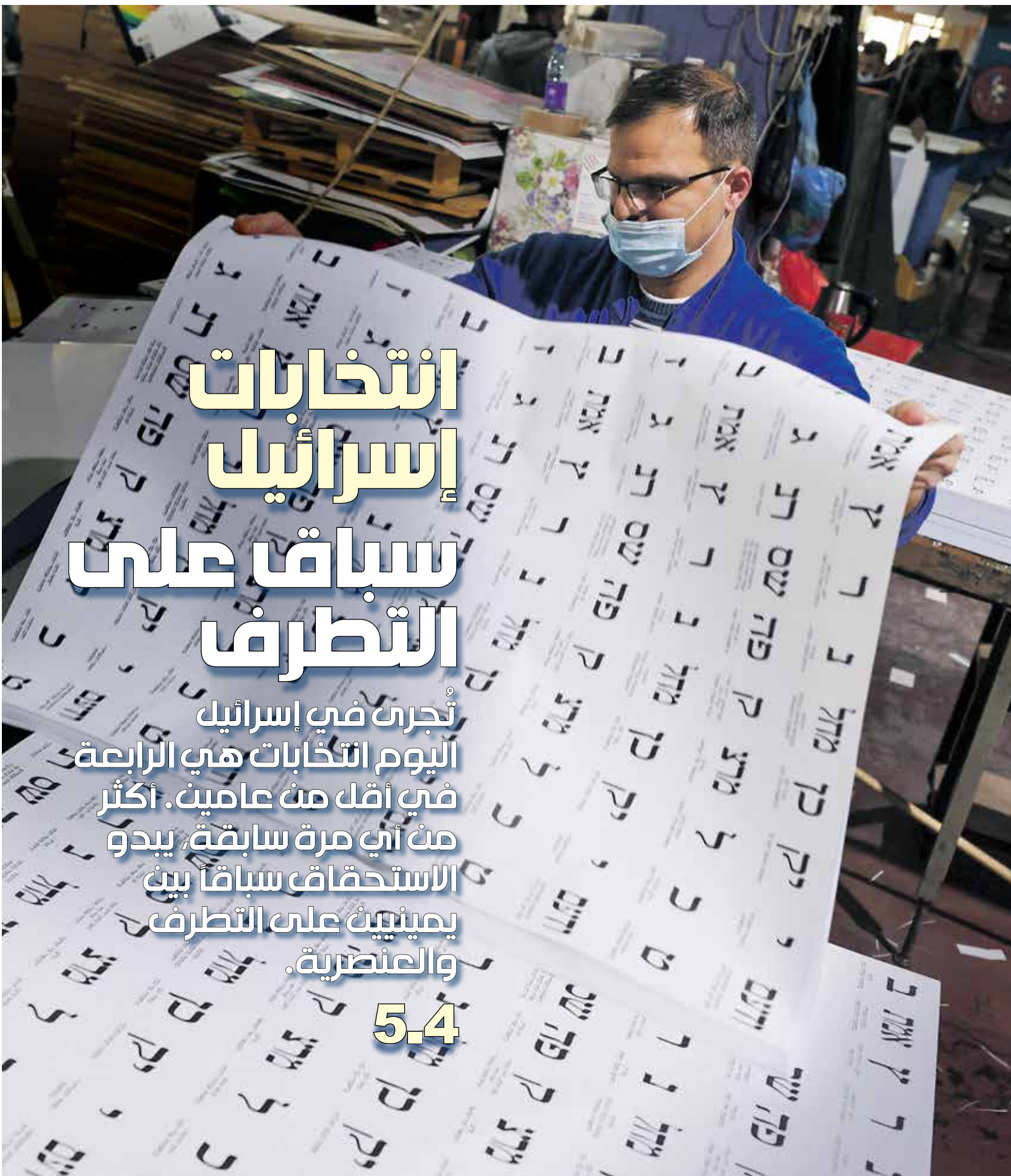
يطبع النواحي الانتخابية داخل مستوطنة في الضفة الغربية المحتلة