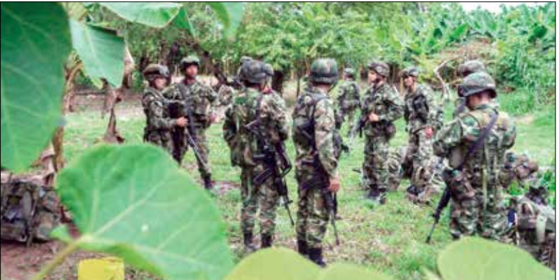
جنود كولومبيين على الحدود مع فنزويلا في ربيع 2017

لا يزال التحقيق جارياً في دور ترامب بأحداث الكابيتول