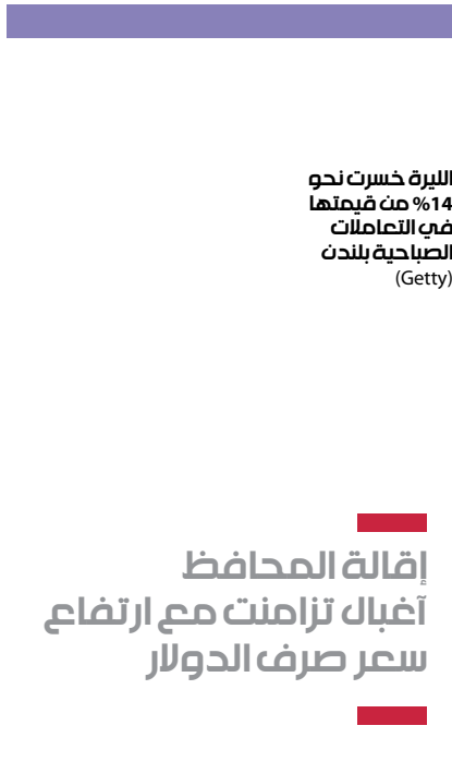
الليرة خسرت نحو 14% من قيمتها مع التضخم الصباحية ببلدته

المستثمرين الأجانب، وأن ذلك سيؤدي لتفائياً إلى وضع الليرة تحت ضغوط جديدة». وفي ذات الصدد، يرى مصرف «غولدمان ساكس» الاستثماري الأميركي، في تحليل «إن التخلي عن السياسة النقدية المتشددة تواجه على المدى القصير مخاطر ضعف