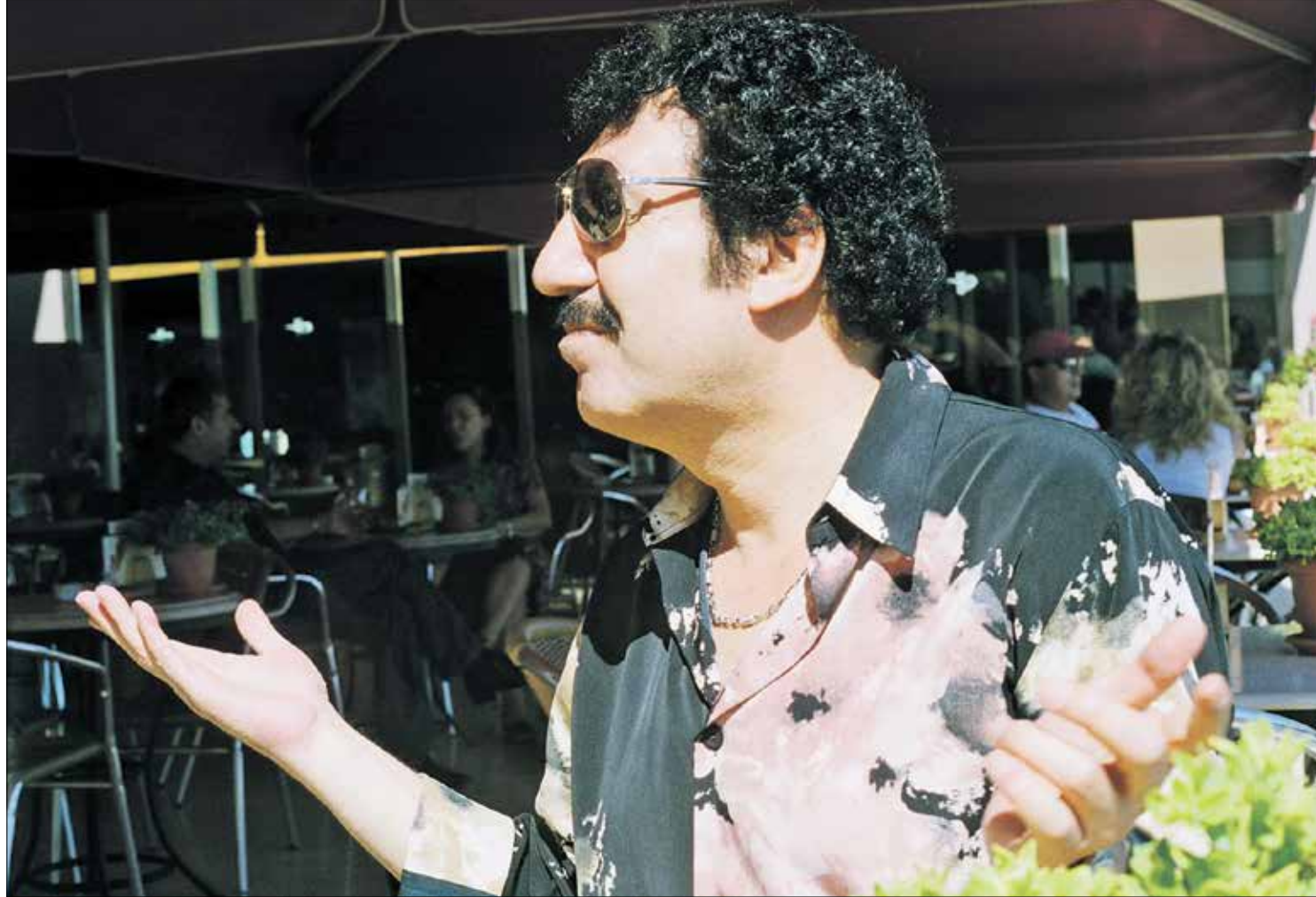
«مسلم بابا» عام 2007

مزج المغني التركي مسلم جورسيس، الموسيقى التركية بالكردية والعربية، وأضف عليها مسحة الحزن والشقاء اللذين عاشهما، فاستحق بجدارته لقب «مسلم بابا»، كما استحق تأسيس متحف باسمه