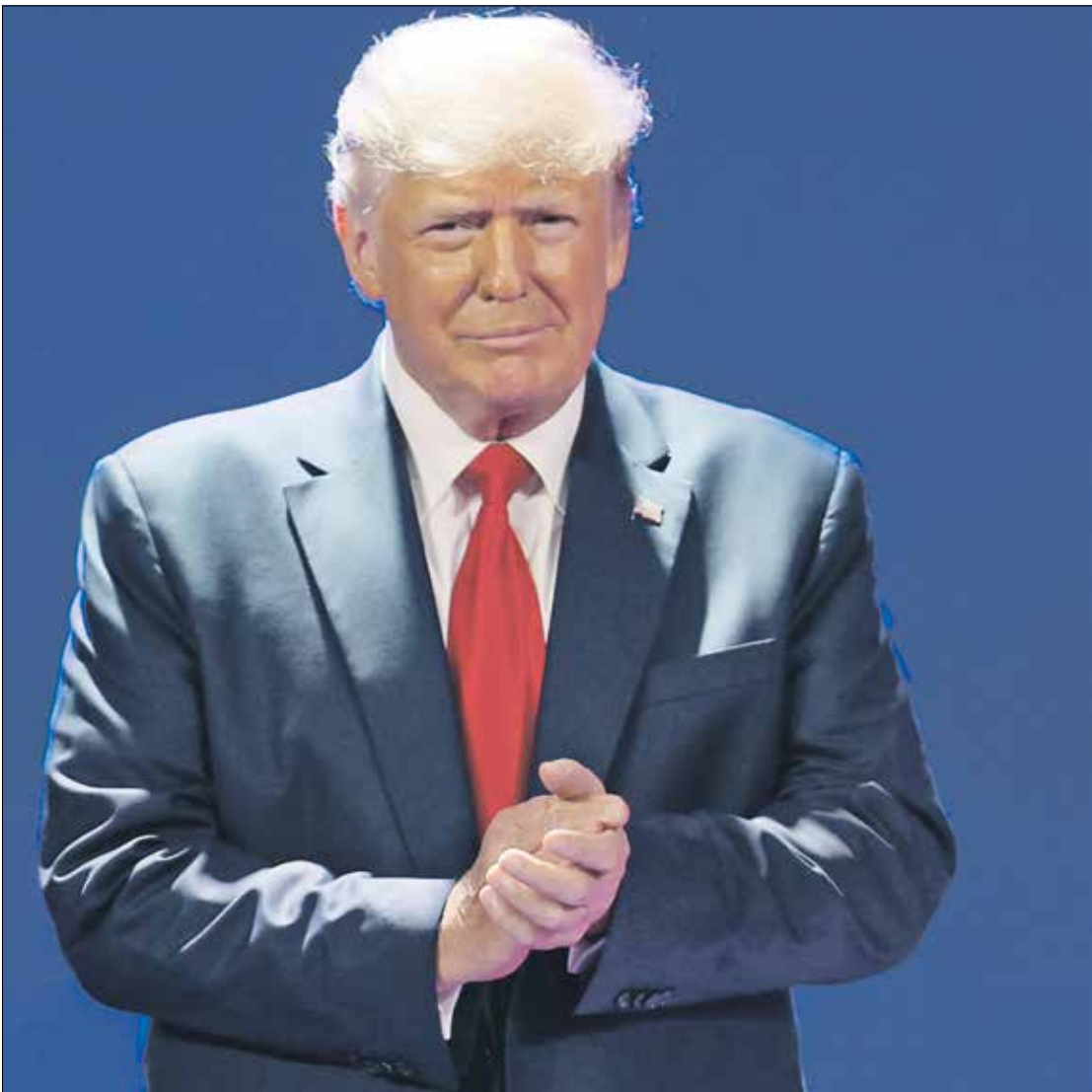
يشتم لرابص شبكة اجتماعية بدلا من حالته الخاصة