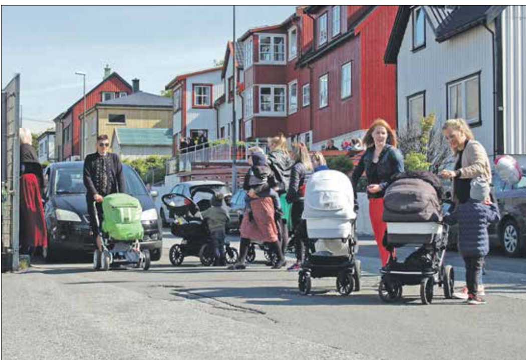
لم تتعرّض الصادات في جزر الفارو هزبة جياشاس/ فرانس برس)

تعتبر جزر فارو، في المحيط الأطلسي، التي تتبع تاريخياً وسياسياً الدنمارك على الرغم من تمتعها بحكم ذاتي وعلم وطني، المكان الأقل تضرراً من جائحة كورونا، في الفارة اللوروية