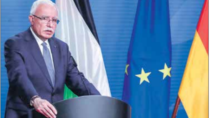
نرض المالكي بظرفات صف عودته الى فلسطين

ربطت إسرائيل بين القرار الذي اتخذته أول أمس، الأحد، ضد وزير الخارجية الفلسطيني رياض المالكي والقاضي بسحب بطاقة «عمور كبار الشخصيات» منه، التي تمنحها لخباز مسؤولي السلطة الفلسطينية والمتعلقة بحرية الحركة والتنقل، وبين تحركاته في ما يتعلق بالحكمة الجنائية الدولية. ونقل موقع «إيلاف» عن مسؤول إسرائيلي كبير قوله إن العقوبات ضد المالكي والتي تقيد حرية حركته، جاءت في أعقاب قيامته التحركات الفلسطينية أمام المحكمة الجنائية الدولية، والتي أفضت إلى صدور قرار عن المدعية العامة للمحكمة قاتو بنسودا بالانبوع في التحقيق مع إسرائيل بتهمة ارتكاب جرائم حرب في الضفة الغربية المحتلة، وطاع غزة، مشيراً إلى أن هذه الإجراءات سنؤدي في تهديد أمن مسؤولين كبار في إسرائيل وتفيد تحريكهم في المقابل، دان رئيس الوزراء الفلسطيني محمد اشتية، أمس الإثنين، الخطوة الإسرائيلية من جهته، أكد المالكي في تصريحات لإذاعة «صوت فلسطين» الرسمية، أن الاحتلال أبلغ طواقم وزارة الخارجية على الحدود الأردنية الفلسطينية بعد التحقيق معهم، بأن التعامل مع المحكمة الجنائية الدولية خط أحمر، وسيتم تنفيذ عقوبات في حال استمرار الوزارة في التنسيق مع الجنائية الدولية.