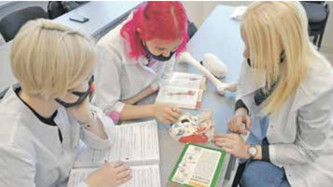
بالخصص لعمال في مجال العلوم الطبية

يشير تحليل صدر عن الأكاديميات الوطنية للعلوم، الهندسة والطب، في الولايات المتحدة، إلى أن الجامعات تحاول أن تساعد النساء العاملات المتخيرات المهني في العمل من خلال توفير إجازات الوالدين، على تحضرن بشكل أكبر من زملائهن الرجال بسبب جائحة كورونا، على متابعة عمليهن من دون أي تأخير، لكنها لم تجد بعد الفجوة الصحية للقيام بذلك، التقييم الذي صدر على شكل 250 صفحة، والذي يلخص نتائج عام من البحث من قبل لجنة مختصة، توصل إلى أن أزمة وباء كورونا، أدت إلى تراجع محاولات تعزيز النموذج الجندري والعرفي في مجال العلوم النظرية. «تساعد على تعزيز الفوارق الأساسية الجينية على الجندر، والتي تكون تعزز المساواة بين الجميع كما هو ملن».