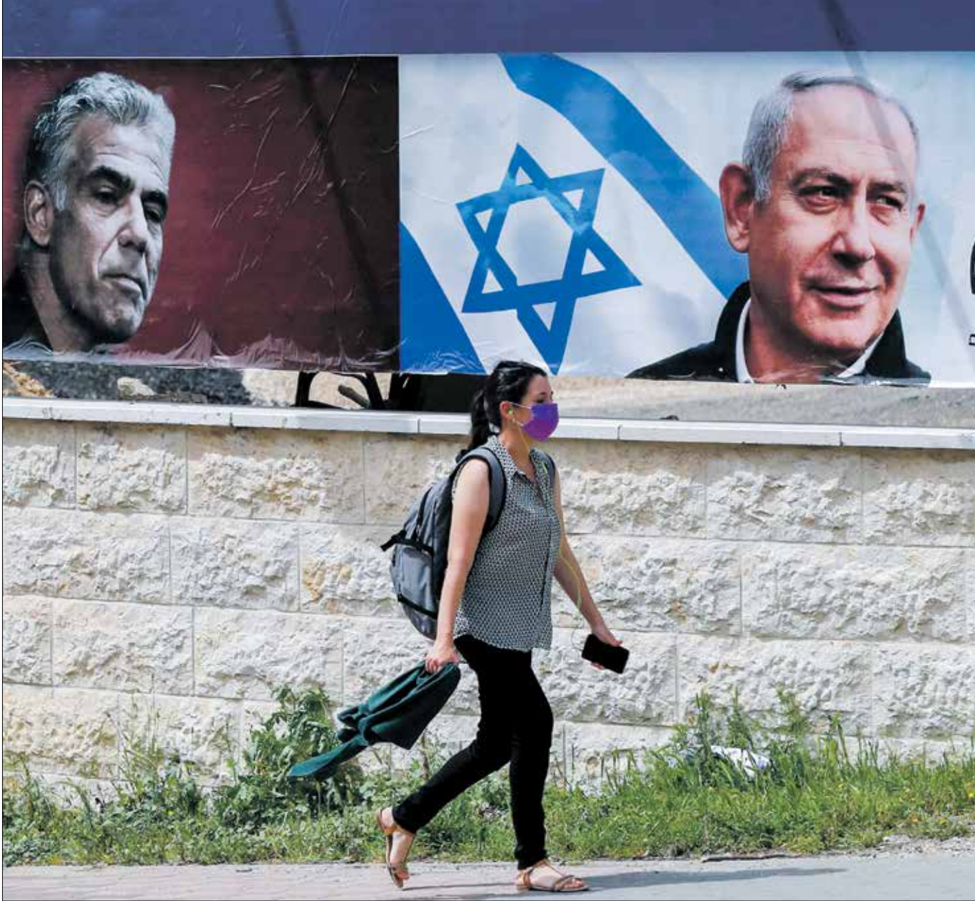
يلوغ خصوم نتنياهو من استفادته من ادارته أزمة كورونا

في المقابل، ردت رئاسة الجمهورية على كلام الحريري، مشيرة في بيان تلاه مستشار الرئيس، أنطوان قسطنطين، إلى أن عون لم يطبل الثلث المعطل، بل قدم ورقة للحريري خالية من الأسماء على أن يناقشها معاً. مقابل الليبرية، ولا توجد لدى رئيس الوزراء القائمة أن الورقة المنهجية يعرفها الحريري جيداً، وهو سبق أن شكّل حكومتين على أساسها في عهد عون. واعتبرت أنه هذه المرة، اختلف السوابق، إذ كان يعتقد بكل الفرصيات حتى حين إيف لورديان، أمس، قبل اجتماع لوزراء خارجية الاتحاد الأوروبي، قال فيه: إن «الخان على وشك الانتهاء» (الجهة التي اختارت الاسم) وأبدت خشيتنا من وجود حنية مسيئة بعدم تشكيل حكومة لاسباب غير مرفوعة ولا تمكّن من شأنها». وفور الإعلان عن فشل لقاء عون، الحريري، والقلق والخوف».