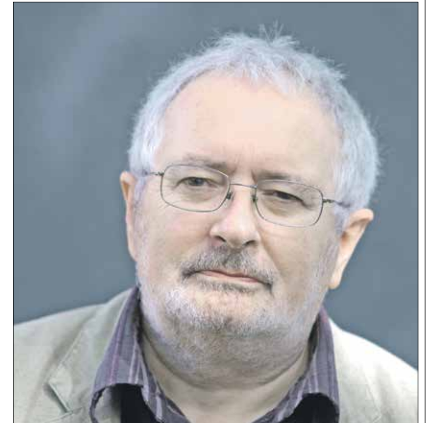
تيري إيغلون في معرض أدبيته الدولي بكتابه، 2007

في المقابل، تخلص دراسة حنة أرندت، «يخامن في القدس» تقرير حول ثقافتها