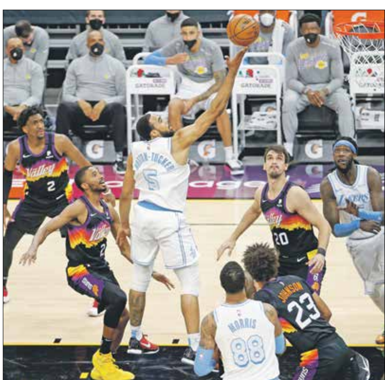
ليكرز تعرض لخسارة جديدة في بطولة الدورب

بسبب الإصابة، واثار الخطأ الذي تعرض له هاريس من لاعب نيكس جوليوس راندل موجه من الاعتراضات على الحكم، جيس «ستحاج لبعض الوقت لتعديل الأصور ومعرفة من أين تأتي التسديدات، وما ستكون عليه هويتنا الجديدة». في المقابل لم يتم الإفصاح عن موعد عودة «الملك» إلى الملاعب، صرح فوغل قبل المباراة انه لا يعتمد على التعافي السريع، وقال هذه الإصابات تحتاج إلى الوقت للتعافي، الإصابات مشكلة، واللاعب يتعافى ببطء. نتحضر لكي نكون من دونه إلى أجل غير مسمى».