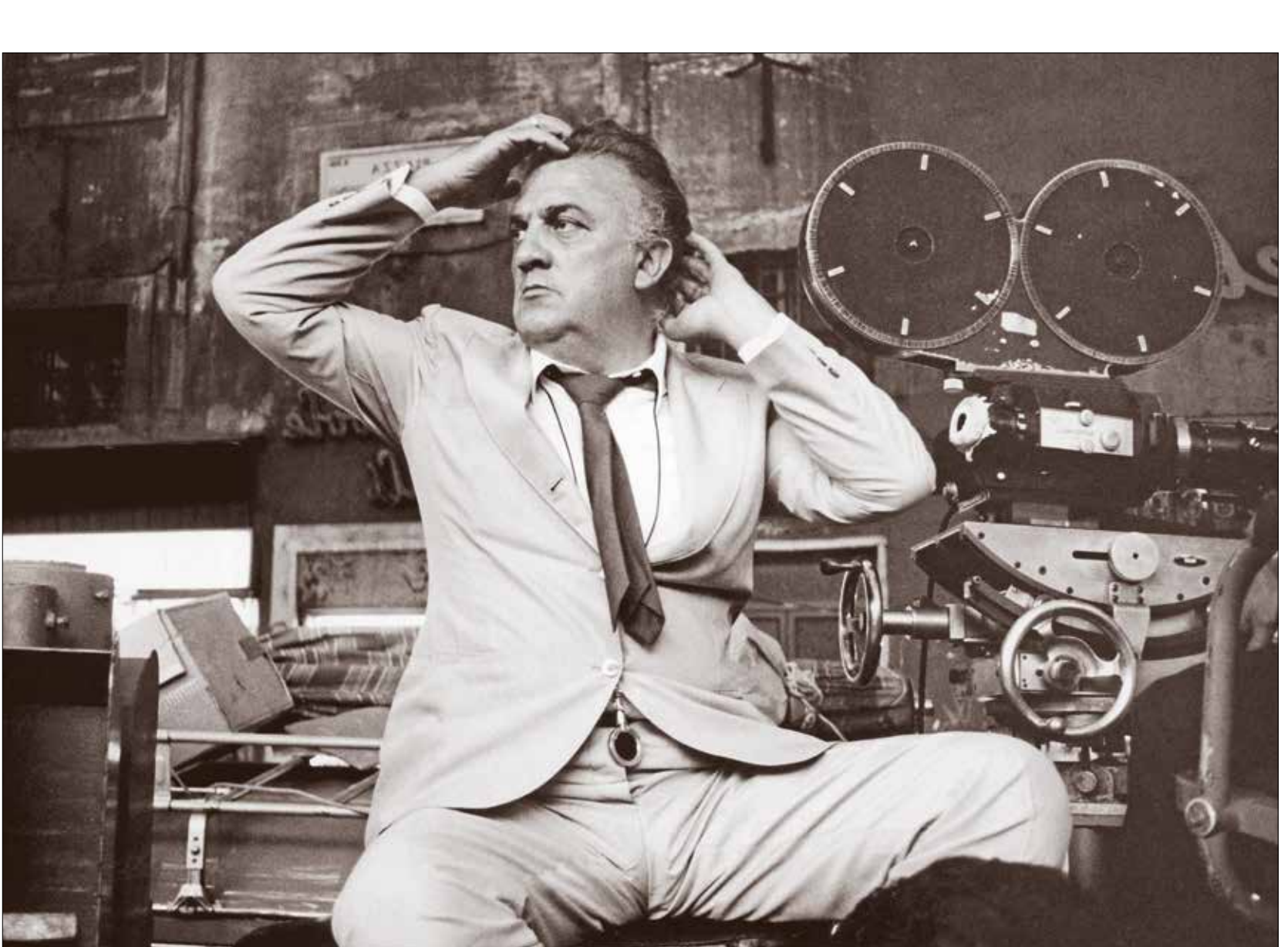
لُفِّم المخرجة تصورا حول الرهب التي سلّكت نظرة فيليني إلى عالم الماورائيات