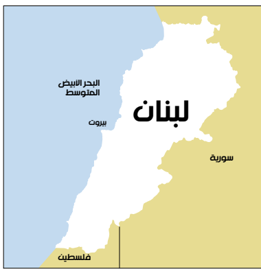
لبنان: خريطة لبنان التي تظهر الحدود مع سوريا وفلسطين.