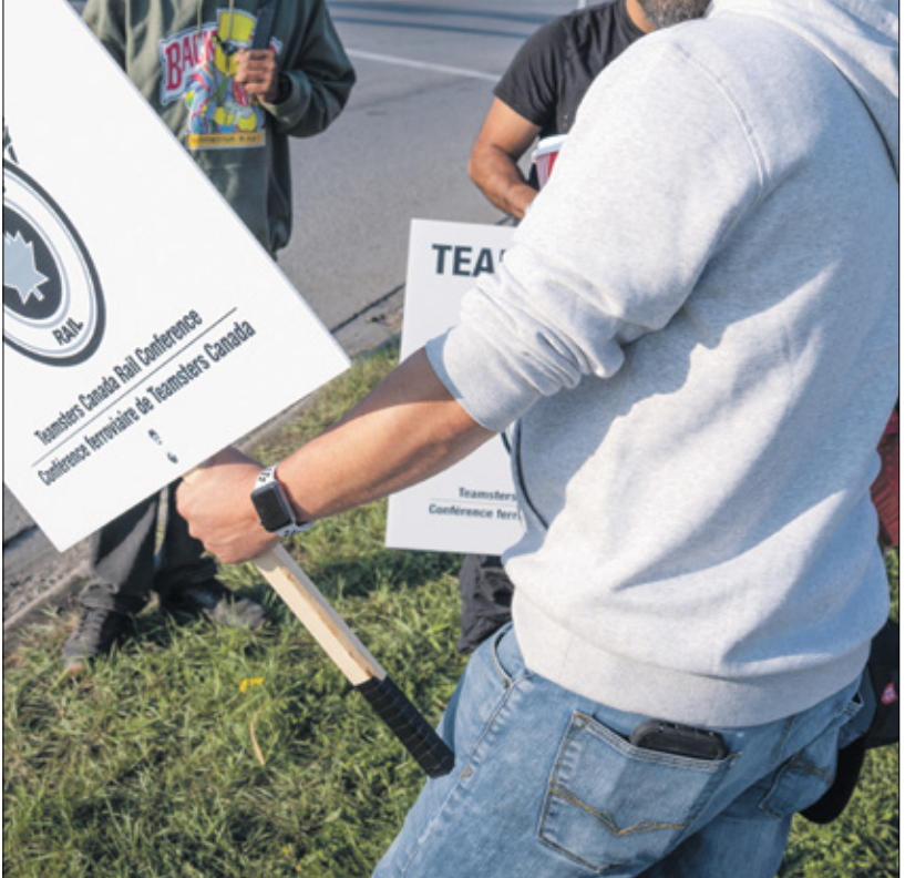
إضراب عمال محطة لخدمة لائحة شركة سكك الحديد الوطنية الكندية

السياسة الخارجية، لكنه يقول إن الهيمنة المستمرة تشكل تحديات محلية ودولية بالنسبة إلى الدولار، الأميركية، كذلك فإن استخدامه في العقوبات يبلّغ الدول على