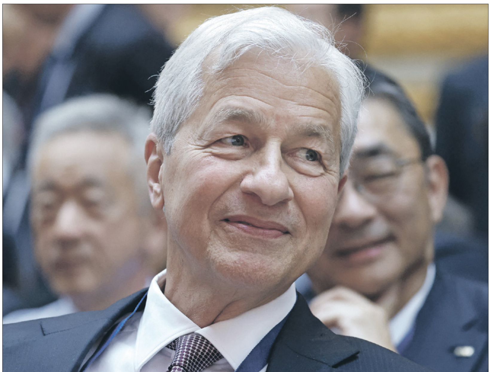
جيهاب ديمون (Getty)

من حق البنك المركزي أن ينظم أداء القطاع المصرفي باعتباره الرقيب عليه، ومن واجب البنوك الالتزام بكل ما يصدر عن صانع السياسة النقدية، ومن حقها أيضاً ترتيب إجراءات سحب البنكنوت المحلي والأجنبي، هذا هو العرف عالمياً. لكن من حقنا أن نسأل: هل الوقت مناسب لإصدار مثل هذه القرارات التي تثير قلق المتعاملين مع البنوك أكثر مما تطمئنهم؟ وإذا كان البنك المركزي يريد ابتعاده عن تلك القضية بالغة الحساسية، فلم أحم نفسه من البداية ولم يترك الأمر للبنوك لتحديد السياسات المتوافقة مع إدارتها للأموال التي بحوزتها؟