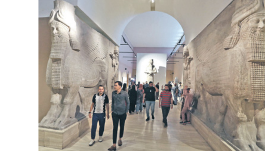
مداخل متحف بتجار، 27 سبتمبر 2022

تسببت بيانات متضاربة بين البنك المركزي المصري وقيادات بنوك كبرى في وضع حدود قصوى على السحب النقدي بالمعاملات الأجنبية في تذبذب أداء الجنيه أمام العملات الصعبة، أدت إلى ارتفاع تظريف يسعر صرف الدولار بمقتوسط خمسة قروش، ليلجأ نحو 48.81 جنهيا مقابل الجنيه، بعد عدة أيام شهدت تراجع الدولار مقابل الجنيه في السوقين الرسمية والموازية. أخبر رؤساء بنوك وقيادات مصرفية وسائلي إعلام، مساء الأربعاء، بقرض البنك المركزي حدودا قصوى على السحب النقدي الأجنبي، وقد أحدثت تصريحات المسؤولين ارتباكاً في الأسواق، دفعت إدارة البنك المركزي إلى إصدار بيان زاد الأمر غموضاً، ينفيهِ إبرام البنوك وضع حدود قصوى على السحب النقدي من عملة مصر، في حين أعلن البنك المركزي، في تصريحات متعقبة بأنها ستستكون «مرحة جدا للأفراد والشركات». في سوق تشتعلها شائخة، وتعيش أجواء جيوسياسية واقتصادية متوترة. أحدثت تصريحات رئيس اتحاد البنوك ارتباكاً في سوق المعاملات المالية، أدت إلى رفع أسعار صرف الدولار في السوق الموازية، مع توقف الذهب، بنحو 40 قرشاً عن السوق الرسمية، في وقت يتعرض فيه الدولار إلى هبوط حاد مقابل باقي العملات الرئيسية الأجنبية متروك لكل بنك على حدة، وفقا للسياح المعتمدين من مجلس إدارته، كما شدّد بيان البنك المركزي، الذي وزع في ساعة متأخرة مساء الأربعاء، على