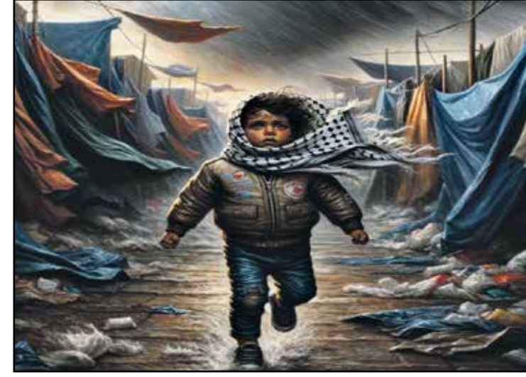
الطفولة المسروقة بين الخيم

شعروا بانها فرصتهم الثمينة التي لا ينبغي لها ان تنسب من ايديهم، خصوصاً وأن اعنى الجزائريين منهم ما كان يتوقع ان تترشح هذه البقرة، وتصيح على وشك «السقوط» وسرعان ما تداعوا بفرح مزروج بالهلع، فقد كانوا غير متيقنين من صدق ما يصلهم من جواسيسهم عن «حتمية» سقوط البقرة بعد ان نزلت كل هذه الشلالات من الدماء، بفعل ما تلقته من طعنات، لكنهم حاولوا إخفاء رعبهم من البقرة، والظهور بظهور الواثق من نفسه، ومن صدق تنبؤاته، فاستلوا ساكناتهم، بعد ان سنوها جيداً، ونهضوا ليتحققوا حول البقرة الجريجة بانتظار سقوطها. ربما وصلوا، غير ان وصولهم لم يكن يعني الكثير، لأنهم كانوا يتحاشون النظر إلى عيون البقرة، التي يعرفونها جيداً، ويعرفون مبلغ حدتها، فاتروا أن يخضوا اعينهم بانتظار من يخبرهم عن سقوطها، ليباشروا أعمال ساكنتهم في بدنها، واقتطاع اجزائها المفصلة عندهم، خصوصاً تلك «الغدة» التي ازقتها طويلاً، والتي تدعى غدة «التمزق»، فقد كانت هذه البقرة مشاكسة، لا تخضع ولا تخنع، وتتمرد على الحظائر، ولا تقبل العيش بغير السهول المفتوحة، ولا تسمح لأي جزار بالاقتراب منها، ومن يقرب فمصييره «نطحة» معتبرة، تفقده الوعي او الحياة كلها. انتظر الجزائريون طويلاً، وبلغوا الشدوخة، بانتظار من يخبرهم عن «سقوط البقرة». اما في المشهد الأخير، فثمة من يتحدث عن رهط جزائرين ساقطين، وحولهم بقرة لن تسقط أبداً.