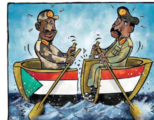
السودان مركب الانقسام والفرق