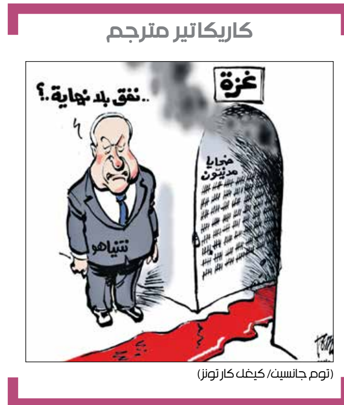
(نوم جاسين/ كيهل كار تونر)