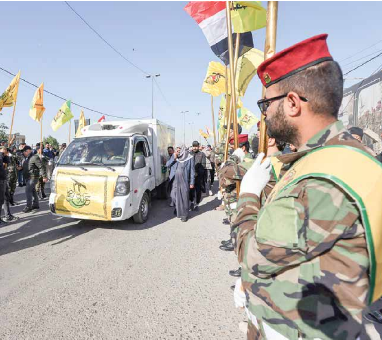
عناصر من كتائب «وزراء الله» خلال تشييع قتلى هجوم اميركي، ديسمبر الماضي (تحدث للبرية)

الدولي ومستشاريه الموجودين في العراق. وكان السوداني قد جدد، الخميس الماضي، دعوته لتفويض وجود التحالف الدولي في العراق، مؤكداً دعمي حكومته لترتيب جدول زمني بشأن ذلك. وأعلنت قتلى وجرحى، وأعلنت وزارة الدفاع الأميركية (البتاغون)، في بيان، أن «تفقدت قوات الجيش الأميركي ضربات ضرورية ومتناسبة على ثلاث منشآت تابعة لميليشيا كثاب حزب الله المدعومة من إيران وجماعات أخرى تابعة لإيران في العراق»، مبيناً أن «هذه الضربات الدقيقة رد مباشر على سلسلة من الهجمات الضخمة ضد جنود أميركيين ملمحة إلى أن واشنطن تريد عرقلة التحالف في العراق وسورية من قبل