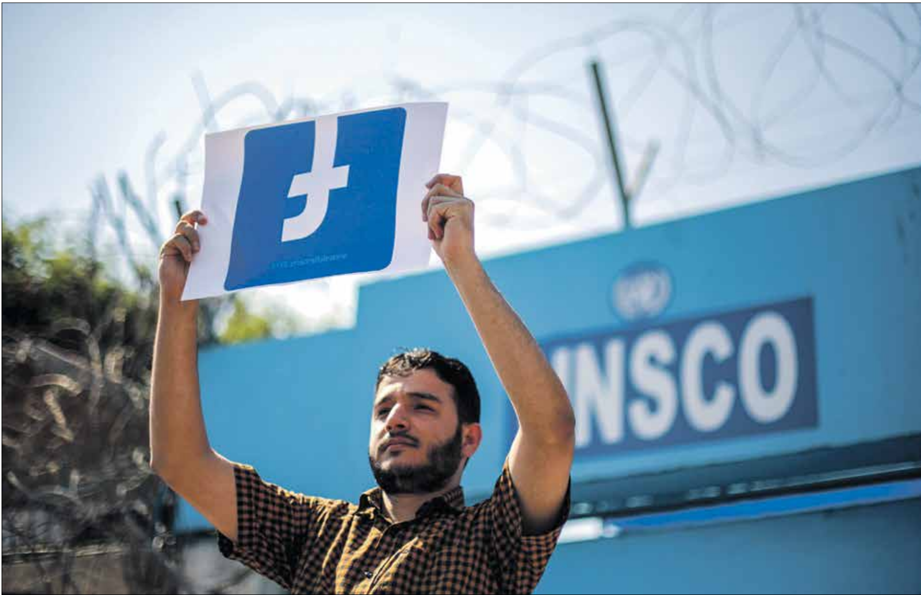
مظاهرة فلسطينية في غزة بحملة اللمة لتحياض ضدّ «ميسوبوت»، 29 تشرين الثاني/أكتوبر 2016