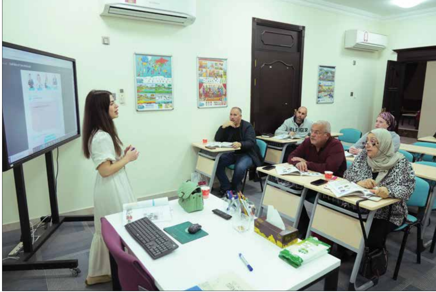
إقبال على تعلم اللغة التركية في مركز يونس إمره بالدوحة (حسين بيضون)

يعتبر المركز الثقافي «يونس إمره» واحدة تجمع الأتراك والعرب في فعاليات متنوعة من الفنون إلى الطعام، والتبادل اللغوي والثقافي، ويسعى لإنتاج حوار مشترك بين أفراد المجتمع التركي وأقرانهم العرب