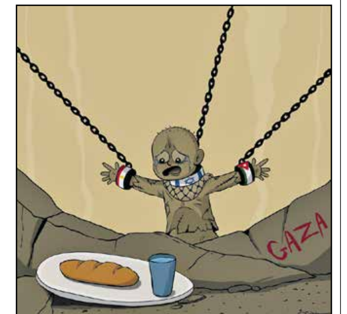
دولة عربية تشارك في حصار غزة