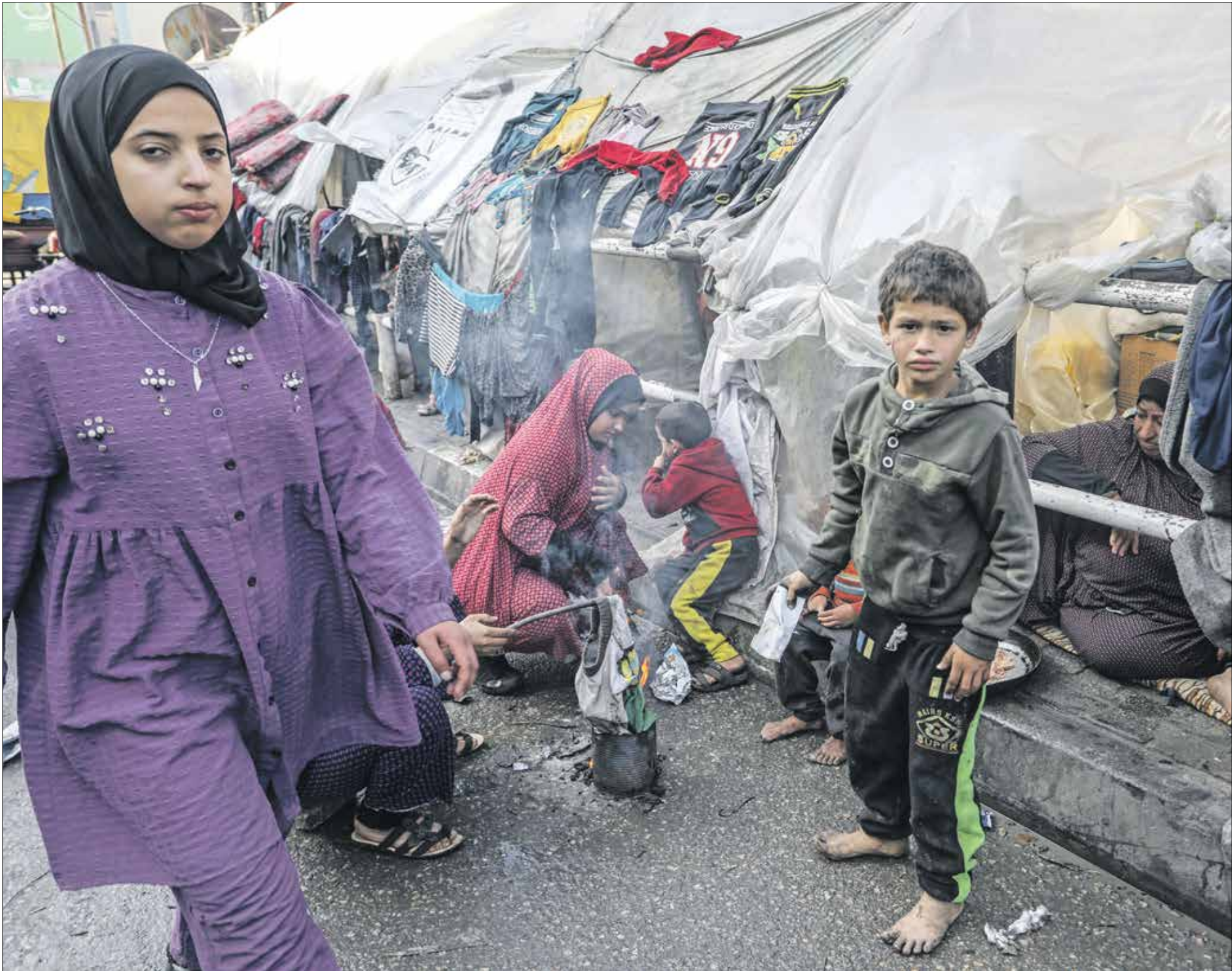
(تعد الأرحام الخطير، الأناضول)

غزة شراء الملابس المستعملة من المحلات التجارية القائمة في أكواخ النازيلون لحماية أنفسهم من البرد خلال أشهر الشتاء، لطرف اليومية القاسية التي يعيشها الغزيون منذ بدء العدوان الإسرائيلي على قطاع غزة في السابع من أكتوبر/ تشرين الأول الماضي، دعت الأهالي فضلاً عن غيرها من الأساسيات. (الناضول العربي الجديد)