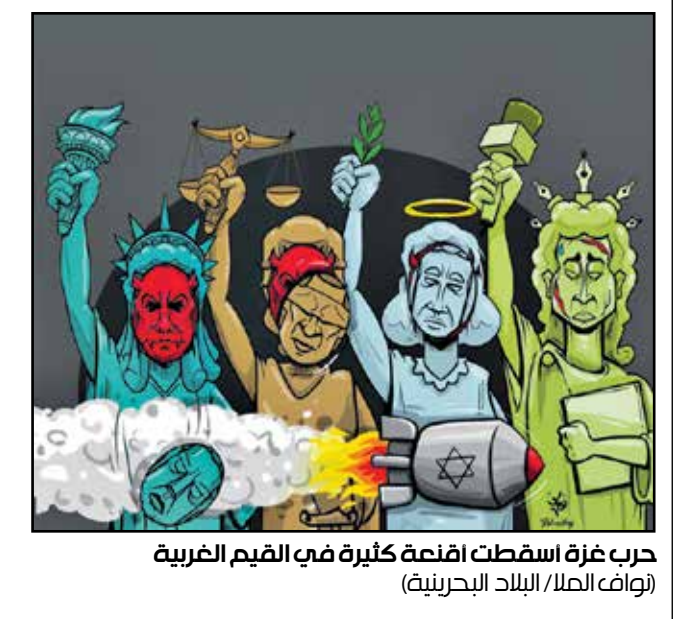
حرب غزة اسفطت اقنعة كثيرة في القيم الغربية