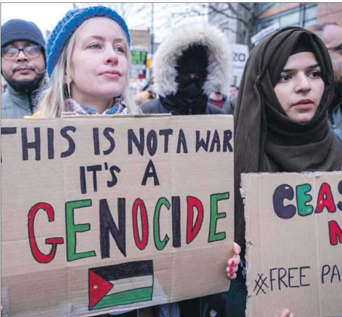
من مظاهرة في لندن لتجديا بالإبادة الجماعية في غزة، 20 كانون الثاني، يناير 2024