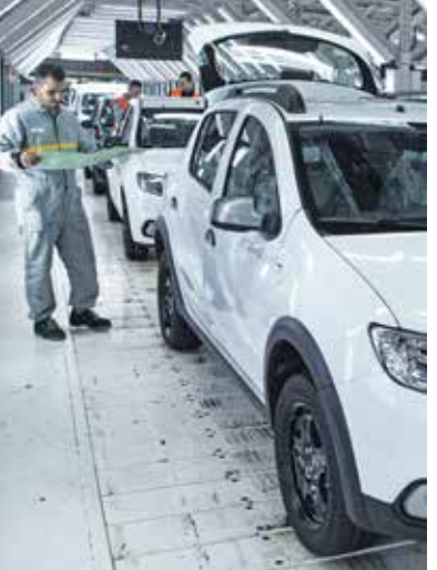
نمو صادرات السيارات

في المغرب، أي حوالي 343,6 ألف سيارة، تم تصديرها إلى أكثر من 68 بلدا أجنبيا. وأقام المغرب جزءاً من استراتيجيته الصناعية على استقطاب صناعة السيارات الفرنسية التي أتاح لها امتيازات كبيرة، حيث يستهدف ارتفاع الإنتاج إلى مليون سيارة، مما يساعد على بلوغ صادراته بقيمة 20 مليار دولار في المستقبل وذهب المنسوبية السوية للتخطيط، إلى الطلب الخارجي الموجه نحو قطاع صناعة السيارات في سطره المتعلق بالتركيب والأسلاك الكهربائية وقطاع الإلكترونيات والكهرباء، ويشير الاقتصادي علي ميبيعات إلى أن صادرات السيارات تدعم ميبيعات المغرب في الخارج، والمساهمة في التخفيف من توسع عجز الميزان التجاري، في ظل ارتفاع حجم التحويلات والواردات، وأضاف، في تصريحات لـ«العربي الجديد» أن المغرب تمكن في الأعوام الأخيرة من التوقيع في خريطة صناعة السيارات العالمية، وهو ما أتى بفعل تشكيل منظومة تتشخصر جميع مكونات السيارات التي تنتج في المملكة، فضلاً عن تصدير بعضها إلى أسواق خارجية وتسد على أن شركات صناعة السيارات تراهن على التصدير أكثر عبر المغرب.