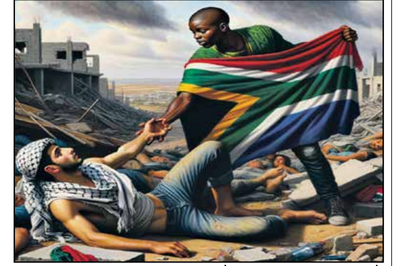
الشهر لوحات مالك فريقع في شكر جنوب أفريقيا