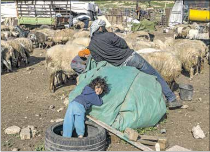
يلتمس المرأة الفلسطينية برضهم رغم المحاطر

يتابع دعيس: «ما حصل بعد المسار الأخير في النعش، وإن أردت أن أرعى غنمي لاحقاً، سأضطر إلى دفع 70 ألف شكيل، وإن استمر هذا الوضع ربما تضطر إلى إبقاء الأغنام في الحظائر، وفي ظل عدم وجود دعم من أية جهة رسمية، وترتكنا وحديدين في مواجهة المستوطنين، ربما تضطر إلى بيع الأغنام، إذ سنكبد خسائر كبيرة حينها. نحن رعاة أغنام في الأغوار، وإن متحنا من ذلك، فسنتضرر إلى إبقاء أغنامنا في الحظائر، وهذا غير ممكن، وبالتالي سنتضرر إلى بيعها، وسنرحل عن المنطقة».