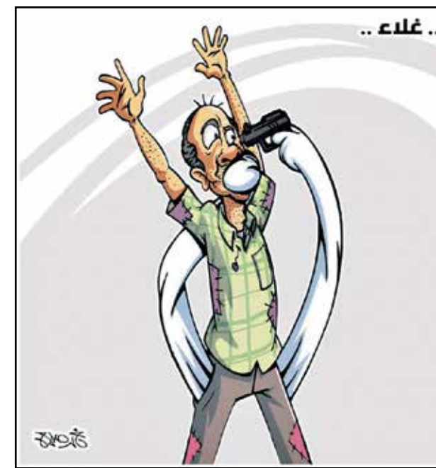
العلاء وجيوب المواطنين في مصر (خالد صلاح)