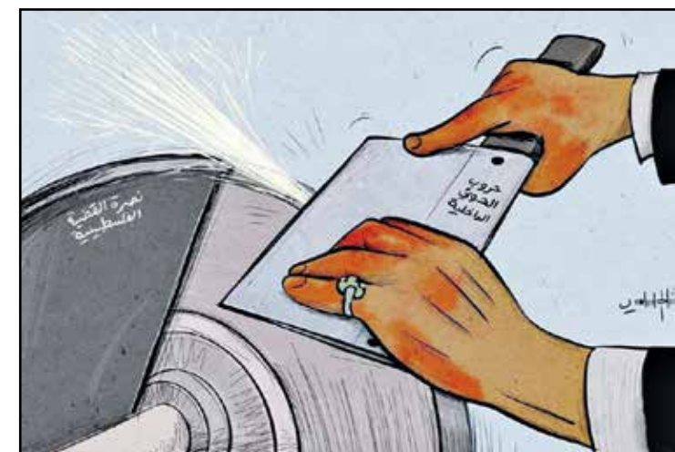
حروب للوطني داخليا، وتسويق نصرته لغزة خارجيا (اشاد السامعي)