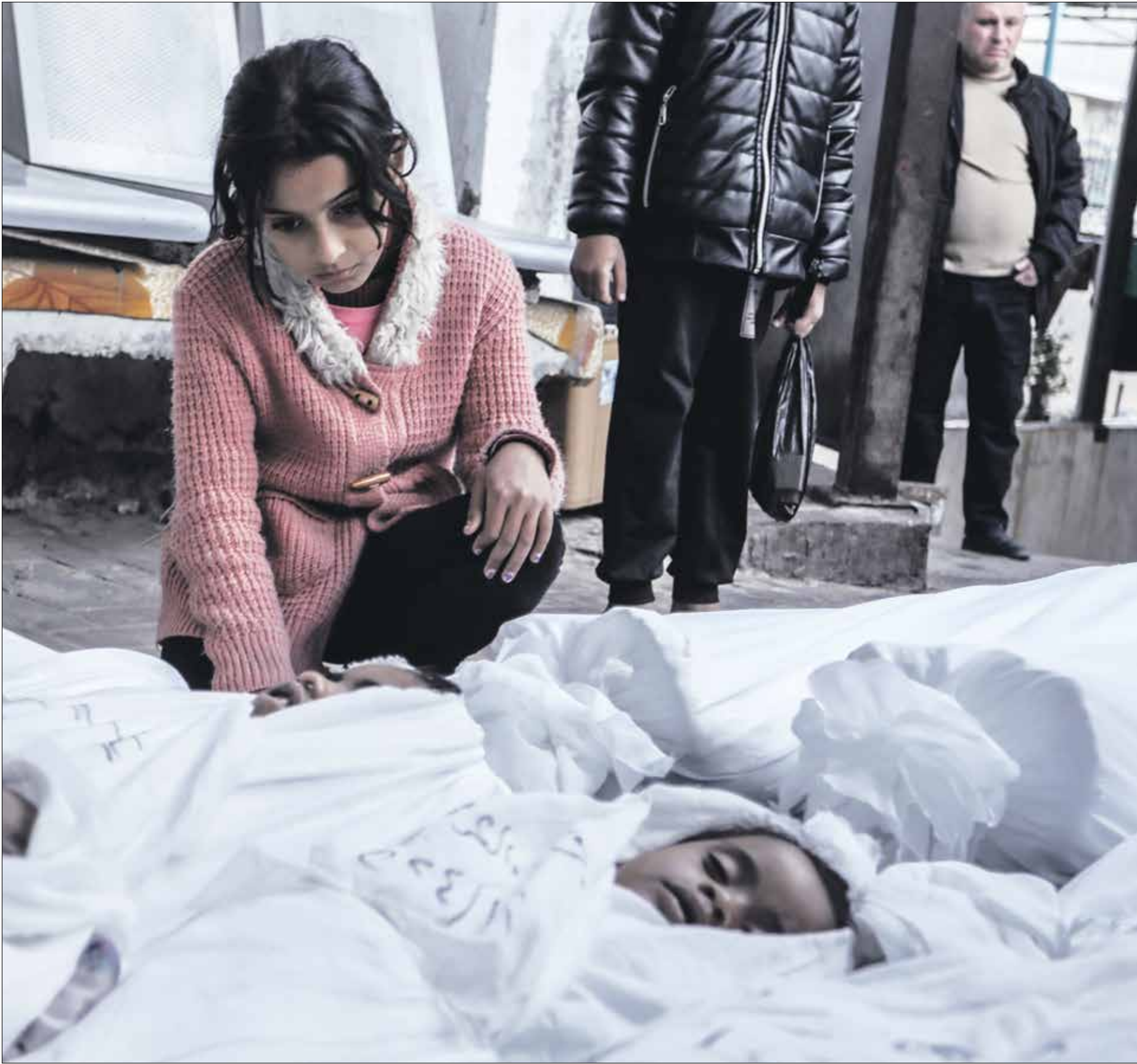
ليع احد منهم (بعد الرجم الخطير) (الناظر)

عدد شهداء قطاع غزة منذ بدء العدوان الإسرائيلي، حتى يوم أمس، غالبيتهم من النساء والأطفال.