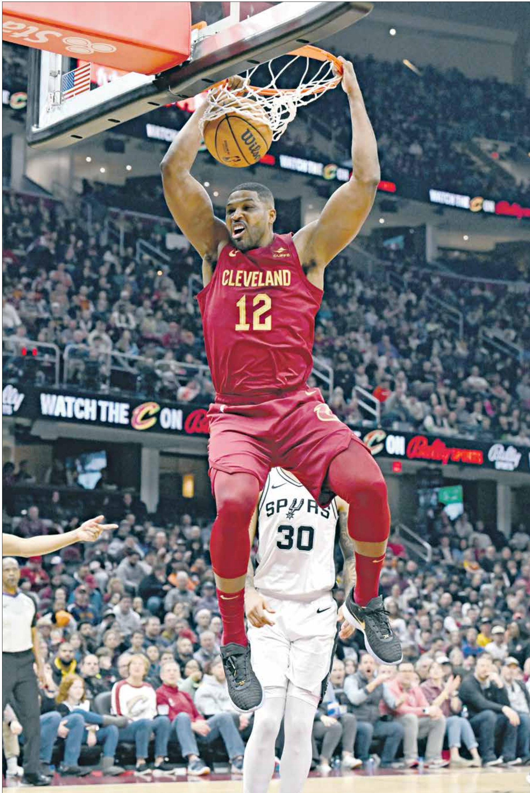
ظهور نتيجة إيجابية في اختبار المنشطات الخاص باللاعب جيسون ميلر

فرضت رابطة دوري كرة السلة الأمريكية للمحترفين عقوبة الإيقاف لمدة 25 مباراة على تريبستان طومسون، لاعب وسط فريق كليفلاند كافالييرز، بسبب ظهور نتيجة موجبة في اختبار المنشطات. وذكرت رابطة السلة الأمريكية في بيان أن عينة طومسون، بطل دوري كرة السلة الأمريكية للمحترفين لعام 2016 مع كليفلاند كافالييرز، جاءت موجبة بمادتي إيبوتامورين وليغاندول، وهذه المواد محظورة بموجب قانون مكافحة المخدرات الخاص برابطة الاندية واللاعبين.