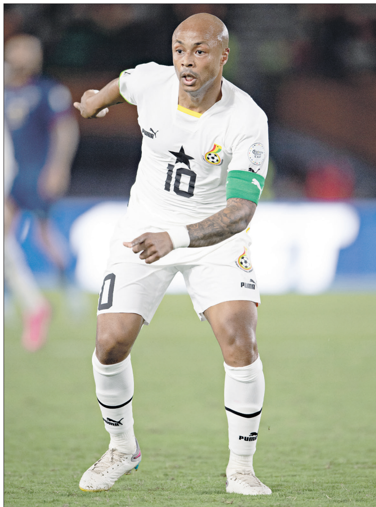
حذف الحري أيو عدداً من الأرقام القياسية

وَرَع النجم أندري أيو، في أول نهائيات كأس أمم أفريقيا، خلال المسابقة التي أقيمت في بلاده، وكان عمره آنذاك 18 عاماً فقط منذ ذلك الحين، غاب عن نسخة 2013 فقط، بعد استبعاده من طرف مدربه، جيس كويسبي أيبيا، بعد التحاقه بمعسكر المنتخب الغاني بعد الموعد النهائي المحدد، وكان ذلك التأخير ناتجاً عن إصابة يملك لاعب لوهافر 112 مشاركة مع منتخب بلده مع غانا، منها 36 في كأس أفريقيا، و24 هدفاً. كما استطاع أندري أيو معادلة رقم الدولي الكاميروني السابق، ريغويرت سونغ، بعد خوض المواجهات في كأس أمم أفريقيا لكرة القدم (36 مباراة لكل منهما).