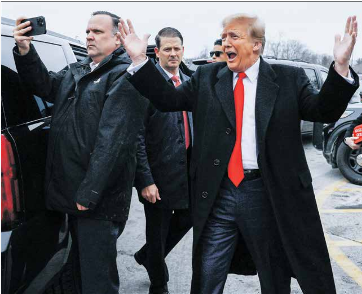
ترامب في نيوهامبشير، الثلاثاء