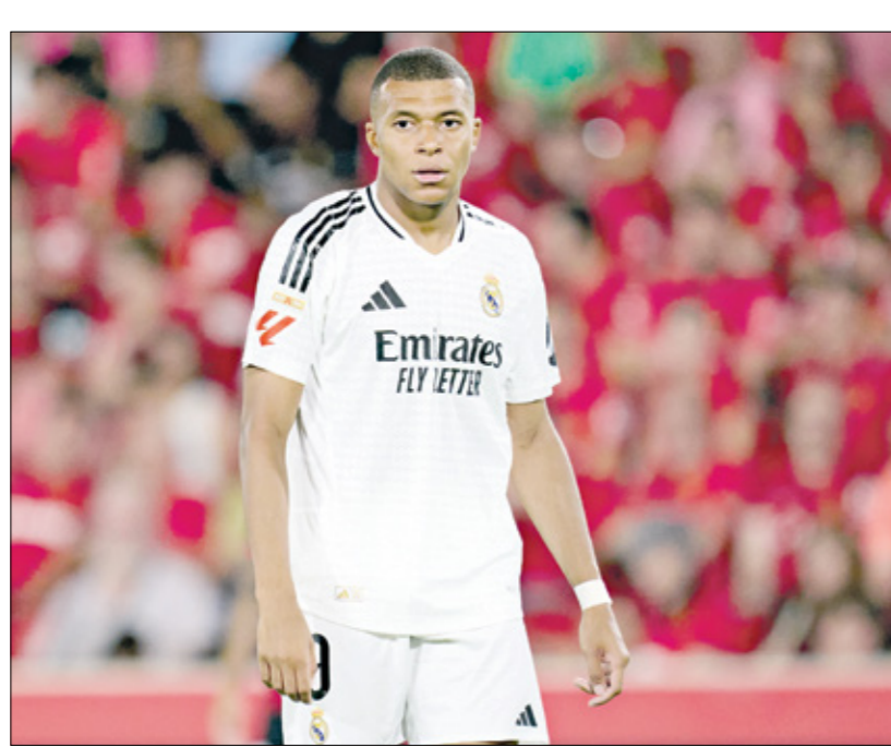
مبابي اللع للرياء مع صفوف باريس سن مرتان

وسيقدّم مباراة رائعة بسبب الجودة التي يتمتع بها، سيتمتع المشجعون بذلك، وسيعود ريال مدريد إلى ملعبه بعد ثلاثة أشهر تقريباً من آخر مباراة خاضها واحتفالاته بالفوز بالبيغا ودوري أبطال