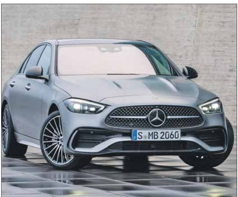
تعمل السيارة بمحرك تيربو مزدوج 2,0 لتر بقوة 255 حصاناً (مرسيدس)

كشف رئيس وزارة الصناعة والتجارة الروسي، دينيس مانتوروف، قرب اعتماد السيارة الفاخرة في الشرق الأوسط «أوروس»، بعدما كان وزير الصناعة والتجارة، دينيس مانتوروف، أعلن في السابق أن سيارة «ليموزين» من مشروع «كورتيج» المنتجة في روسيا تحت العلامة التجارية «أوروس» أصبحت متاحة للبيع في عام 2019، وأن تصدير السيارات إلى الخارج قد يبدأ في عام 2020 أو 2021. على أن يبدأ بيعها وفق سعرها المقدر بنحو 10 ملايين روبل، تعادل 150,3 ألف دولار.