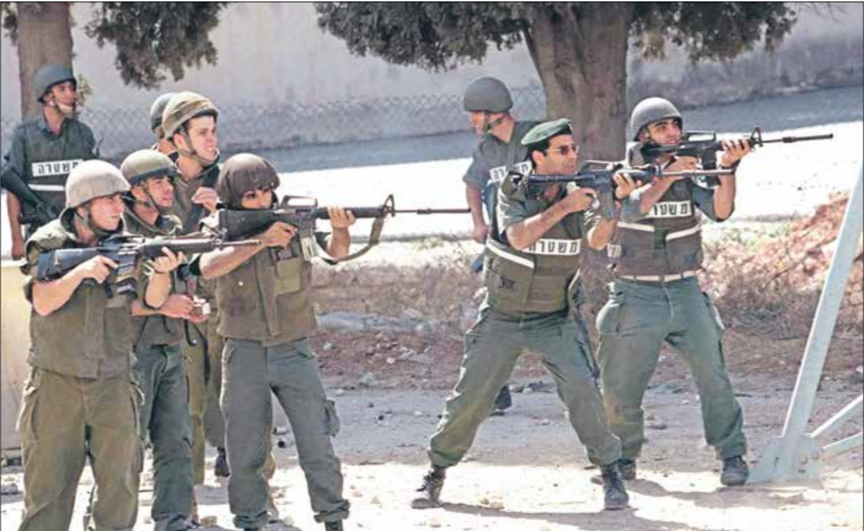
اللقطة من البحث عن صور الطبيعة إلى الصحب والخوف بسبب الاحتلال

■ عملت مصوراً حربياً في عدة وكالات، وكُنْتُ قد وثقت الانتفاضة الأولى وإنشاء السلطة الفلسطينية والانتفاضة الثانية والعديد من الأحداث السياسية الهامة في فلسطين، حدثنا أكثر عن أهم هذه التجارب وكيف تنظر إليها اليوم؟