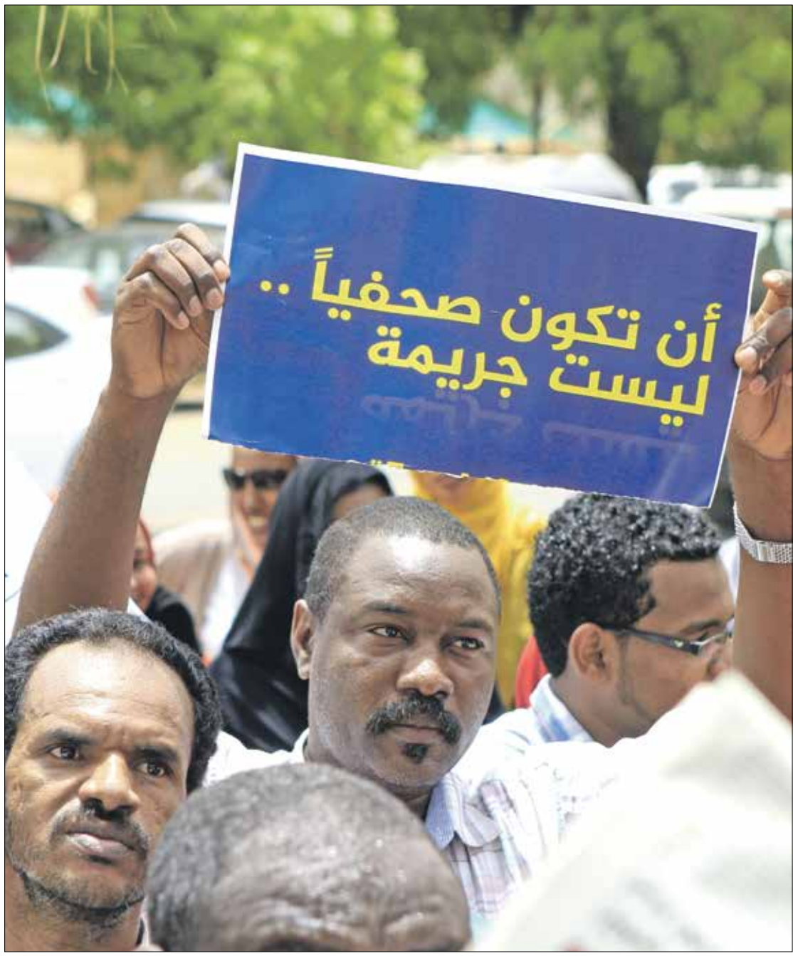
من تظاهرة سابقة للصحافيين السودانيين في الخرطوم، 2014