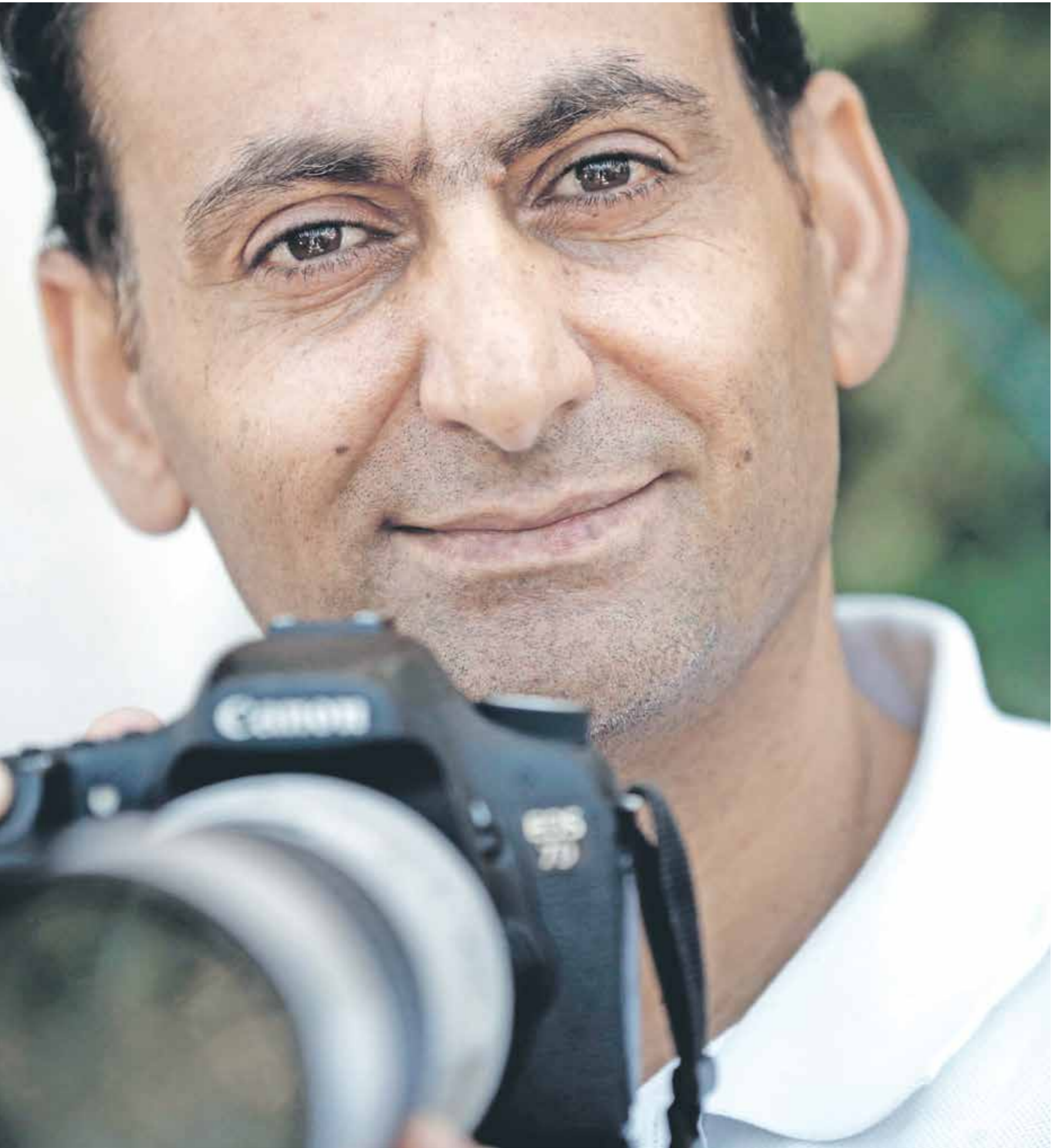
الصورة وحدها لا تكفي، الأحداث تعبير حقيقي

■ حسب سوزان سوتناغ، من دون السياسة من الممثل أن تكون سوزان المذيع في التاريخ، ببساطة غير واقعية أو ضريبة عاطفية مثقلة، وهي تربط التأثير العنوي للمصور بمسئول الوعي السياسي للإنسان، كيف يمكن أن نترجم هذه الفكرة في السياق الفلسطيني اليوم؟