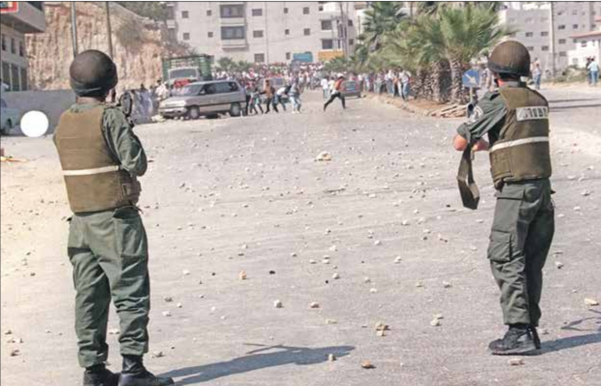
الصورة لتخزيع الذاكرة وتوسعها

■ ما الفرق بين الصور الهاري والمصور المحترف؟ قد تستغرب قولي إن المصورين الهواة أهم بكثير من المحترفين إذا حضروا في زمن اللقطة الصحيح، وإذا كان لديهم الوعي والمعرفة بأهمية الصورة والحدث، أما المحترف، إذا لم يكن يملك القدرة على التجدد والابتاعات من جديد، فستصبح صورة منمنمة وخالية من الروح، وتصبح مجرد عمل تقني من أجل المعش، وهذا ما يفشل كل حرفة عليك أن تكون محترفاً أبروح الهواة، حتى تتجدد وتنبعث من رمام المهنة البار.