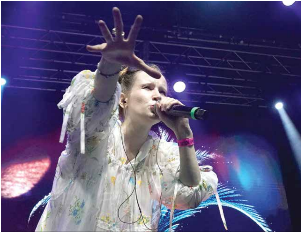
المغنية الروسية موبيلوشكا

حتى تلك التي حصلت بعد 2014، عام ضمّ روسيا شبه جزيرة القرم لشمير مونيوتشكا إلى أن الفنانين الروس واصلوا في ذلك الوقت إحياء حفلاتهم في أوكرانيا، من دون فرق كبير بين حفلة موسيقية تُنظم في سان بطرسبرغ، وأخرى وفي خاركييف التي دمرتها الحرب الروسية الحالية. تتابع، «كان بإمكاننا الذهاب إلى تلك المناطق، وتأدية أحيائنا الروسية بلغتنا، ولم يكن يتعرض لنا أي أحد»، مضيفةً أنّ «الناس هناك يحفظون أغنيائنا»، ما يتغير هذا المشهد في الحفلات الأوروبية، إذ برزت مئات المغنيين بعزورين عن أرائهم، بل أسمى بالآحرى إلى أن أجعلهم في «مخفاً».