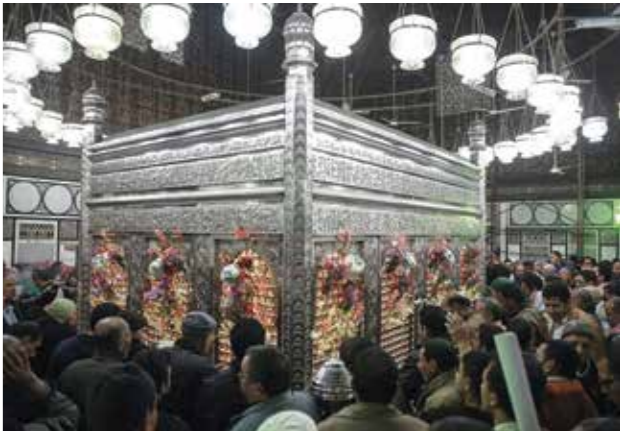
اصبح نعينع قارئاً لمسجد الامام الحسين في سن مبكرة (أحمد زكريا/الأنطوخ)