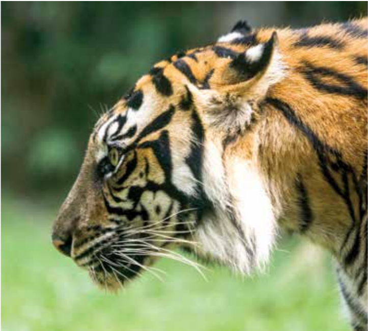
يُفك ما يصره إله عشرة من هة نهور سنويا