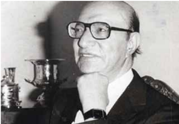
تولقت عائلة القارئ بالموسيقار محمد عبد الوهاب (فيروزكا)