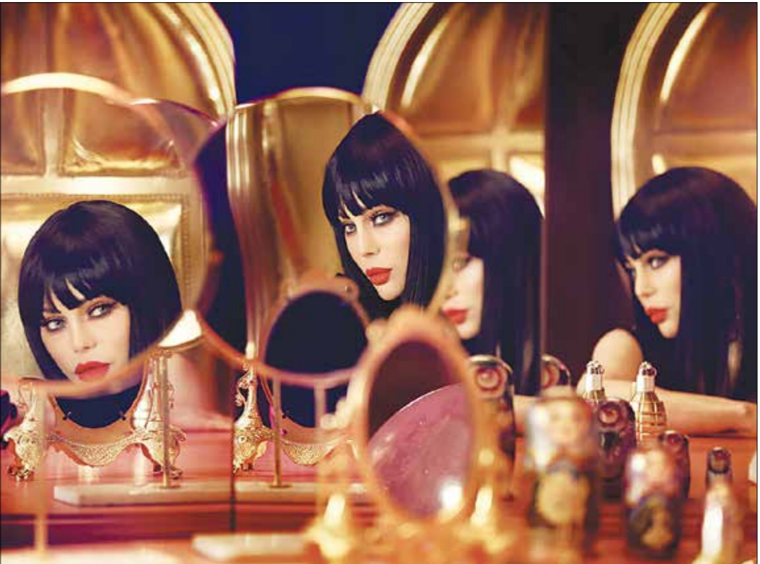
تعود هيفاء وهبي للبطولة مع السينما المصرية بعد غياب ثماني سنوات