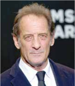
فنانان ليندون وكاّن

تعرف الرئيس الراحل أنور السادات إلى أحمد نعينع، عندما استمع إليه لأول مرة في حفل القارئ الحربية، التي كان نعينع