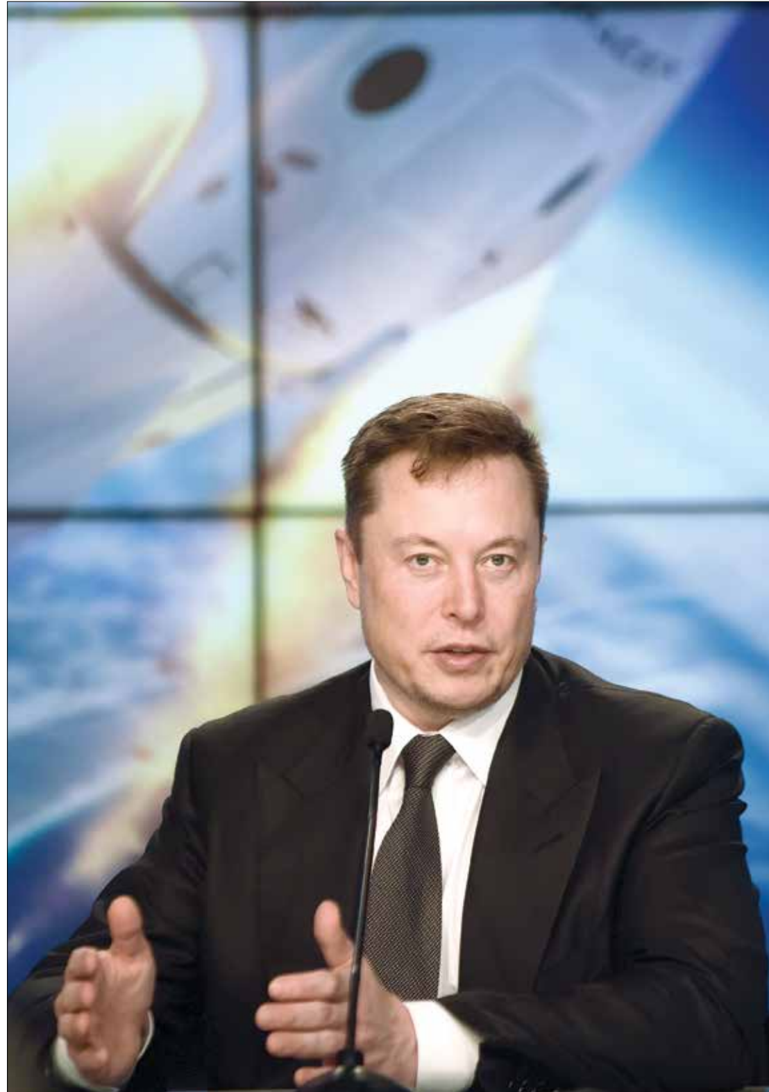
يصف ماسك نفسه بأنه «مؤيد بالمطلق لحرية التعبير»

وفي تغريدة ماسك الثلاثاء على شبكة التواصل الاجتماعي التي ستكون ملكه قريباً، لاحظ أن ثمة «رد فعل شبيهاً بالأجسام المضادة من أولئك الذين يخشون حرية التعبير»، ورأى أنه «معتبر جداً»، وأشاد المحافظون الأميركيون وأنصار الرئيس البرازيلي اليميني المتطرف جايير بولسونارو بمشروعه، معتبرين إياه نهاية لشكل من «الرقابة». وثمة ترقب لمعرفة الطريقة التي سيعيد بها الرجل الأكثر ثراء في العالم ترتيب الأمور على شبكة يبلغ عدد مستخدميها النشطين يومياً 217 مليوناً، أكثر من 80 في المائة منهم خارج الولايات المتحدة. وتحاول «تويتر» منذ سنوات وضع