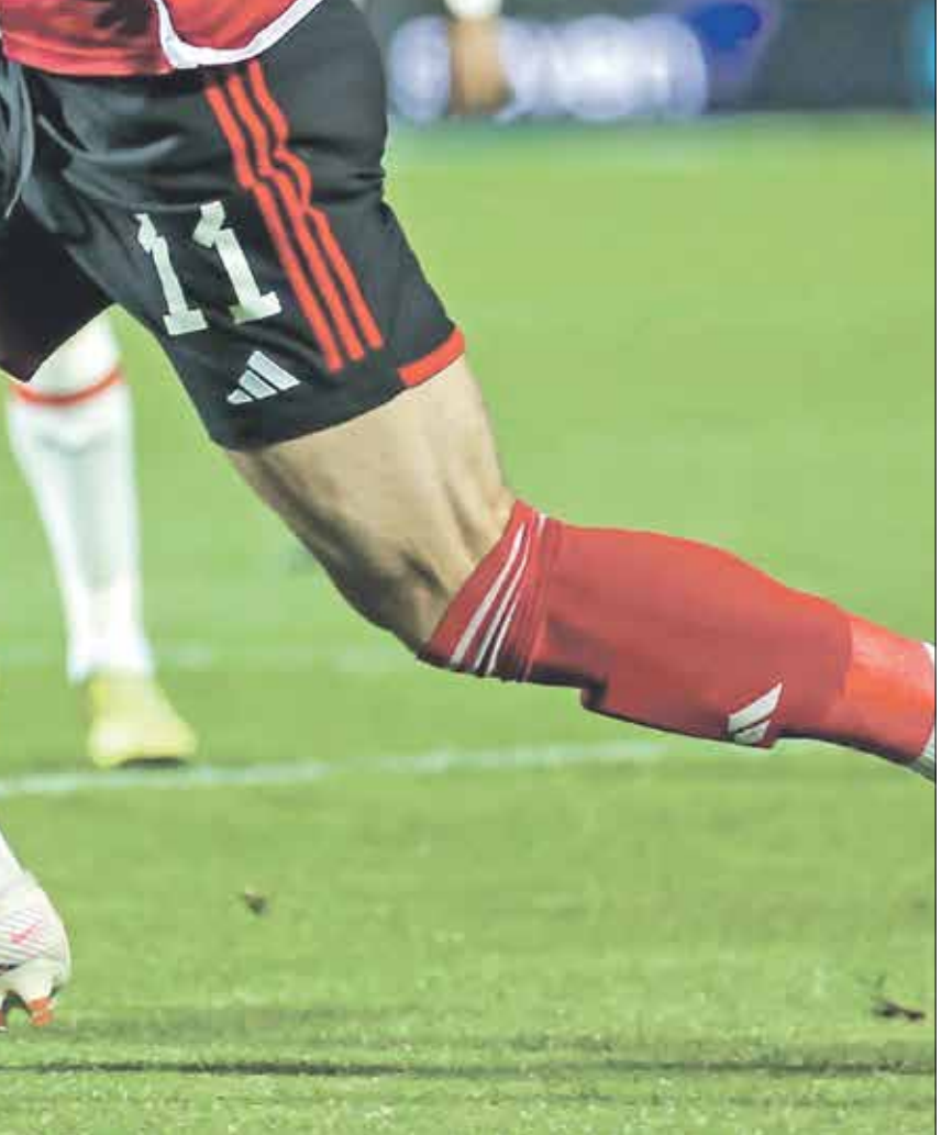
الزمالك عاد من بعده في اللقاء الأخير