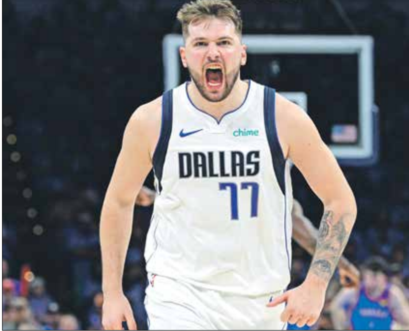
الراق دونسييتش نجمية الدوري الأميركي

الجديد من النجوم الذين سيقودون الدوري الأميركي إلى مستقبل مالي غير مسوق. كما أكد كوبيان أن عدد اللاعبين الذين سيضمون إلى قائمة المليارديرات سيزداد بشكل كبير خلال السنوات المقبلة، فحتى الآن، يوجد ثلاثة مليارديرات فقط في تاريخ الدوري وهم: ليجرون جيمس، وماجيك جونسون، ومايكل جوردان، لكن مع استمرار ارتفاع العقود والرواتب، من المتوقع أن يضم المزيد من اللاعبين إلى هذه القائمة. وأشار كوبيان إلى أنه «قريباً سيكون هناك لاعبون يكسبون أكثر من مالكي الفرق، وهذا أمر جيد، لأن الدوري لن يستمر دون اللاعبين». ويرى كوبيان أن هذه التحولات المالية ليست مجرد نتيجة لزيادة العائدات، بل تعتمد أيضاً على التزام اللاعبين بتقديم أفضل ما لديهم في كل مباراة وزيادة إثارة الجماهير، فكلما زادت شعبية الدوري وزاد عدد المتابعين، ارتفعت الإيرادات التي تحصل عليها الأندية، مما يمنح إيجابياً على رواتب اللاعبين، لذلك من الواضح أن الدوري الأميركي للمحترفين في كرة السلة يدخل عصرًا جديدًا من العقود المالية الضخمة، وأن لاعبين مثل لوكا دونسييتش يوقعون على أعقابهم على عقود الهائلة. ومع تزايد الاهتمام العالمي بالدوري وزيادة الإيرادات التجارية، يبدو أن اللاعبين سيكونون المستفيد الأكبر من هذه الطفرة الاقتصادية.