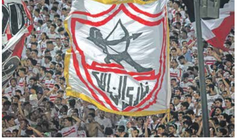
انصار الزمالك احتفلوا طويلا بعد الانتصار