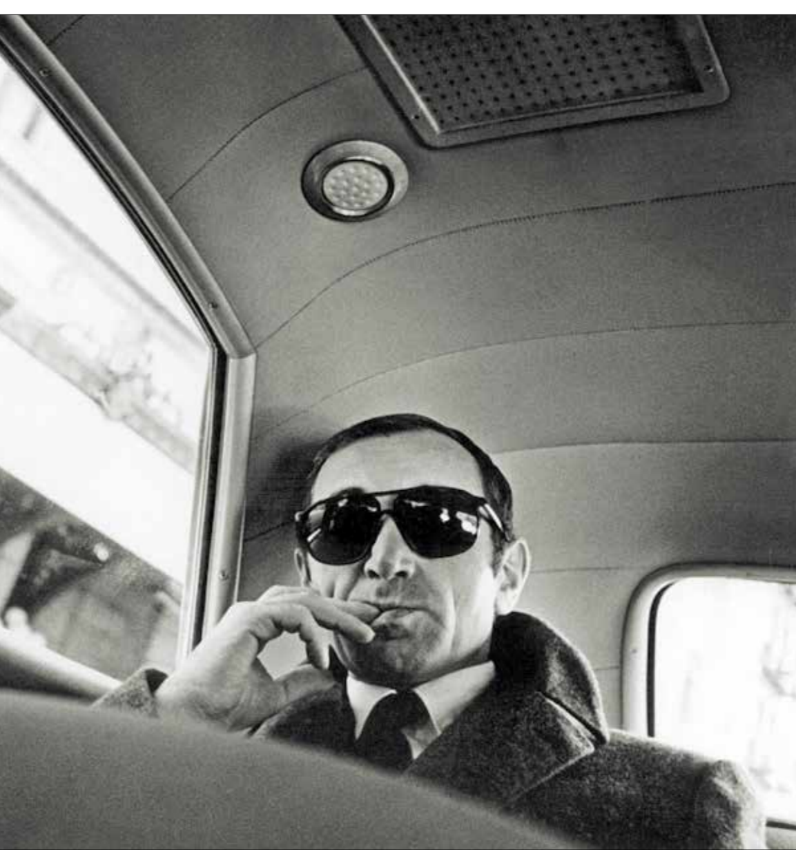
الزاور في نيويورك عام 1956