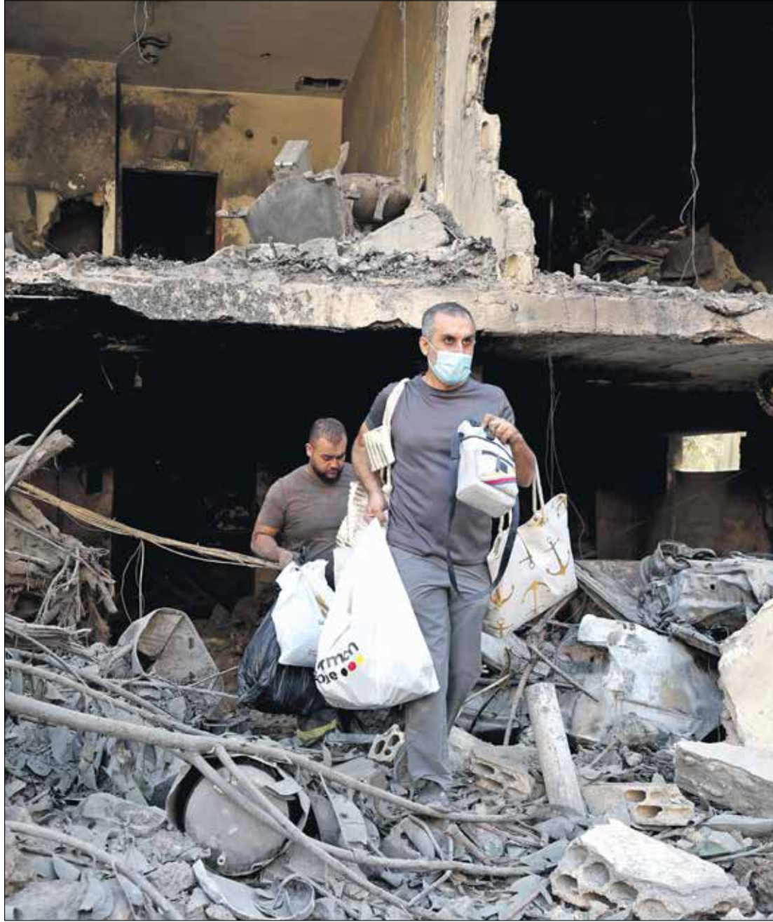
من قصف منطقة البسةة في بيروت، أكتوبر 2024

استراتيجية إسرائيلية لصياغة صورة مغايرة لحرب الإبادة