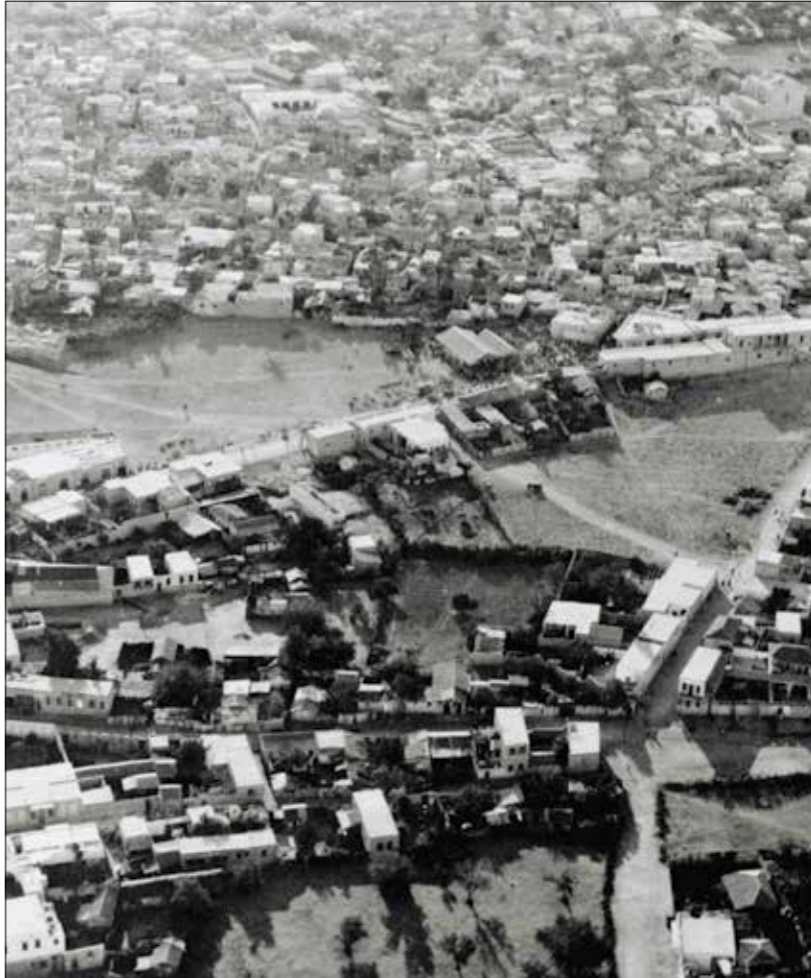
مدينة اللد عام 1948

«في الماضي كنتُ جميلة وشهيرة جداً، وكان يأتي إلي الناس من كل أنحاء العالم لنزيارتي». هذا ما يقوله صوت أنثوي في بداية فيلم «اللد» (Lyd) للمخرجين رامي يونس وعسارة إيمان فريدلاند. في هذا العمل، تروي المدينة الفلسطينية العريقة حكايتها الحضارية في أعماق التاريخ، كونها مدينة حيوية كانت تربط فلسطين بالعالم ذات يوم، وكيف انتهى تاريخها المزدهر بالاحتلال الإسرائيلي بعد تسكة عام 1948. اليوم، تضم المدينة عدداً قليلاً من الفلسطينيين الذين يواجهون معاملة تمييزية وعنفًا يوميًا يحارسه المستوطنون المتطرفون في المجلس الذي أُنتج عام 2023، نرى واقعا بعيداً مُتخيلًا لم يحدث فيه هذا المنع في أعقاب قرار وقعه وزير الثقافة والرياضة الإسرائيلي ميكي زوها، زعم فيه أن الفيلم يقدم «صورة مشوهة للواقع» من شأنها أن تثير العنصرية والتوترات في المدن التي يقطنها عرب ويهود. من بين الموسوعات التي سافها الفنون الإسرائيلي، تطرق الفيلم إلى المذبحة التي ارتكبتها القوات الإسرائيلية بحق سكان اللد عام 1948، ووصفها وزير الثقافة بأنها محض