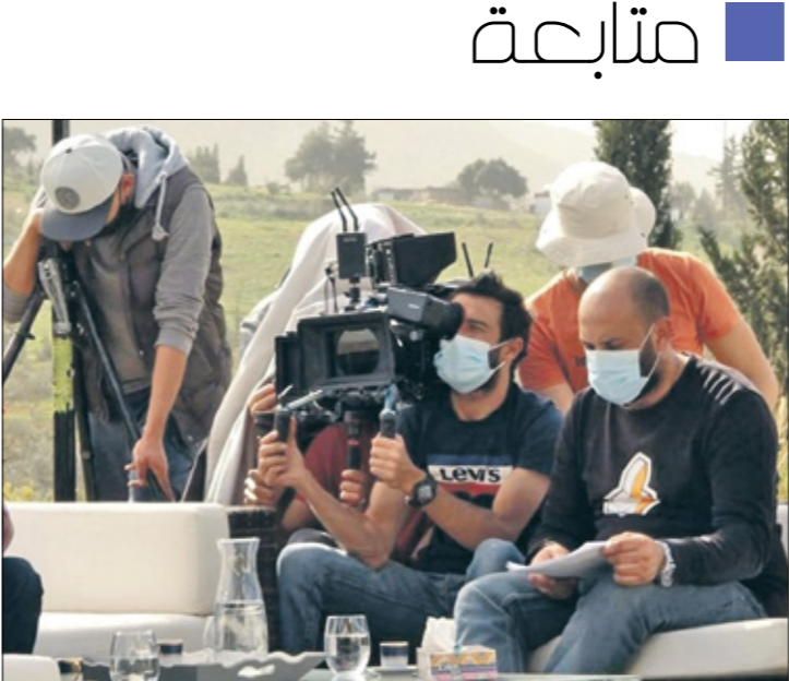
من كواليس تصوير المسلسل (بيسوت)