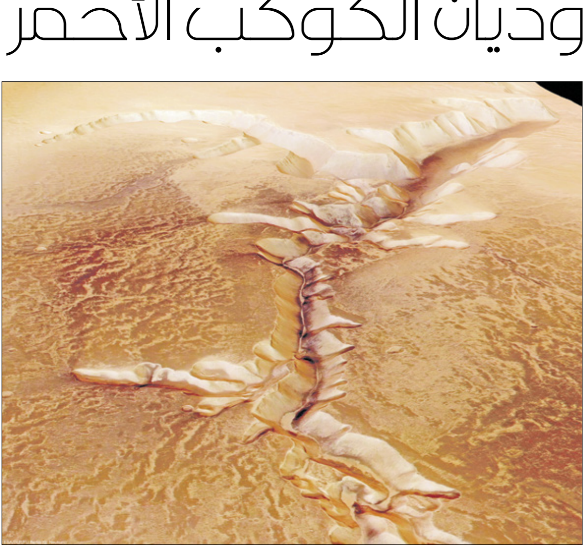
شهد المريخ منذ 50 الف عام تغيرا سريعا للمناخ

اظهرت دراسة جديدة اجراها علماء من معهد «علوم الكوكب» في ولاية أريزونا الأمريكية، أنّ تاريخ نشوء الوديان العميقة الواقعة في القطب الشمالي للمريخ، كشف أنّ الكوكب الأحمر شهد منذ 50 ألف عام تغيراً سريعا للمناخ. وقال أحد مؤلفي الدراسة، وكبير الباحثين في المعهد الأميركي رودريغز: «إنّ العلماء يعتبرون أنّ طبقات الجليد في مناطق خطوط العرض الوسطى للمريخ تشكلت بعد ذوبان قبعته القطبين في الوقت الذي كان فيه محور الكوكب مثالا، وقد خلفت تلك العملية آثارا، مثل الوديان العميقة في القطب الشمالي للمريخ». وأوضح العلماء أنّ قطبي المريخ تغطيها القبعتان الجليديتان الكبيرتان، اللتان تحتلّان عن الغبيغيم على الأرض من حيث بنيتهما وبعادهما، وتتألفان من الماء المتجمد وغاز ثاني أكسيد الكبرون.