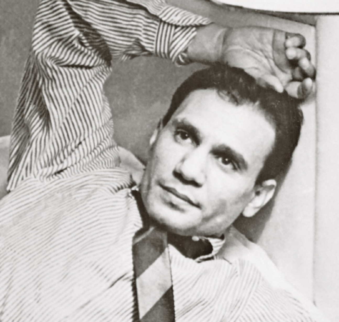
سافعت لوزة بولوبو في صغوده شعبيا ورسميا

سجلها في الإذاعة باسم عبد الحليم شبانة، وليس كما جاء الرواية الشائعة. يبدو أن معظم ما قدمه لم يكن من اختياره، فكثير من تلك الأغاني لم تكن قادري على إسباح المجال لدى الجمهور. لهذا، دائماً ما يؤكّد أن أغنية تلك الفترة، احتفظ بصديقه كمال الطويل ومحمد الموجي، ويدين لهما بفضل كبير في صقل أسلوبه، وكانت الحانها من صنعته. أغلب الظن أن عبد الحليم حاول إنكار بعض ملامح تلك الفترة، فعند سؤاله عن أول أغنية سجلها، كان يجيب بانها قصيدة «فاءة» من الحان الطويل. والحقيقة