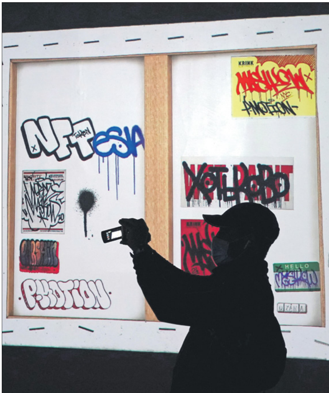
معرض نيويورك للأعمال الرقمية

وستعرض يومياً أعمال خمسة فنانين تتناوب على مدى 60 يوماً حتى 25 مايو/ أيار المقبل، تعود إلى 300 فنان مختلفي الاختصاصات، ويوضح إد ريبكو، المؤسس المشارك ومدير معارض «سوبر تشيف» التي تقدم أعمالاً رقمية منذ العام 2016 أن كل عمل معروض في المعرض سيباع لاحقاً بالمزاد.