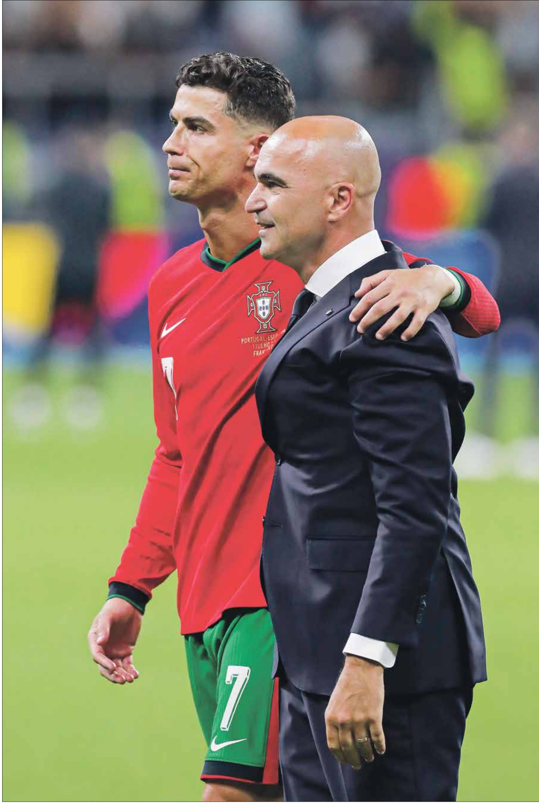
رونالدو مع مارتينيز خلال يورو 2024 في ألمانيا

أعلن المدير الفني للمنتخب البرتغالي روبرتو مارتينيز قائمة فريقه لمواجهة دوري الأمم المقبلين أمام كرواتيا واسكتلندا، وأكد أنه لا يزال يثق بكريستيانو رونالدو وجواو فيليكس. وقال في مؤتمر صحفي «كريستيانو يمرّ بلحظة طيبة وهو مهم للمنتخب الآن، مستواه فريد، قدّم كلّ شيء في يورو 2024 الأخيرة، مع أنه لم يهز الشباك».